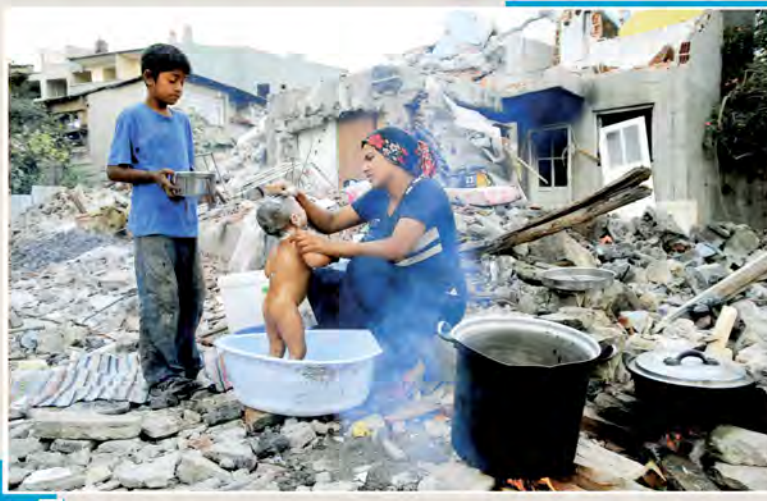
1 Di beşa fotografarê de fotografê bi ser navê "Banyo ve çadirda yaşam (banyo û jiyana di konan de)" Paşa İmrek qezenc kir.

Xwedyiyan Xelatên Rojnamegeriya Kurdî û Şehîdên Çapemeniyê yê Mûsa Anter ku her sal wekî kevneşopiyê tê lidarxistin aşkera bûn