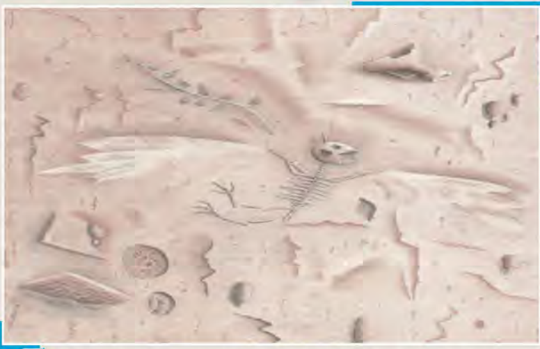
1 Di beşa karîkaturan de karîkaturê Raif Zor hêjayî xelatê hate dîtin. Endamên juriyê herî zêde di vê beşê de zehmetî kişandin.