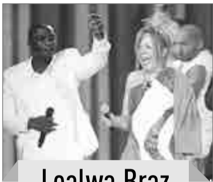
Loalwa Braz mirî hat dîtin

Li paytexta Îranê Tehranê bi pêşengiya Enstîtuya Yunus Emre ya Tehranê (TYEE) û Mala Sînemavanên Îranê, Heftaya Filmên Tirkî yê Hemdem dest pê kir. Şahiya ku Balyozxaneya Tirkîyê ya Tehranê ji piştigariyê didê, bi filmê 'Uzak İhtimal' a derhêner Mahmut Fazil Coşkun dest pê kir. Di şahiyê de dê 7 filmên tirkî derkevin pêşberî temaşevanan. Di çarçoveya şahiya ku dê heta 28'ê mehê berdewam bike de, dê filmê Bal (derhêner Semih Kaplanoglu), Sêwas (derhêner Kaan Mujdecî), Bîr Zamanlar Anadolu'da, Kiş Uykusu (derhêner Nuri Bilge Ceylan), Uç Yol (derhêner Faysal Soysal) û Kelebegin Ruyası (derhêner Yılmaz Erdoğan) bîn temaşekirin. TEHRAN