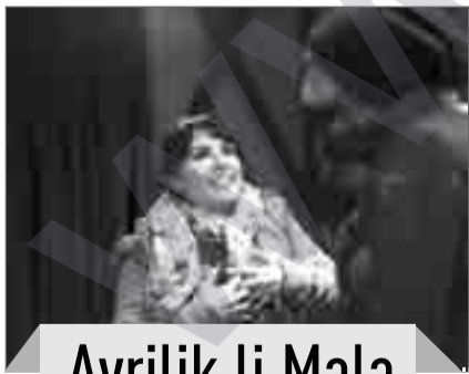
Ayriklîk li Mala Şanoyê ye

Stranbêja muzika latînî Kaoma Loalwa Braz (63) ku bi strana Lambada deng vedaye, li Rio de Janerio di siwareya xwe de bi awayekî şewitî hat dîtin. Polîsan diyar kir ku wan siwareya şewitî li cem mala wê dîtiye û di maşînê de tûpa gazê hebûye. Koma Kaoma bi strana Lambada albûma wan bi qasî 30 milyon heb hatibû firotin. Solîsta komê Koalwa di sala 1985'an de piştî demeke dirêj li Fransayê ma, ji wir veqetiya û çû Brezilyayê. Loalwa li gelek deverên cihanê konser dan, li Paradis Latin, Meridien û Madison Square Gardenê derket ser dikê. Loalwa li herêma Jacarepagua ya Rio de Janeriyê di sala 1953'yan de hatibû dinê, endamê Akademiya Hunerê ya Fransayê bû û xwedîya nîşana zîv bû. AMED