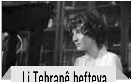
Li Tehranê hefteya filmên tirkî