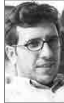
U. Serhildan Xonçikij

Derbe, OHAL, KHK... Tirkîya bi nê çîyan kewt 2017î. Teşebûsê derbeya 15ê temuze ra dima OHAL ame îlankerdiş, nameyê KHK ser o gelek qerari ameyî girewtîş û hema zî eynî çîyî dewam kenî. Miyanê nê dewamkerdişî de seba qederê Tirkîya