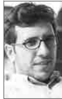
U. Serhildan Xonçikij

Awanbiyayışê Komara Tirkiya ra heta seserra 21. fikro esasî û serdest 'Kemalîzm' bî. No fikr ser o dewlete xo idare kerde û pêrûnê bedilyayışî ke qanûno bingehîn de ameyî viraştış no fikr ser o nêbi zi binê tesîrê nê fikrî de ameyî viraştış.