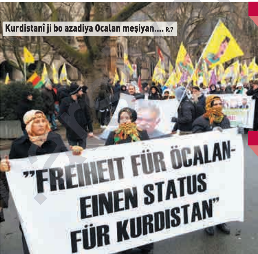
Kurdistanî ji bo azadiya Ocalan meşîyan.... R.7