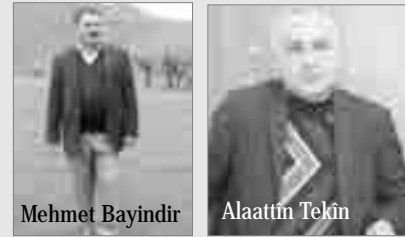
sayîş. Bayindir vano zafane parekerdîşê mi wextê prosesê çareserî de mi pare

kerdbîyî û suc hesabîyayîşê înan nîno qebulkerdîş.