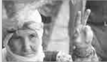
Hemserekê HDPyî Selahattîn Demîrtaşî ke fotografê ci yê profilî yo, yenî per-