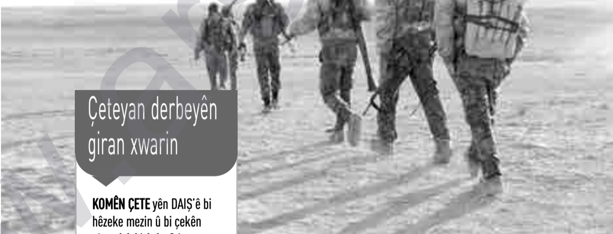
Çeteyan derbeyên giran xwarin

Bendava Firatê (Tebqa) li ser çemê Firatê ye û 50 km'yan dûrî Reqqayê ye. Bendav 4 km û nîvan dirêj û 60 m'yan bilinde. Li pişt bendavê deryaya Esed heye û 80 km dirêj û 8 km'yan jî fireh e.