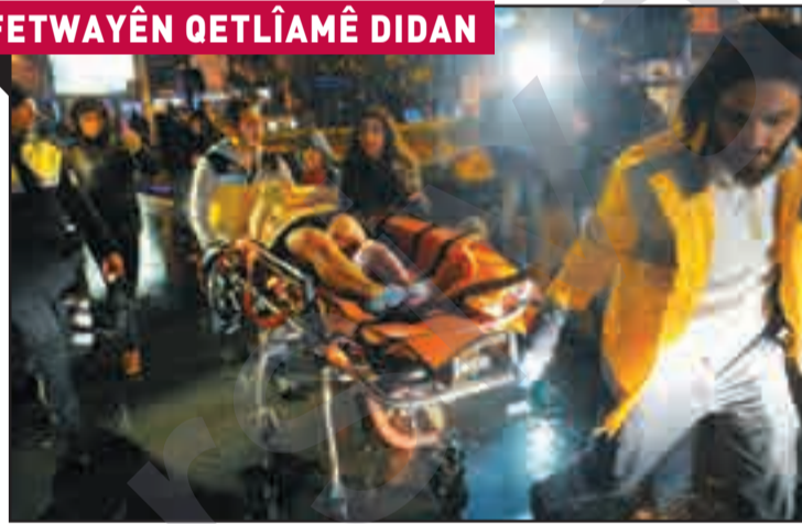
FETWAYÊN QETLÎAMÊ DIDAN