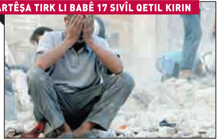
ARTÊŞA TIRK LI BABÊ 17 SIVÎL QETIL KIRIN