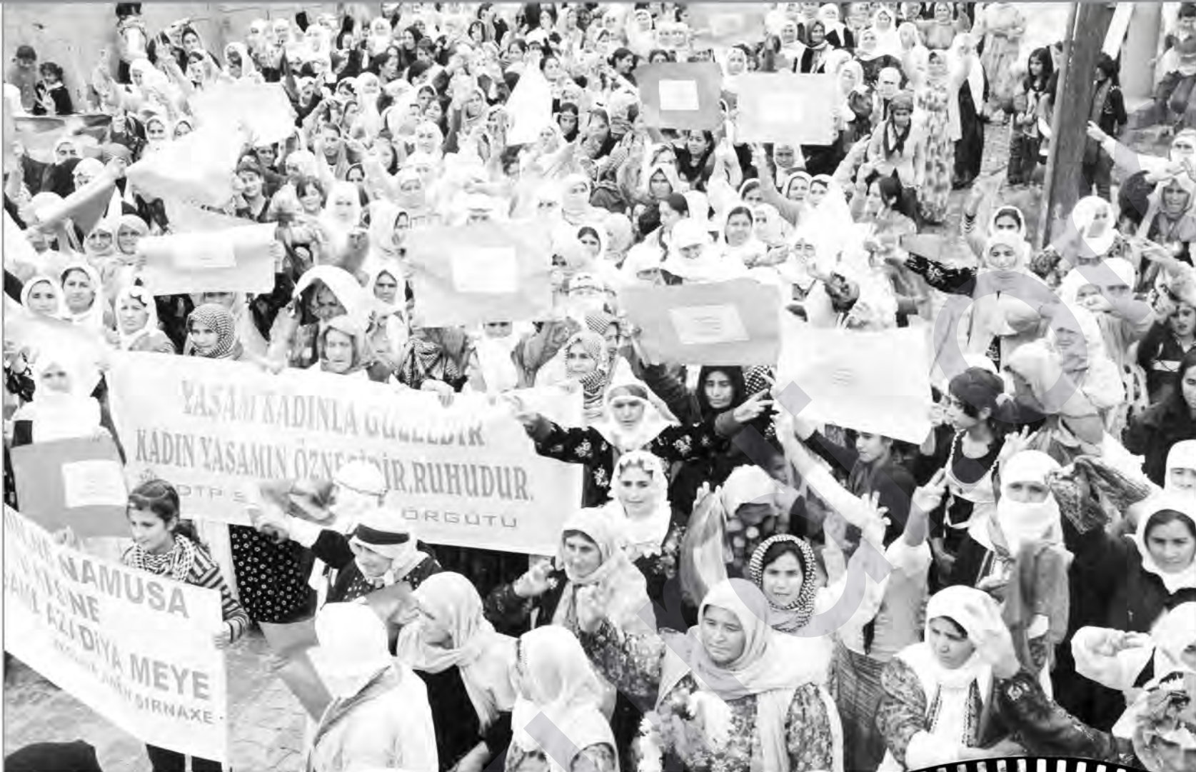
Bi damezirandina PKK'ê re li Kurdistanê serdemeke nû dest pê kir.

Her wiha Amed dibêje ku gavên ku hatine avêtin pir bi zehmet pêş ketine û wisa rehet çênebûne. Amed li ser pêşketina tevgera jinan ev agahî dan: “Tiştên ku dihat kirin di nava şert û mercên şer de pêş diket. Di nava şertên ku her tişt li gorî zîlamên bû de lêgerîna wekhevîyê bû. Serokatîyê di serî de ji bo jinan cuda-