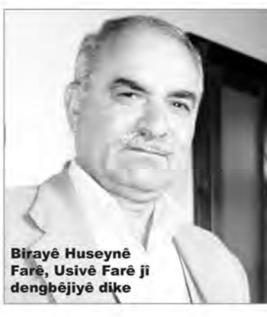
Birayê Huseynê Farê, Usivê Farê jî dengbêjiyê dike

Huseynê Farê di nav kurdan de dengbêjekî navdar e û bi taybetî jî li derdora herêma Amedê tê zanîn û tê hezkirin. Huseynê Farê her çiqas heta îro hindik kasetên wî mabin jî bi dengê xwe yê zîz û dilşewatê hê jî tê guhdarîkirin. Herî zêde strana dengbêjî a bi navê 'Xalê Cemil' û 'Têlî' jî aliyê kurdan ve tê hezkirin.