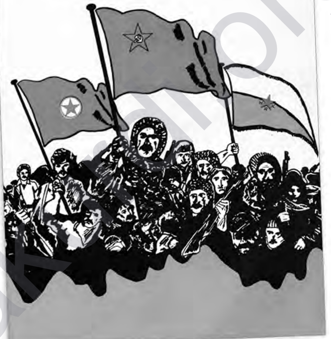
Bi sedema l'emîn salvegera Pêngava 15'ê Tebaxê ev afîş di sala 1985'an de hatiye amadekirin.

ŞANLI 15 AĞUSTOSUN I. YILDÖNÜMÜ HALKIMIZA KUTLU OLSUN