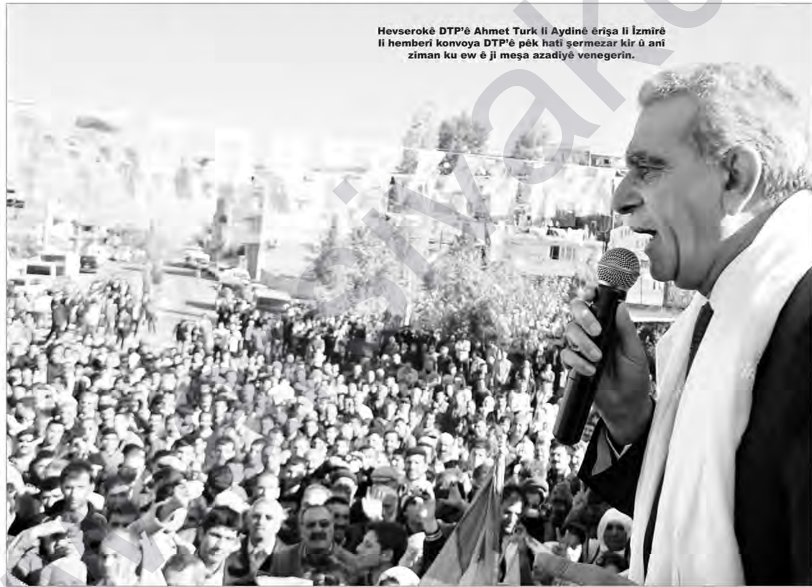
Hevserokê DTP'ê Ahmet Turk li Aydinê êrişê li İzmirê li hemberî konvoya DTP'ê pêk hatî şermazar kir û anî ziman ku ew ê ji meşa azadiyê venegerin.

dema ku em di hîlbijartinan de 20-30 hezar dengan bistînin de çawa serbikevin? Divê em ve têkoşîna bikin ya gel û divê em bi serbikevin. Hûn de di sandiqê de vîna xwe danin holê." Turk, êrişê li dijî konvoya wan hati jî bi birxist û diyar kir tu caran êrîşên bi vî rengî wan têk nabin û wiha berdwam axaftina xwe kir û got, em li gorî dek û dolabên wan tevnagerin." Turk, da zanîn ku çareseriyekî bê kurd û bê muxatabê pêknayê û wiha got: "Em amadene jî bo têkoşîna. Lê heya hûn muxatabên pirsgerêkê li ber çav negirin hûn nikarin tu çareseriyê pêknayê. Bêyî kurd tu çareserî pêknayê. Wekî minakên cihanê yên mîna Afrîkaya Başûr, Îspanya û Îrlanda yê heya muhatabên pirsgerêkên neyên cem hev tu çareserî pêknayê." AYDIN (DİHA)