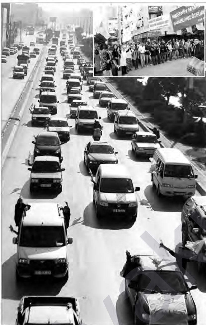
hemberî êrîşê bê deng mane û mudaxaleyî êrîşkaran nekirine.

Lê beriya ku konvoya DTP'ê bi gehije Konakê rastî êrîşa nijadperestên tirk hat. Konvoya ku Hevserokê DTP'ê Ahmet Turk li balefirgehê pêşwazî kir û vedigeriya DTP'ê Îzmîrê li semta Eşrefpaşa û Dortyola Hatayê ya Îzmîrê ji aliyê komek nijadperest ve rastî êrîşê bi dar û ber hat. Di êrîşê de camê gelek wesayîten konvoyê hatin şikandin. Ji nava konvoyê yek jê bigirani gelek kes birîndar bûn. DTP'yan diyar kir ku polis li