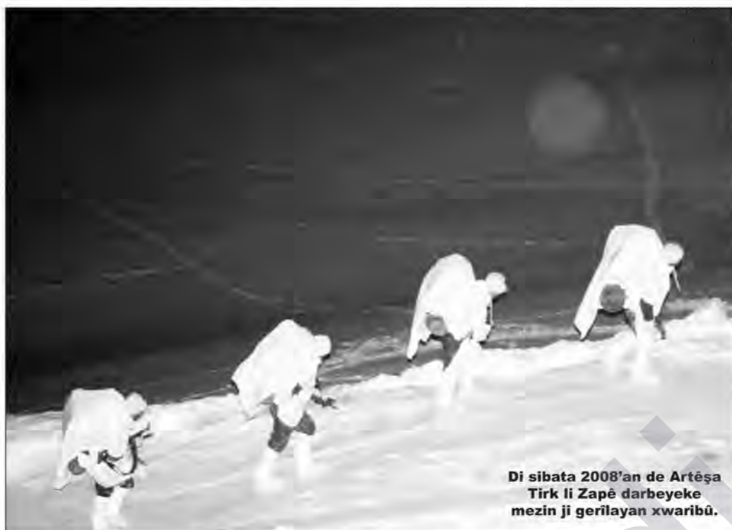
Di sibata 2008'an de Artêşa Tirk li Zapê darbeyeke mezin ji gerilayan xwaribû.

qabîliyeta operasyonî ya Artêşa Tirk kêmtir bûye û hêviya serketina li hemberî gerîla wînda kiriye û wiha got: "Du sedemên vî hene. Yekemîn di operasyonan de darbeyan dixwe û ya duyemîn jî, êdî nikare li hemberî windahiyan raya giştî îkna bike. Ji ber van du sedeman wekî berê tevî operasyonan nabin, ji yêrî berê zêdetir, operasyonên biçûk pêk tînin û girîngî didin teknîkê. Ji generalan, heta sûbayan û ji wan heta leşkerên jî rêze, îro bi sendroma PKK û kurd dijîn."