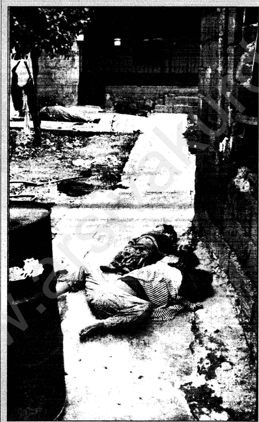
16 Mart 1988'de Saddam Hüseyin, Halepçe'de 5000 kişiyi zehirli gazlarla imha etti. Kentten sağ kurtulan olmadı.

1988 Newroz'u boğulan kent Halepçe'nin yasını tuttu. Ve fakat hayat devam etti. Saddam, kimyevi gazlarla Kürtleri boğmaya devam etti. Kurtarılmış olanlarda yaşayan kitleler Türkiye'ye sığındılar. Ardından Körfez krizi geldi. Bağdat diz çöktü. Teslim oldu. Kürtler ayaklandılar. Güney Kürdistan'ın hemen hemen tümü ele geçirildi. Ve Saddam yeniden Kürdistan'a saldırdı. Bu kez milyonlarca insan İran ve Türkiye sınırlarına yığıldılar. Bu dünyada bir benzeri daha olmayan bir halk hareketi idi. İngiltere'nin önerisi, Fransa ve ABD'nin onayı ile 36. Paralelin üstü korumaya alındı. Göçmenlerin büyükçe bir bölümü geri döndüler ve Kürt Federe Devleti ortaya çıktı. Bu gün Halepçe, Kürt Federe Devleti'nin sınırları içinde ve fakat savaş devam ediyor. Savaşanlar bu kez Kürt siyasi hareketleri. Kürtler, Kürtleri öldürüyor. Halepçe'de boğulan insanların anısına dikilen anıt da ne yazık ki bombaların tehdidi altında.