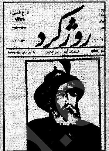
Bergê pêşîn a Rojî Kurd Nî: 1/1913

Kovara Rojî Kurd li Istanbulê bi Kurdî (Kurmançî-Soranî) û Tirkî derket. Xwedî îmtîyaz û mudîrê wê ye mesûl: 'Evdilkerîmê Silêmanîyê ye. Di bin navê kovarê de bi Tirkî weha hatiye nivîsîn: "Nuka mehê carekê derdikeve" Li ser qapaxa hejmara pêşîn a kovarê rismê Seleheddînê Eyyubî, li ser hejmara 2 rismê Kerîmxanê Zend, li ser ya 3. rismê Huseyin Ken'an Paşayê Bedirxanî û li ser ya 4. jî rismê bajarê Erzerûmê heye (x).