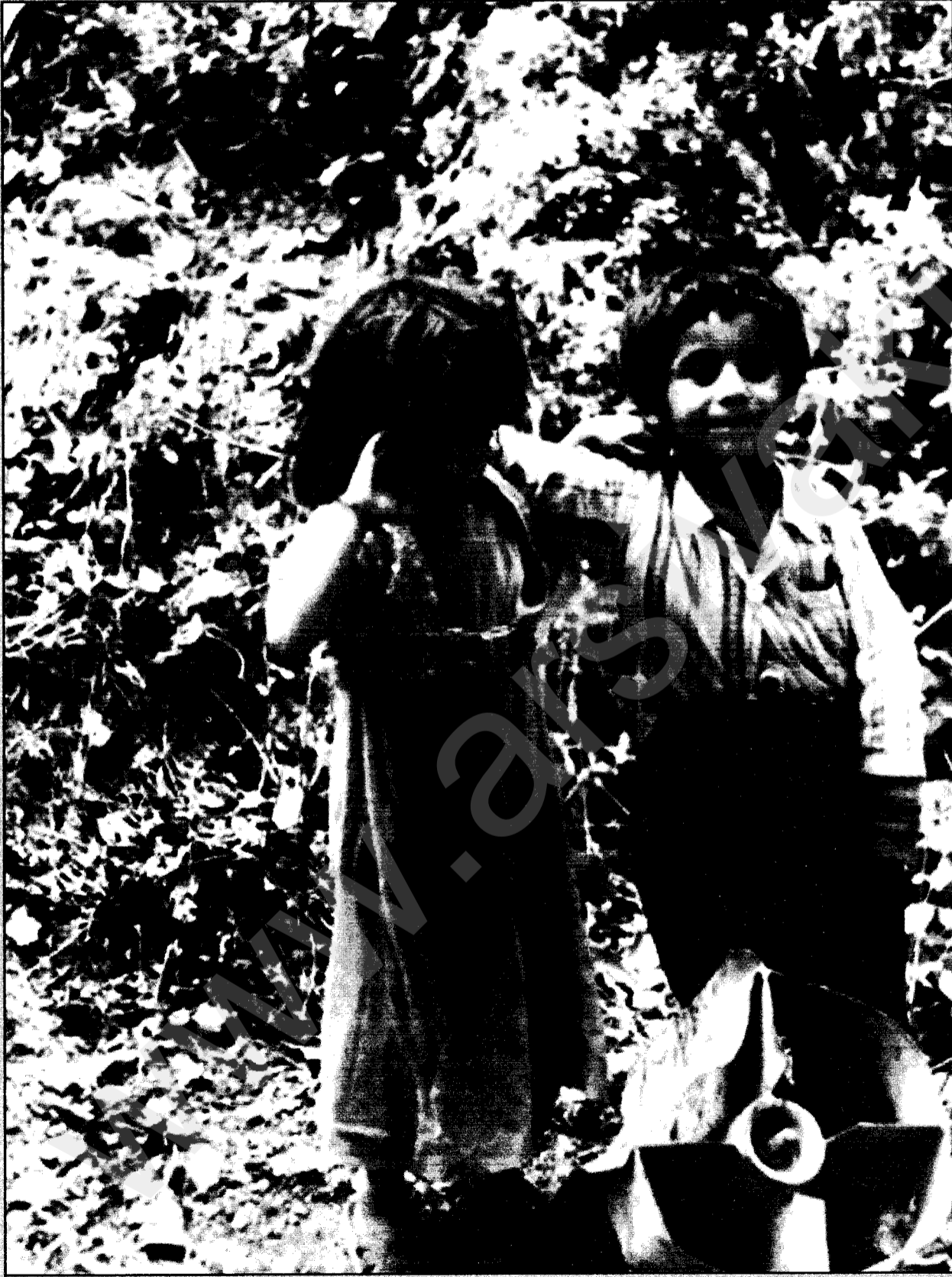
Yersiz-yurtsuz, işsiz ve aç insanlar Diyarbakır sokaklarında yatıyor. 50 bin kişi açlıkla yüzyüze. Her iki kişiden biri işsiz.

asıl, ölümün eşiğinde başını soka- cak bir dam altı bulamayıp Diyar- bakır sokaklarında, kaldırımında