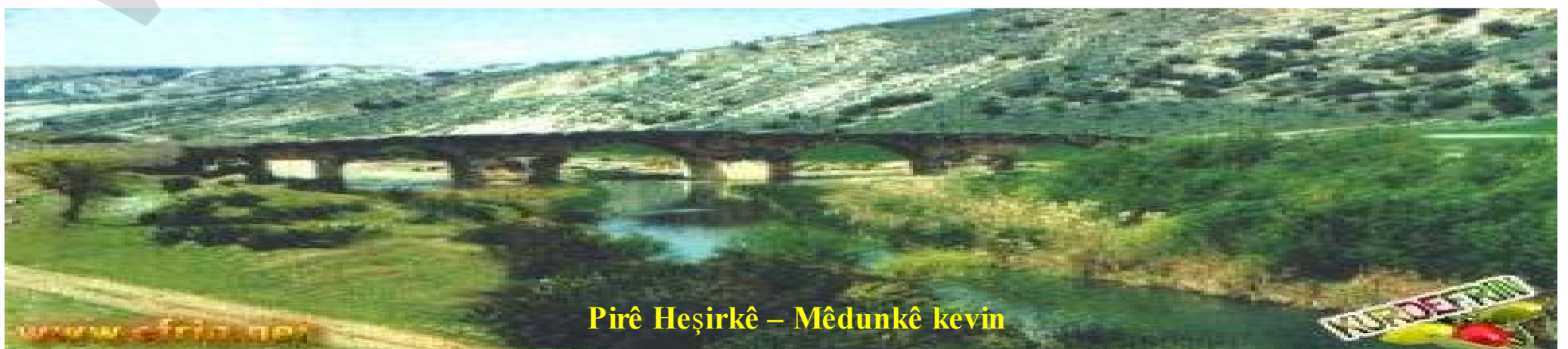
Pirê Heşîrkê – Mêdunkê kevin