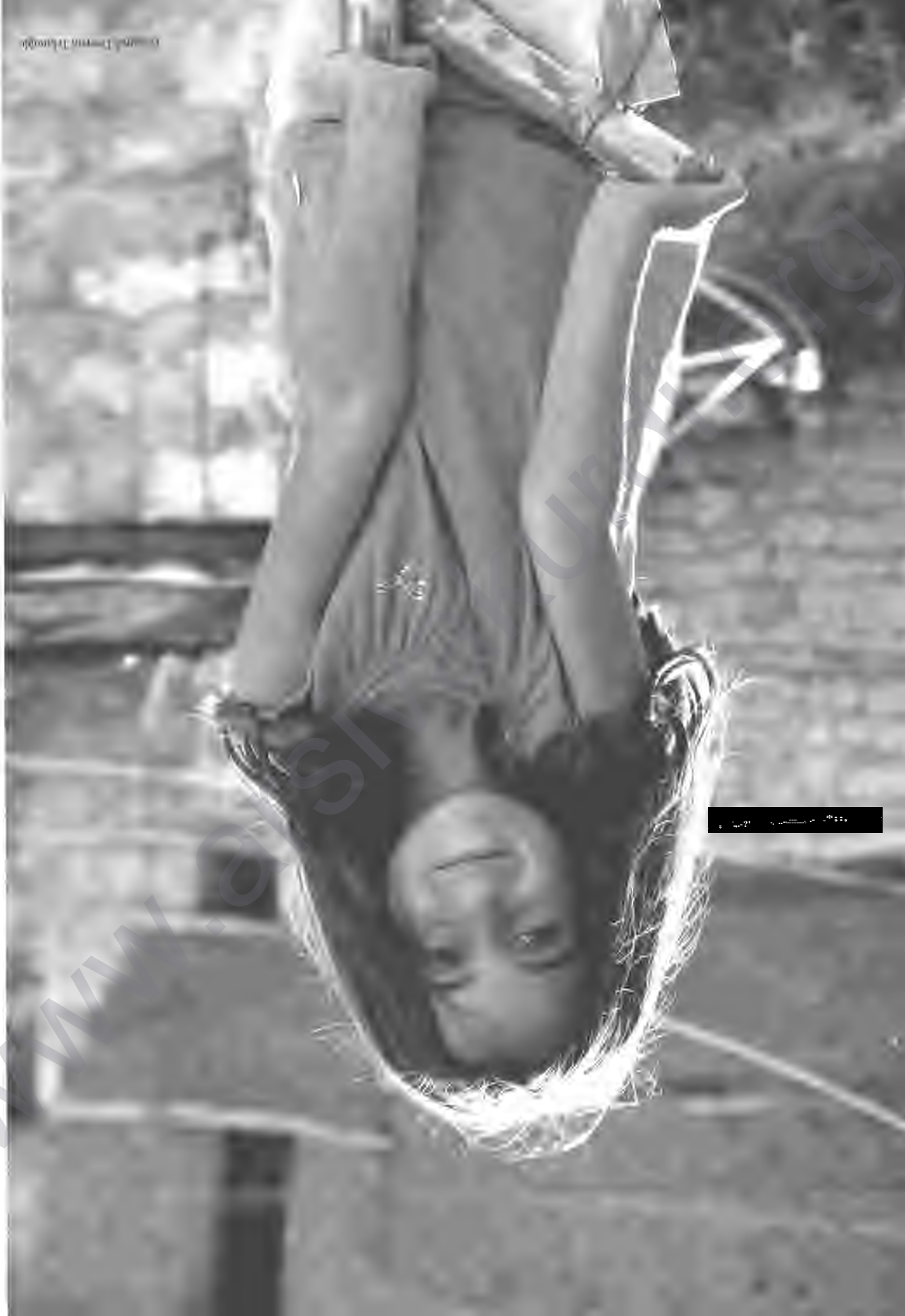
Figure 1. A young woman performing a handstand on a wooden deck.