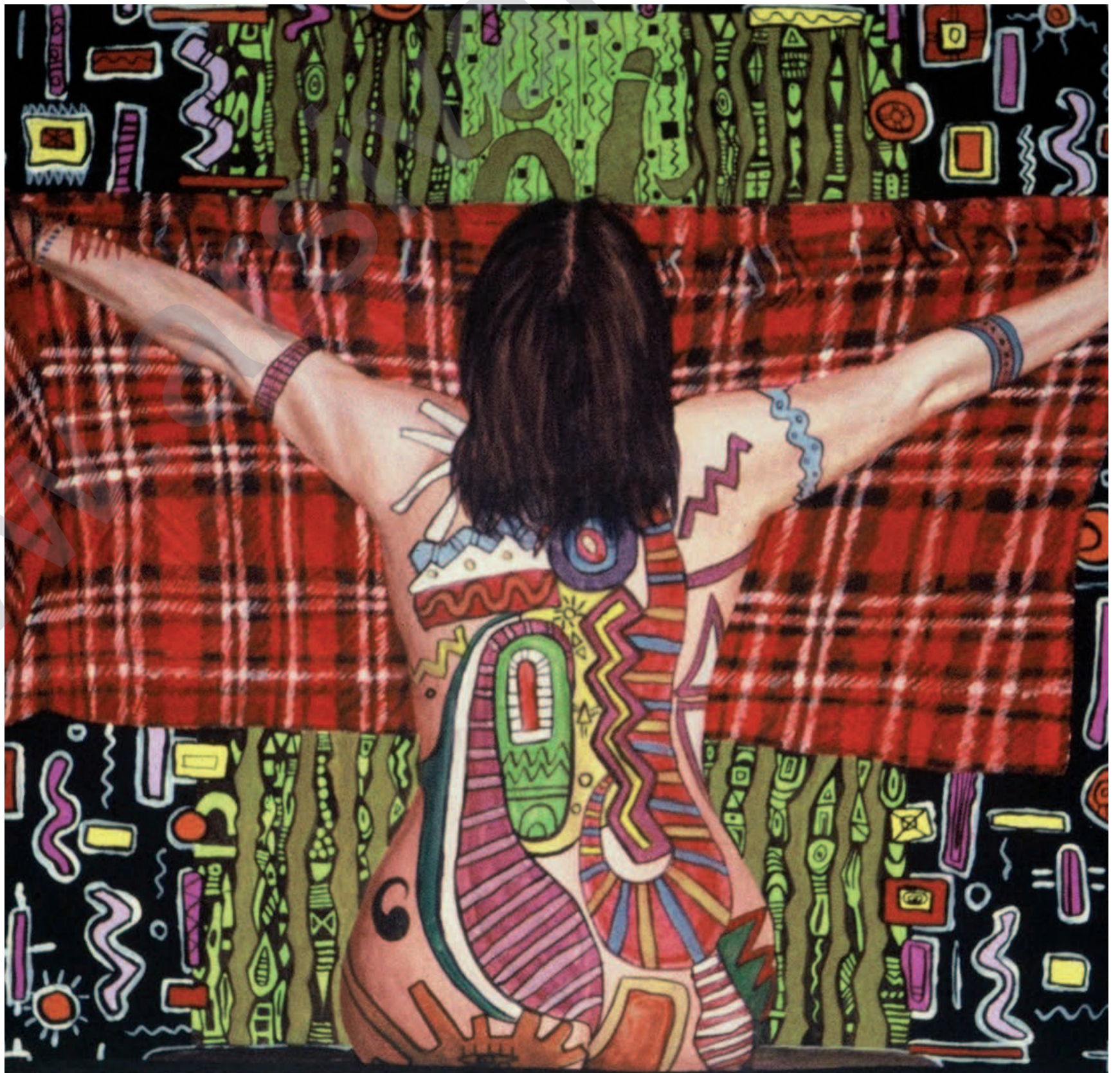
MOHAMMAD ISMAIL: Bênnav , boyaxa akrilî li ser tûwalê, 50 x 70 cm