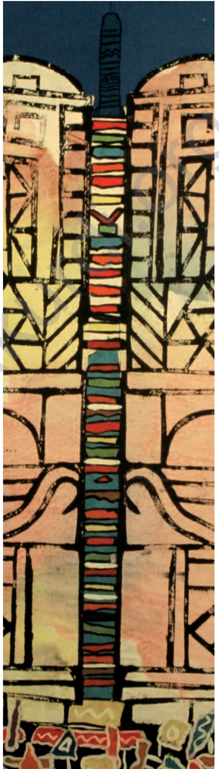
MOHAMMAD ISMAIL: Bênnav (Detay), kolaja bi mirekeb li ser kaxeza rengin, 70 x 50 cm