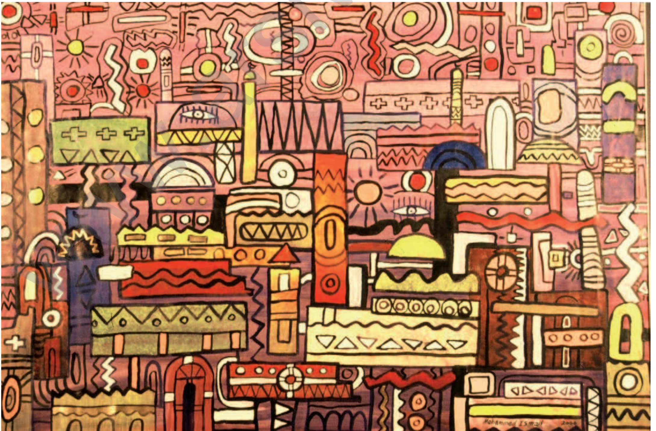
MOHAMMAD ISMAIL: Bênaw , kolaja bi mirekeb li ser kaxeza rengîn , 50 x 70 cm