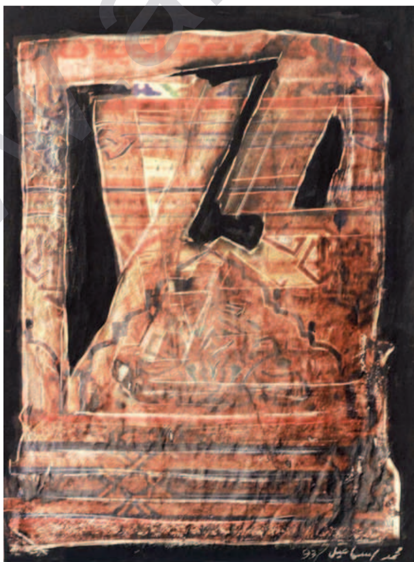
MOHAMMAD ISMAIL: Bênnav , kolaja bi mirekeb li ser kaxeze, 70 x 50 cm