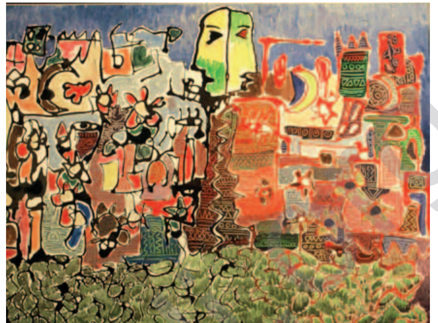
MOHAMMAD ISMAIL: Bênav, kolaja bi mirekeb li ser kaxeza rengîn, 50 x 70 cm

Musil, mezintirîn bajarê bakur ê nêzîkî Sûriyeyê û Tirkîyeyê, dê nîşan bide ka kurd û ereb dê bikaribin bi hev re Iraqê ji nû ve ava bikin an na. Ji şênîyên wî bajarî % 40 kurd, % 10 turkmen û % 50 jî ereb in. Piraniya efsêr û rêberên leşkerê berê yê Iraqê ji vir in û reh û rîşeyên rejîma berê, hem di warê siyasî, hem jî yê eşîrî de, li vî bajarî di kûr de ne.