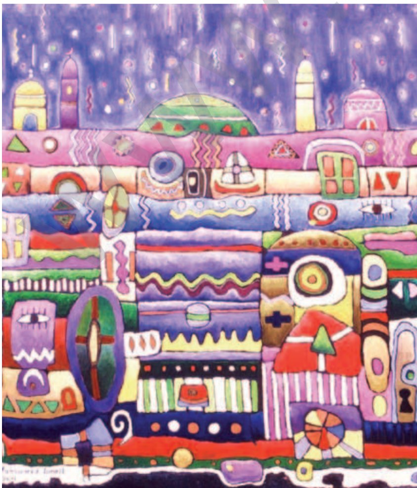
MOHAMMAD ISMAIL: Bênava , boyaxa rûnî li ser tûwalê, 100 x 100 cm

Le Monde diplomatique kurdî (Çapa elektronîk) Ji aliyê Independent Kurdish Media Group GmbH ve tê weşandin