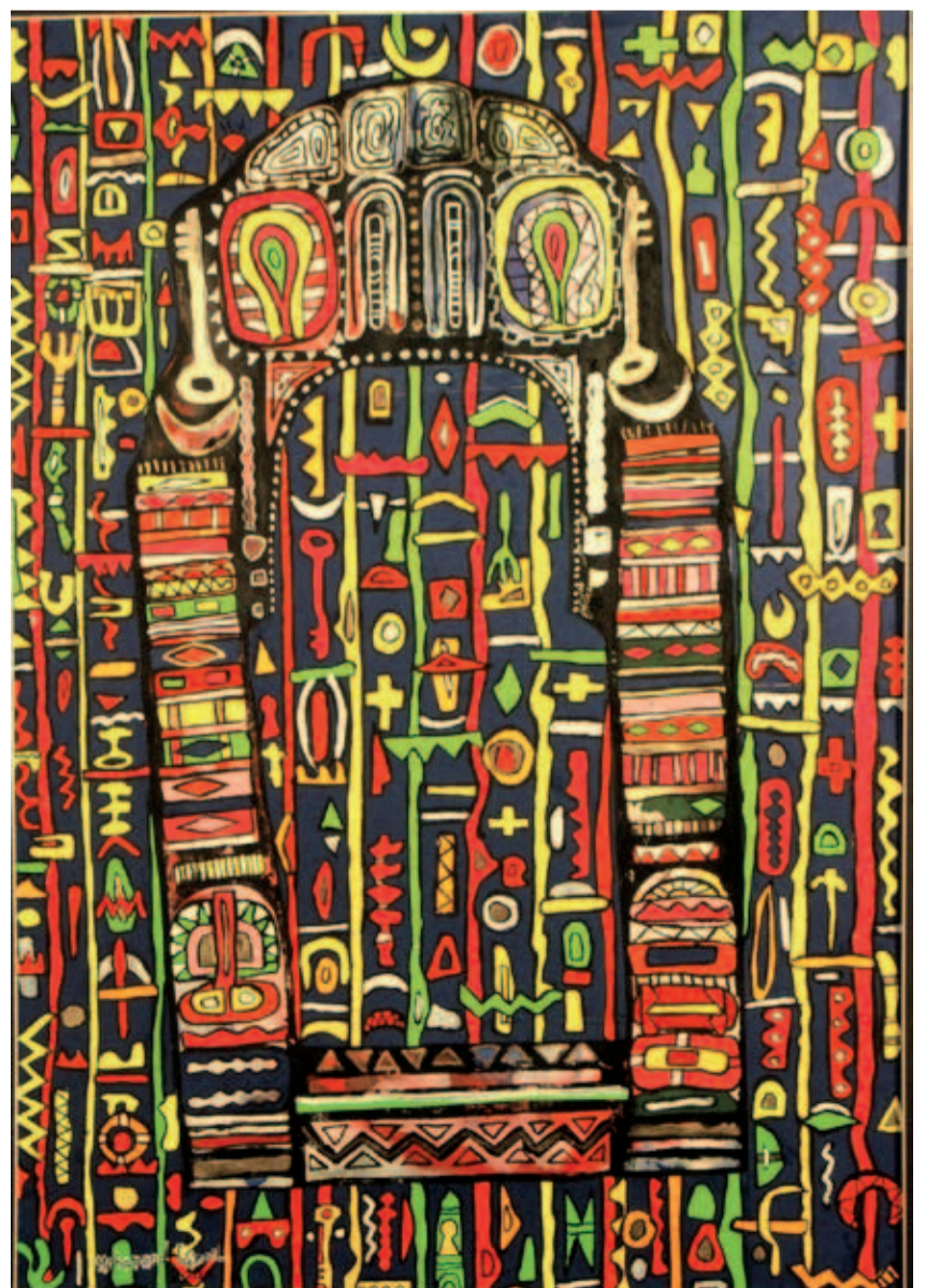
MOHAMMAD ISMAIL: Bênav, kolaja bi mirekeb li ser kaxeza rengîn , 70 x 50 cm