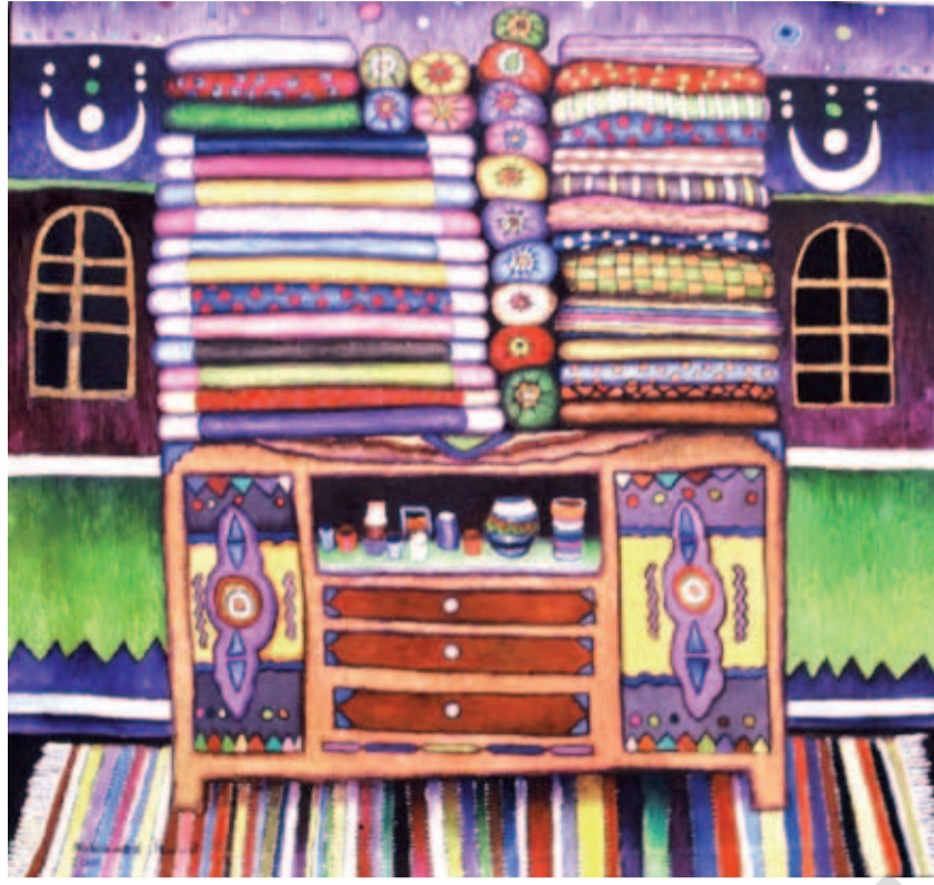
MOHAMMAD ISMAIL: Bênava , boyaxa rûnî li ser tûwalê, 100 x 100 cm