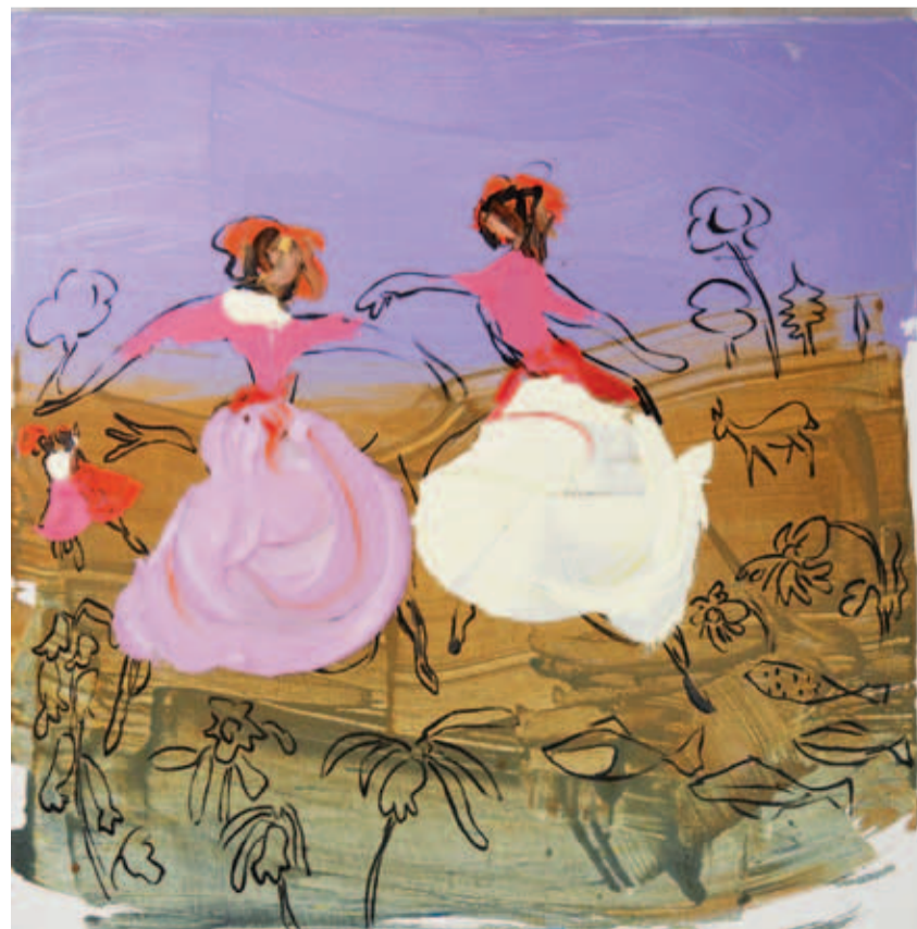
DARA ARAM: Qadên narîn, boyaxa akrîl li ser tûwalê, 36 x 36 cm

Wergera ji fransî: Ergîn Opengîn Redaksiyone: İbrahim Seydo Aydoğan