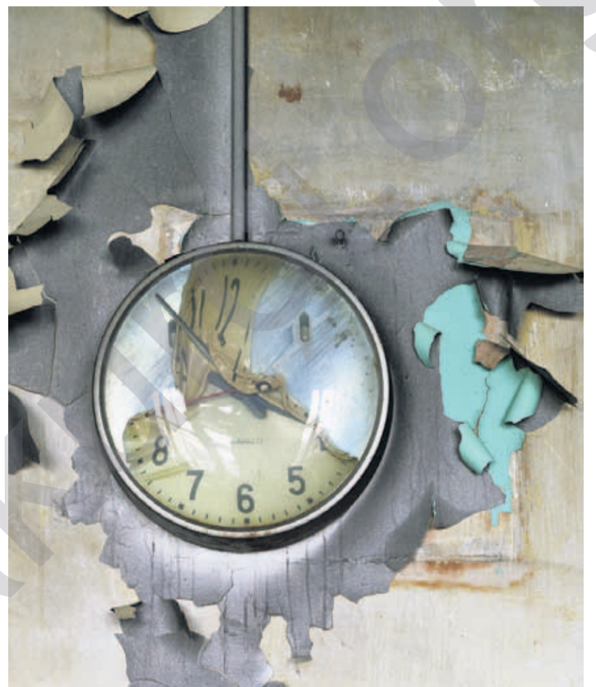
YES MARCHAND U ROMAIN MEFFRE: Saeta helandî, Detroi, 2008

Îcar eurobond (senada deynan a euro yan dolaran, n.w), ji ber heman sedemê, dê nebin çareserîyê pir baş. Li ser kaxezê, formula ku derfeta parvekirina deynên dewletê dide, ji alî hosteyên xelat-cezayan ve li ser bingeha rêjeya faîzê pêk hatiye, narîn e û ji alî siyasî ve jî zîrekî ye. (4) Ewropaya aborî ji kaosa deynan di nav kozmogonîyê zarokî de