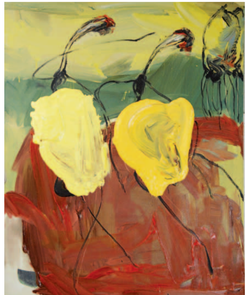
DARA ARAM: Erdê sor, boyaxa akril li ser tûwalê, 50 x 52 cm