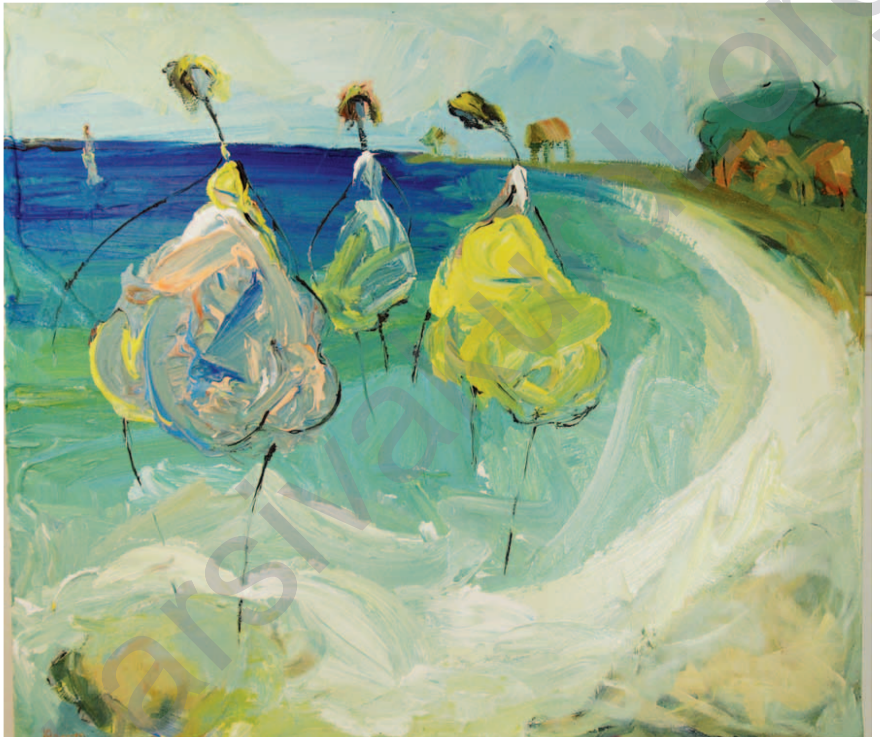
DARA ARAM: Kuba I.04, boyaxa akrîl li ser tûwalê, 52 x 54 cm

hewldanên herêmi di guherandina mayînde ya siyasetsnas dewletî de yek ji mînakên herî baş e. Di welaîkî wisa de ku bajarvaniyêke lezgin û cihêkariyêke zemîni û civakî lê heye, FNUR ya 1988ê damezrandî li dij cihûwarên bêistiqrar û ji bo birêvebirineke şaredarî ya demokratîk tîkoşiyaye. Di Meclîsa Damezirîner a 1988ê de, wê nivîsandina prensîpa fonksiyona civakî ya bajêr di zagona bîngehîn de bi dest xist, ku herweha tê maneya bicihkirina mekanîzmeyên beşdarîya yekser a gel. Ev jî çarçovekirina hiqûqa mulkiyeta ferdî ji bo sedemên berjewendîya giştî diheve.