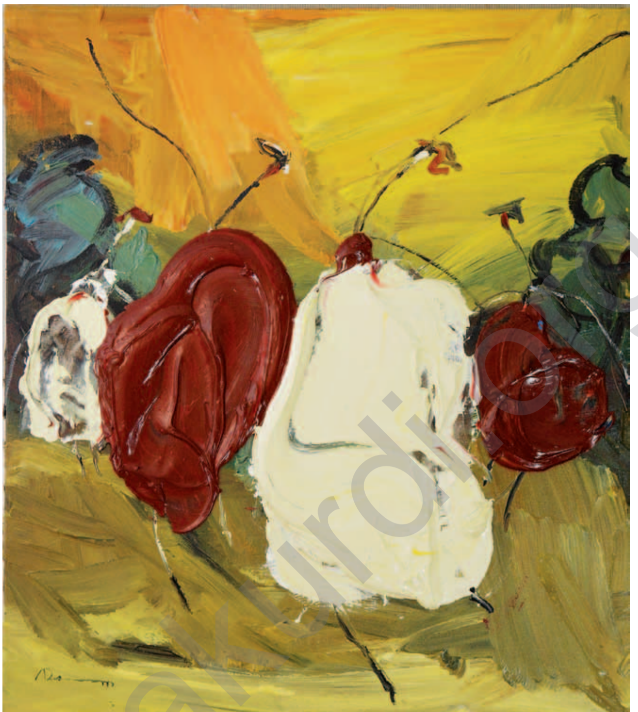
DARA ARAM: Baxçeyên tîrêjên rojê , boyaxa akrîlî li ser tûwalê, 32 x 36 cm

1 Divê hevtemamkirina aktorên herêmî, gîştî û ferdî, idarî û gelî, bi rastî be. Tevî ku sazîyên herêmî pir caran ji ber vegirtina sewiyeyên jorîn ên desthilatê zehmetîyan dikîşînin, ew bixwe di têkilîyên ligel aktorên li ser zemîn de vê nêzîkatîyê dubare dikin. Dema ku ew xizmetên civakî bi