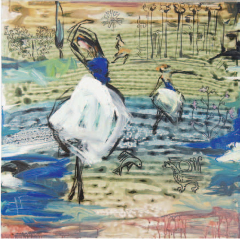
DARA ARAM: Ritmên Mezopotamyayê VII. , boyaxa akrilî li ser tûwalê, 36 x 36 cm

biha û maweyê veguhastina wan, ji bo reqabeteke xurttir, wê han bide."