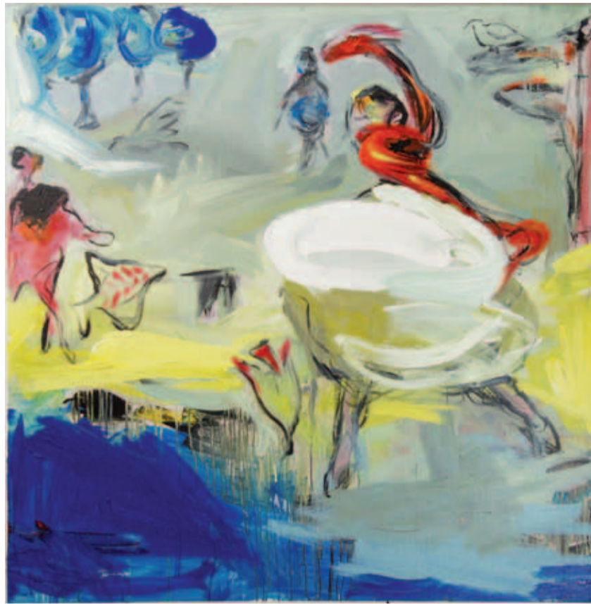
DARA ARAM: Dinya û masî 07 , boyaxa akrîl li ser tûwâlê 48 x 48 cm

1. Tirkîye helwesteke biryardar nişan nade û ji dêvla wê yekê stratejîyêke bendeman û carna dualî dimeşîne ku ji aliyekî bi serhildanê re, ji aliyê din jî, bi desthilatdarên serhikum ên mîna Qadafi û Esad re di pêwendiyê de dimîne, dibe ku xwediyê bingehêke pragmatîk be: Wisa dixuyê ku bawerîya AKPê bi guherîneke demokratîk a bikêrhatî ya li cîhana ereb tune. Lê Kemal Kirişçi (4) bi alikariya teoriya "tesîra demonstratîv" ya Samuel Huntington bawer dike ku ew di lêkolîna xwe de ya bi navê "The Third Wave: Democratization in the Late Twentieth Century (Pêla sêyema Demokratîzêbûnê di derengîya sedsala bîstana de)" (5) tîne ziman û bawer dike ku pêveyoya demokratîzêbûnê de ji modeleke real îlham bigire. Bi rastî jî, di dîroka herî nû ya demokratîzêbûnê