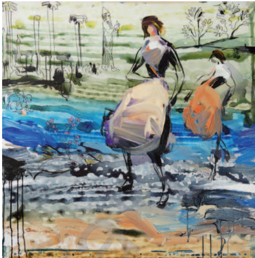
DARA ARAM: Ritmên Mezopotamyayê VIII. , boyaxa akril li ser tûwalê, 36 x 36 cm

Lê belê, ne teqez e ku dewlet dikare bigihe van armancên xwe. Heyama Sovyetê, berevanî di merkeza aborîyê de bû. Herçend gelek zehmet be mirov nirxandineke deqîq jê derîne jî, em