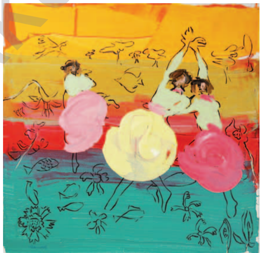
DARA ARAM: Qadên xeyalan, boyaxa akrîl li ser tûwalê, 36 x 36 cm

EDITO "HEGER LI VIR PÊK NEYÊ, LI TU DEVERAN PÊK NAYÊ"