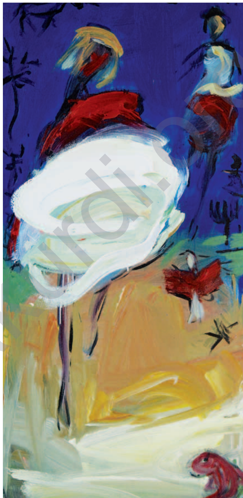
DARA ARAM: Giyana ewran , boyaxa akril li ser tûwalê, 24 x 42 cm