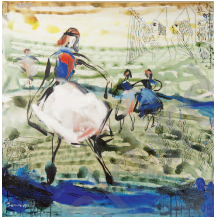
DARA ARAM: Jin û Çeng , boyaxa akril li ser tûwalê, 32 x 36 cm

Her çi "rasta nû", ew bêhtir bi hevdemîyê ve girêdayî xuya dîke. Serkeftinên wê yên hilbijartinê ji naveroka projeyên wê yên siyasî, bêhtir têkildarî kapasîteya wê ya ferzkirina pragmatîzmekê ne ku bi xetên serdest ên serdemê re hevpar e. Rasta ku berê xetêke hişk diparast (nirxên exlaqî û fedakarî), li aliyê kiryarî, carina bi rengekî diyar jî, cihê xwe girt. Bi alîkarîya medyayan, ew xwe weke " hişmendîyêke belav û dest lê nakeve, îdeolojîyêke ku diseyre, tevahîyêke helwêst û şeweyên rabûn û rûniştinê ya ku di hewayê de hene û minakên wê li kolanan, li televîzyonê an li medyayan tînin " dide der. Bi vî awayî, "rasta nû" jî hêzeke siyasî ya rasteqîn bêhtir têkildara çandî ye. Ew zêde kapitalîst e, pesnê serkevîtin û dewlemendîyê dide û li hember bizavên entelektuelî, pozbilind e. Bi xuyani, ew nêzikî berjewendîyên