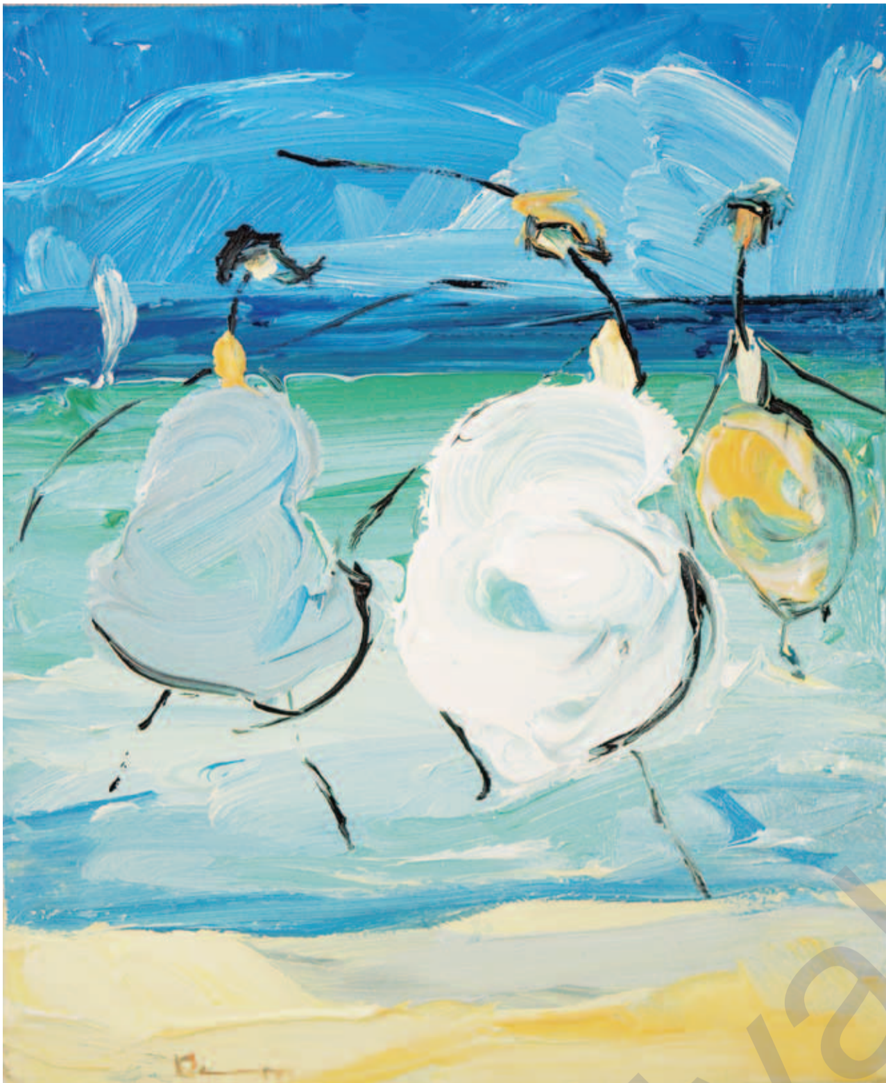
DARA ARAM: Şewqên şin II, boyaxa akril li ser tûwalê, 20 x 24 cm

kirin û damezrînerê wê were marjinal kirin, çawa ku hejmarek hissedarên hêzdar jî dixwazin? Tu tiştêkî din ji wê nemisogertir nîne.