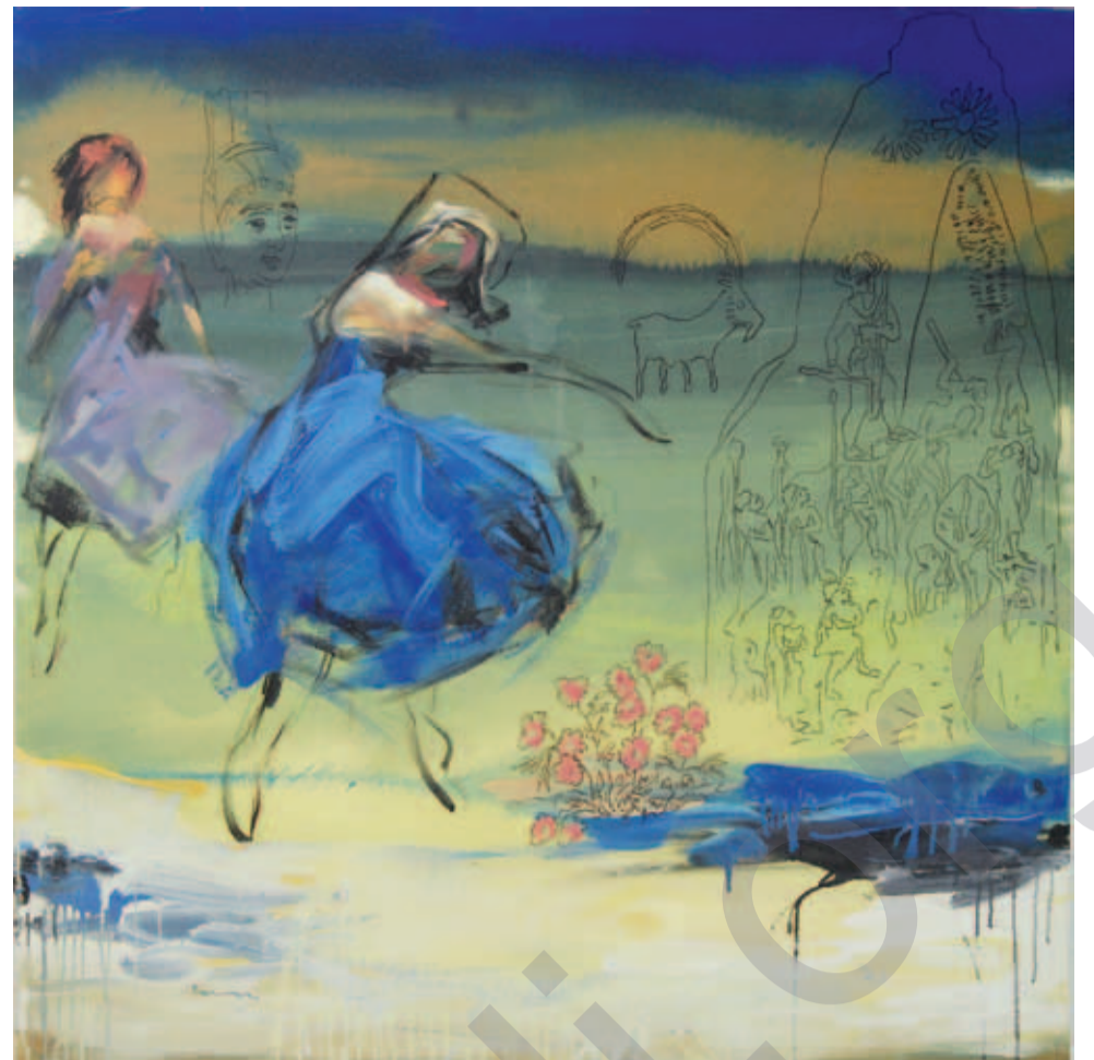
DARA ARAM: Naram-Sin , boyaxa akrîl li ser tûwalê, 44 x 44 cm

Hêmaneke sereke ya siyaseta întegral a kurd pêwîst e balkêşîya xwe bide aliyê navxweyî, subjektîvî, çandî ya civaka kurd. Eger tevgera kurd nakokîyên xwe bi tenê li ser hêzên derva (mînak: artêşa tirk û hikumeta tirk) hûrbînî bike û mînak çareserîya pirsra kurd bi hikumeta tirk ve girê bide, wê demê dê kê mînimê, ji ber ku ew dînamîka civaka kurd a hundurîn nagire ber çavan. Siyaseta întegral a kurd divê berîya hertiştî guh bide hemû kesên û grupên kurd. Siyaseteke bê hemû xwestinên gelê kurd ne siyaseteke e ji bo azadiya kurdan. Bi peyvên din, li kêleka pevçûna bi hikumetên Tirkîye, Îraq, Suriye û Îranê re, pêwîstiya tevgera kurd bi siyaseta û çandeke întegral heye. Ev tê wê maneyê ku civaka kurd divê bi çalakî bixwe bandorê li ser veguherîna xwe bike. Ku hêzên derva civaka kurd biguherînin, bê guman ev li gor xwe û ne li gor xwestinên kurdan wê civakê biguherînin. Eger komelgehên kurd ên cuda û şexis hesteke qebulkirin û piştgirîyê nebînin, ew vî siyaseta întegral napejirînin. Divê partiyên kurd amade bin ku mirovên kurd wek kesên azad û rizgar ên bi raman û nixêrîna cuda bipejirînin û wisa hemêz bikin. Wê demê damezirandina kongreyêke neteweyî ya ku li ser gelek tê gengeşî kirin jî, êdî nabe pîrsgirêke mezîn.