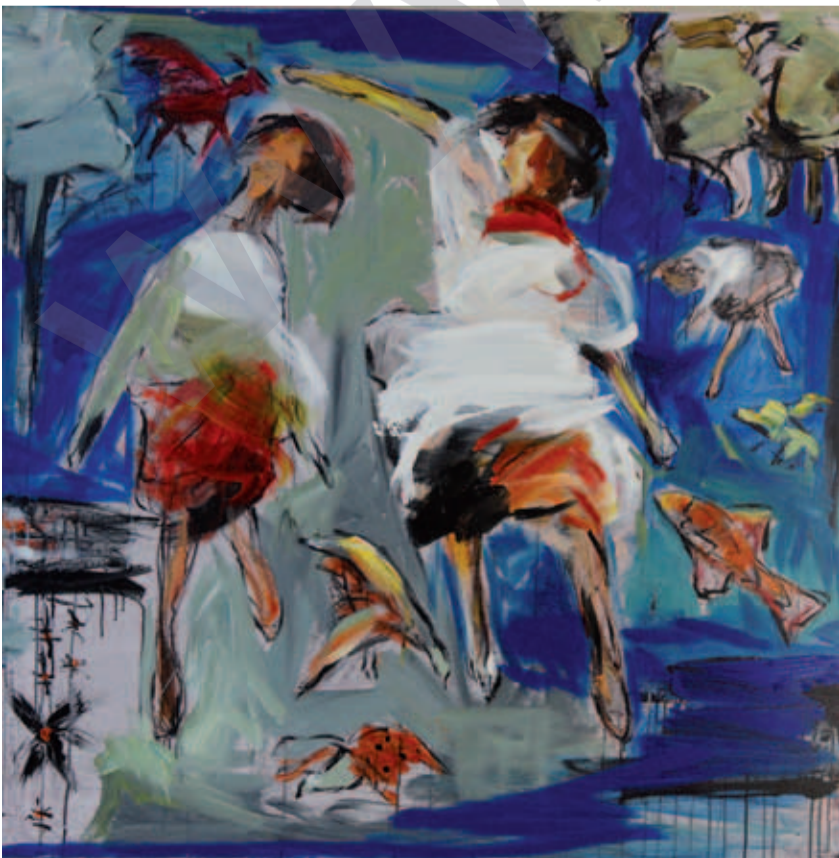
DARA ARAM: Diyarîya xwezayê 07, boyaxa akril li ser tûwalê 48 x 48 cm