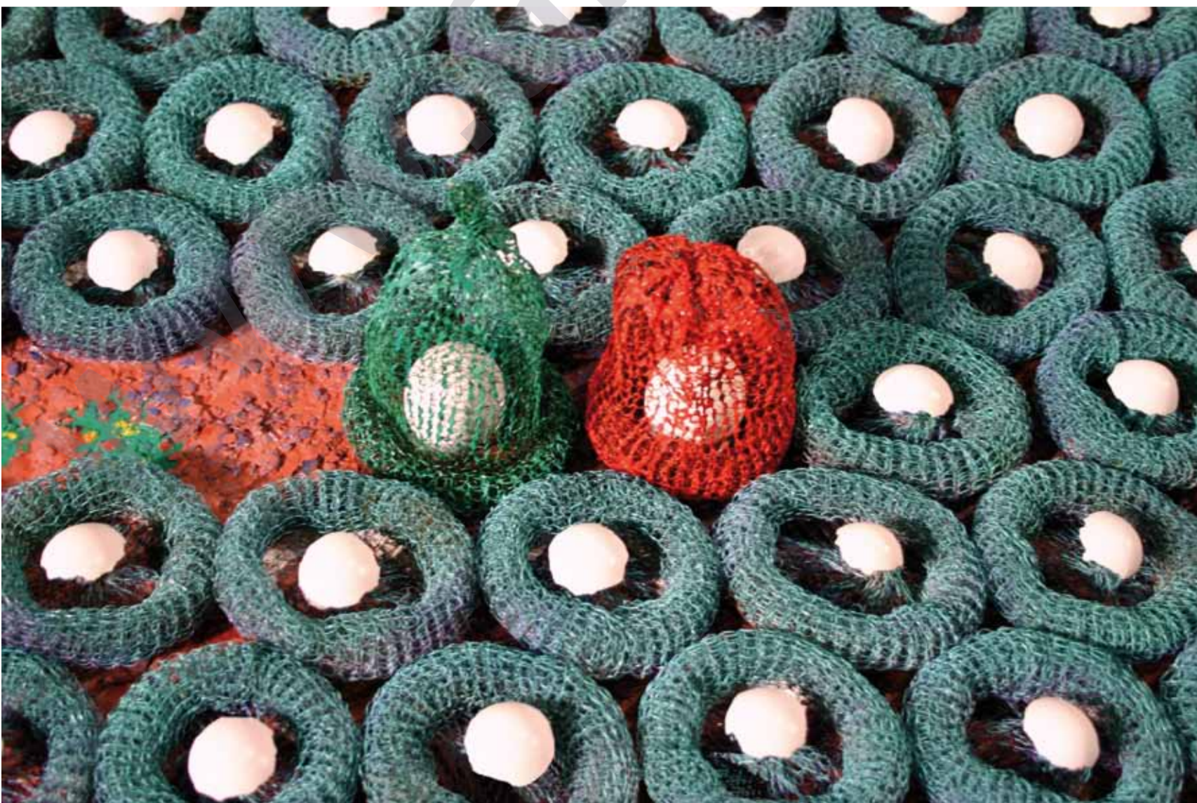
MÎRÊ HÊKAN: 6 û 6 lûfikên fedibûne, (1993) Teknîka şexsî ya li ser tabloyê, 120 x 60 x 19 cm

Ji tîrsa ku tevgera berdeyam a neteweyî ya kurd wê pêşî li van projeyên wan bigire, cuntayê di 25ê