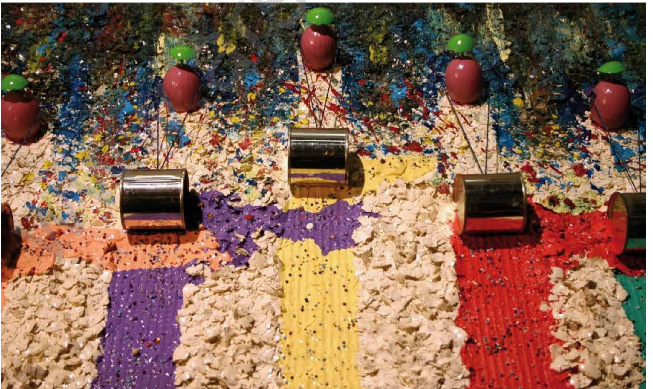
Mîrê HÊKAN: Koleyên sedsala 21ê, (2000) Teknîka şexsî ya li ser tabloyê, 125 x 60 x 12 cm