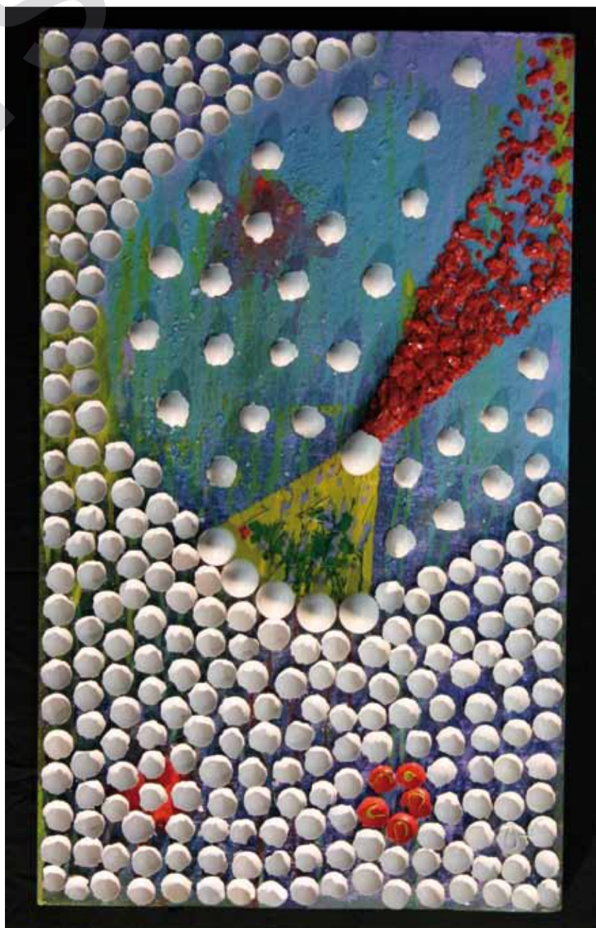
MÎRÊ HÊKAN: Dûmana sor, (1992) Teknika şexsî ya li ser tabloyê, 100 x 60 x 10 cm

Ji aliyê din de jî MHPyê li Erdoğan û AKPyê, ku wekî reqîbên xwe yê herî mezin dibîne, bi "bozkurtan" ("Gurên boz" li Tirkîyeyê ji mîltanên MHPyê re tê gotin) gef xwar, yan jî ew tirsand. Serokê MHPyê Bahçeli, di hilbijartinên 2007ê de werisê idamê, ku di bêrika wî de bû, li meydanan bi xwe re digeland. Dema ku wî ji neteweperestên tirk deng dixwest, sond dixwar ku dê Öcalan bi dar ve bike. Bahçeli di van hilbijartinan de wê ristê dilfize, ku hertim amade ye ku "bozkurtên" xwe bera meydanan bide. Di listeya wî ya pêşîn de Engin Alan heye û leşkerek e, ku di şerê li dij kurdan de wezîfên girîng stendine. Alan demekê fermandarîya Hêzên Taybet kiribû û herweha serokê wê komê bû, ku Öcalan girtî û anî Tirkîyeyê. Kesê ku li Îmraliyê îfadeya Öcalan girtibû jî ji wî pêvetir kes nebû. General Engin Alan jî wekî gelek leşkerên din ên bersûcên JITEM-ERGENEKONÊ, ku di şerê li dij kurdan de por weşandine, dibêje ew "fermandarêkî welatparêz ê neteweperest e, ku hatiye têk birin" û ew wê yekê wekî îxaneta li dij neteweyê dibîne, ku dema ku cudaxwaz di meclîsê bûn, ew jî digel hevalên xwe li ber dadgehan dihatin darazandin, ku li Silivriyê hatibûn damezirandin. Heger were hilbijartin ew dê bikeve meclîsê û dê tekoşîna xwe, ku li ser çîyan nîvco hiştibû, di çarçoveya fikir û ramanên xwe de li vê derê berdewam bike. Ji ber vê yekê di warê pirsgrêka kurd de ji bilî xurîna neteweperestîyê tu kes li benda polîtîkayêke din a MHPyê nîne.