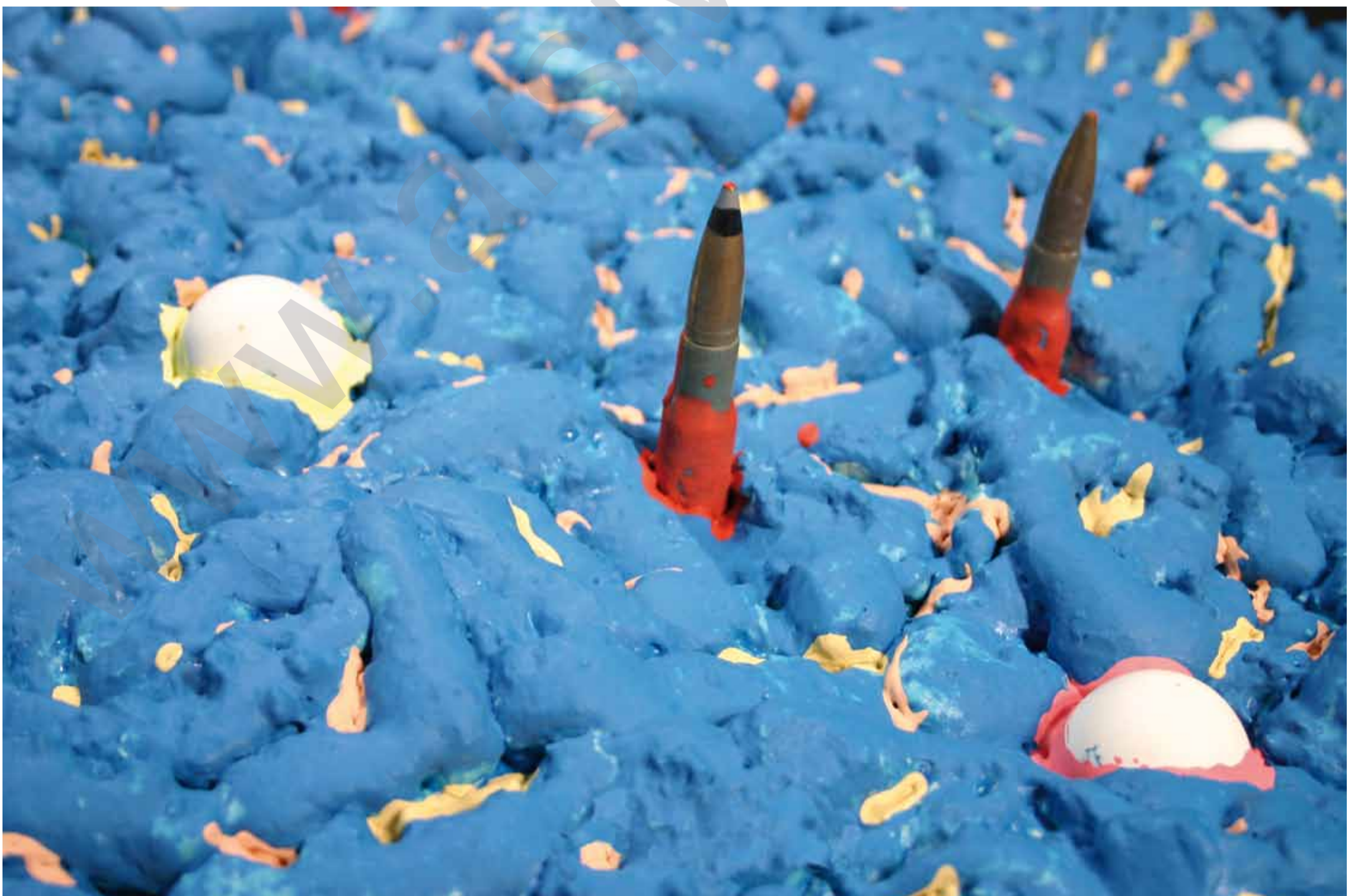
MÎRÊ HÊKAN: Deşt qedexê, (2000) Teknîka şexsî ya li ser tabloyê, 125 x 60 x 19 cm

Di nav 12 salan de, ev cudabûna ku em îro dijîn, yan dê biqede û komarê wekî komareke demokratîk bikeve sed salîya xwe, yan jî ev komarê dê bêyî kurdan rîya xwe berdeham bike. Di vê merheleyê de helbet girîng e ku BDP û PKK daku pêbaweriyê pêk bînin, hin gavan biavêjin, lê belê li aliyê din ew yek wezîfeya partiyên siyasî ye, ku li seranserî welêt xwedî hêz in; ji bo avakirina pêvajoyeke weha hewlê bidin, ku tê de civaka tirk bikaribe mafên kurdan nîqaş bike û rêzê li van mafan bigire.