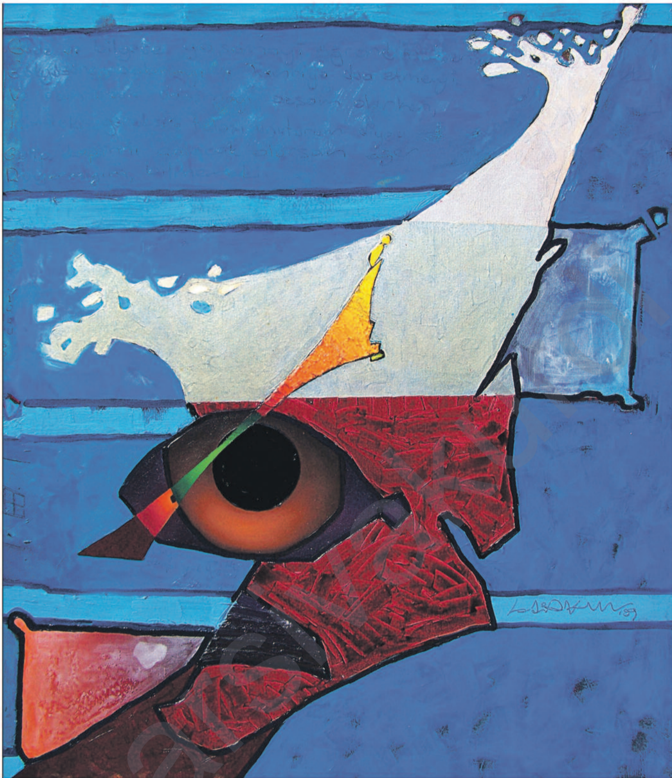
Kadir Akyol, "Metamorfoz I", 150 x 130 cm, 2009

M. Alain Minc şewirmendê berê yê M. Sarkozy dibêje "di civakên nûjen de, berjewendî û butça dewletê ne tenê di sazîyên dewletê de herwiha di şîrketên taybetî de jî dikare were bi karanîn (9).