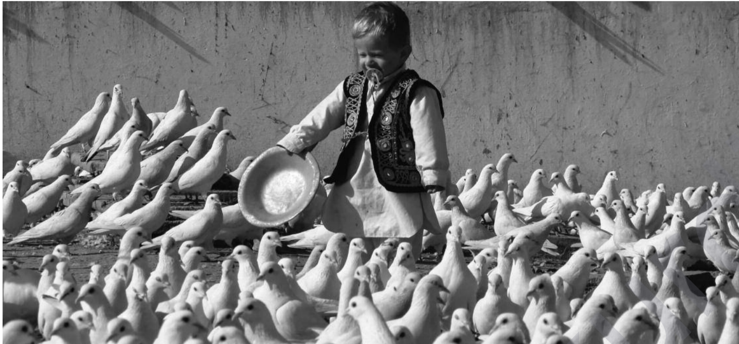
Zorekêkî afganî û kevokên aştîyê! - www.ihh.org

D ema ku Amerîka û hevalbendên wî yên Hevgirtina Atlantîk'ê (NATO), li Afxanistan'ê, rastî zehmetiyên, ku di sala 1979'an de Artêşa Sor rast hatibû, dibin, wê demê stratejên rojavayî hewl didin ku paşerojê niqaş bikin, daku ji pirsgirêkên îroyîn re çareseriyên bibînin.