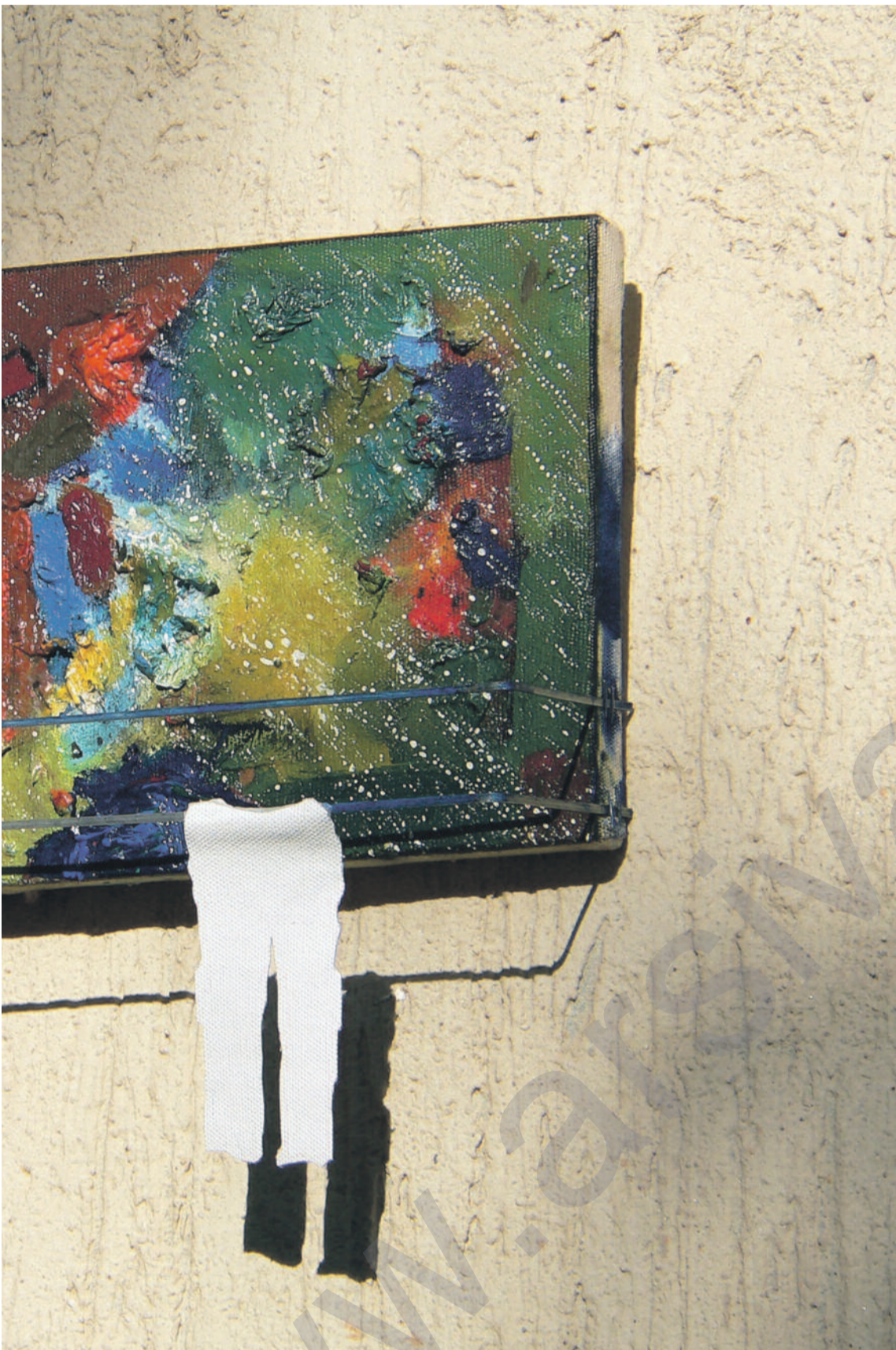
, 40 x 90 cm

bûnên ji dewleta tirk ên cihê û gelek çaran jî berevajiyê hev bûn, bihewîne û rexnekirina dewletê jî herêmi bike. Ya sisiyan şiddetê dikarî pêşniyarên ji bo beşdarbûn û hewldanên azadiyê biafirîne û qadên mirov dikare têde tevbigere veke ku şewazên siyaseta parlamenteriyê nikarin pêk binin.