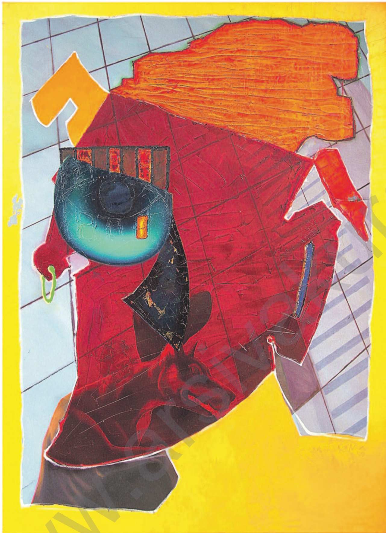
Kadir Akyol, "Metamorfoz III", 160 x 120 cm, 2009

xizmeta însiyatifên taybet. Di he- sab de ev yek her çend wekî lê- çûn were nîşan dan jî di rastiyê de wekî alîkarî digihîje hin pro- jeyan. Di vê krîza dawî de piştî daxwazên mezin ên welatên he- rêmê, konseya rêveberiya BAD'ê biryar girt ku di 2008'an de, kara xwe bixe xizmeta çalakîyên FAD'ê: ew jî alîkarî dide welatên xizan ên xwediyê deynên giran (PPTE) (16).