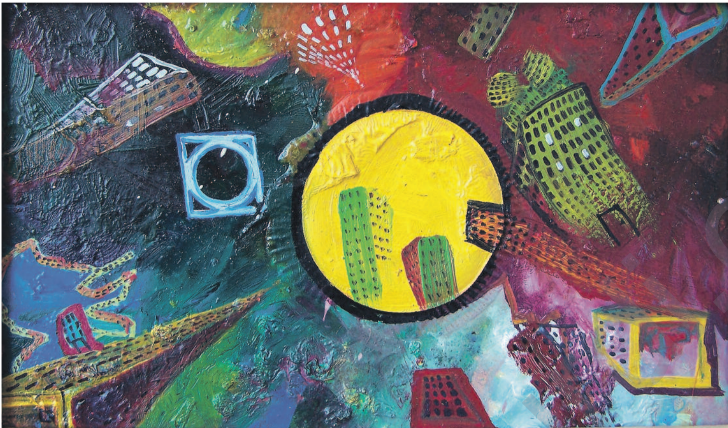
Kadir Akyol, "Kent Bozumu"

mirov nikaribe xwe bigîhîne. Ji % 43 amerikiyan nekaribûn 5 hezar dolar berhev bikin ji bo derbasî zanîngehê bibin.