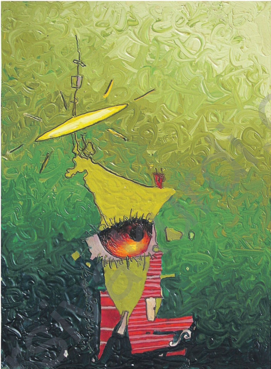
Kadir Akyol, "Kadir Kent I", 18 x 12 cm, 2009