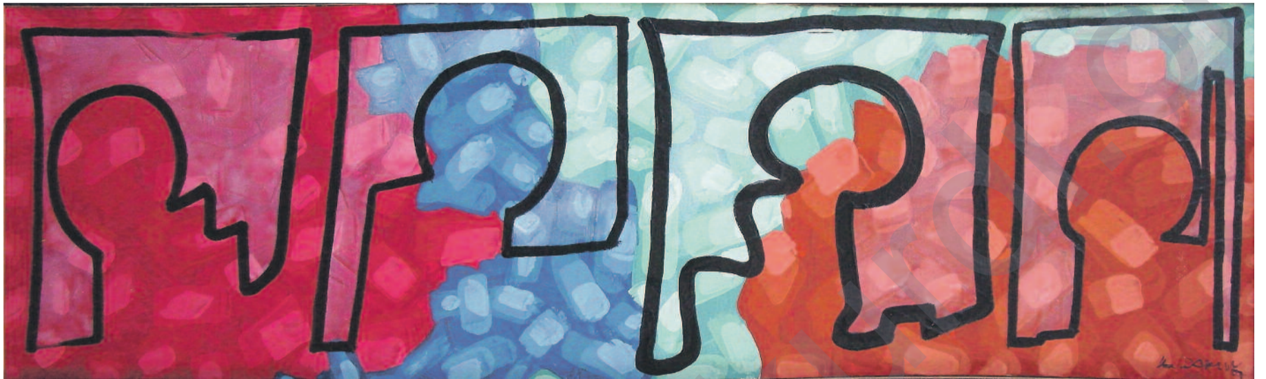
Kadir Akyol, 40 x 160 cm

Hejmara taybetî ya le Monde diplomatique, 196 rûpel, 12 euros. Li firoşgehan.