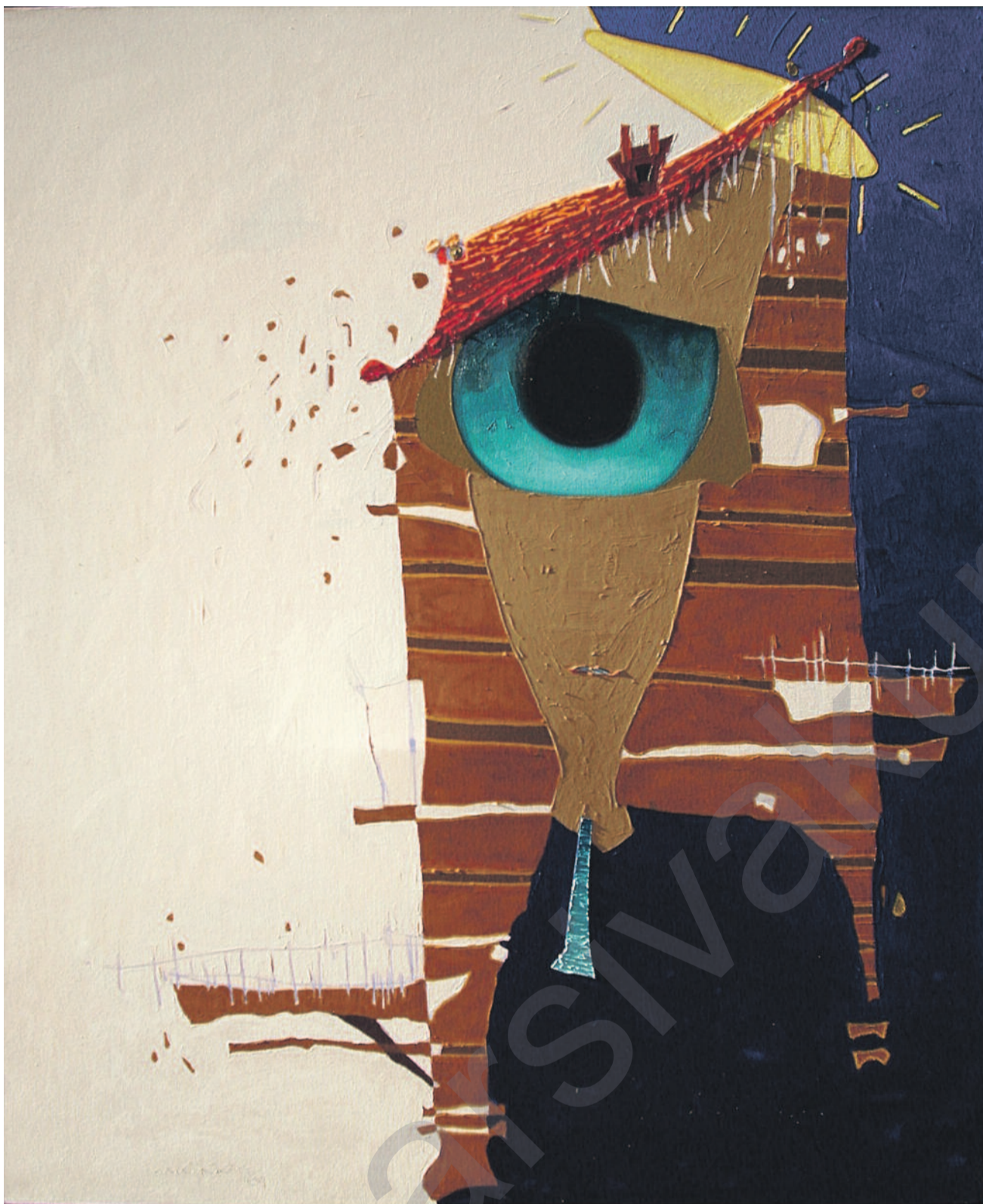
Kadir Akyol, "Metamorfoz Kent", 150x130 cm, 2009

tan diyar bike. Di derketina holê ya salên 2000'î ya selefîstan de, Birayên Mislîman ên "modernîzator" ew redkirin, bi rengê ku di dema xwe de elîtên "rojavayîbûyî" yên li dijî wan şer dikirin, ew red kiribûn. Di nava qada gelemperiyê de Birayên Musulman doza mafê zêdetir ketine nav kar û barên civakî û siyasî dikin, selefîst berovajî bersivê didin binketina îdîa dikin a şagirtên Hesên el-Bannah e û lidervehiştina daimî ya ku ew bi xwe mexdûrê wê ne. Bersiva wan gengeşê û pratîkên li dijî lidervehiştinê ye. Zelûliya selefîst, xwe ji guhertinê bêhtir di dewamîbûnê de dide der.