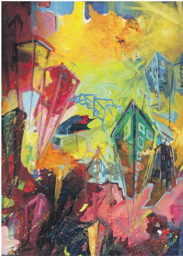
Kadir Akyol, 100 x 120 cm

Li vir, dilşikestî û dilmayînen dîrokî hîna jî ihtîmaleke ji nû ve lihevkiyê dîplomatîk asteng dikin. Piştî xebateke dualî ku sê salan ajot, di Adara 2010'an de raporeke 2200 rûpelî hat çapkirin. komîsyona dîroknasên Ko-