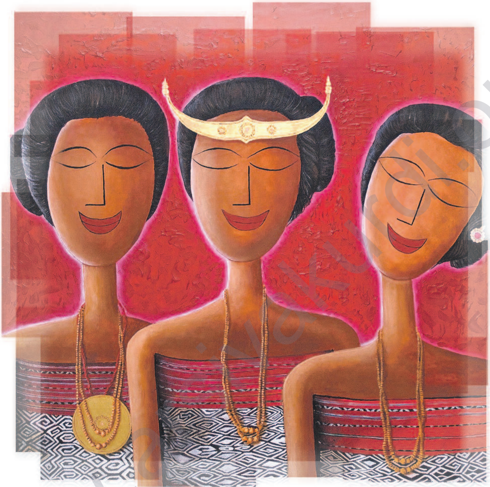
Three Smiling Women, (Kunstschule Arte Moris aus Ost Timur) - Efekt LMD kurdi

ku berê qet nehatiye dîtin. Mij-dara buhurî, FAO'yê, di çarçoveya civîna cîhanî de li ser hêminiya xurekî ya li Roma'yê, diyar kir ku ew digel Konferansa Neteweyên Yekgirtî li ser Bazirganî û Geşepêdanê (KNYBG), FIDA û Banka Cîhanî dixebite ji bo dariştina "qanûna reftara durist" ji bo veberhênên biyanî. Sazkarî û qaîdeyên navneteweyî dikarin, herwiha, rêyê li ber projeyên veberhênên çandiniyê yê "xwedan-mesûliyet" xweş bikin.