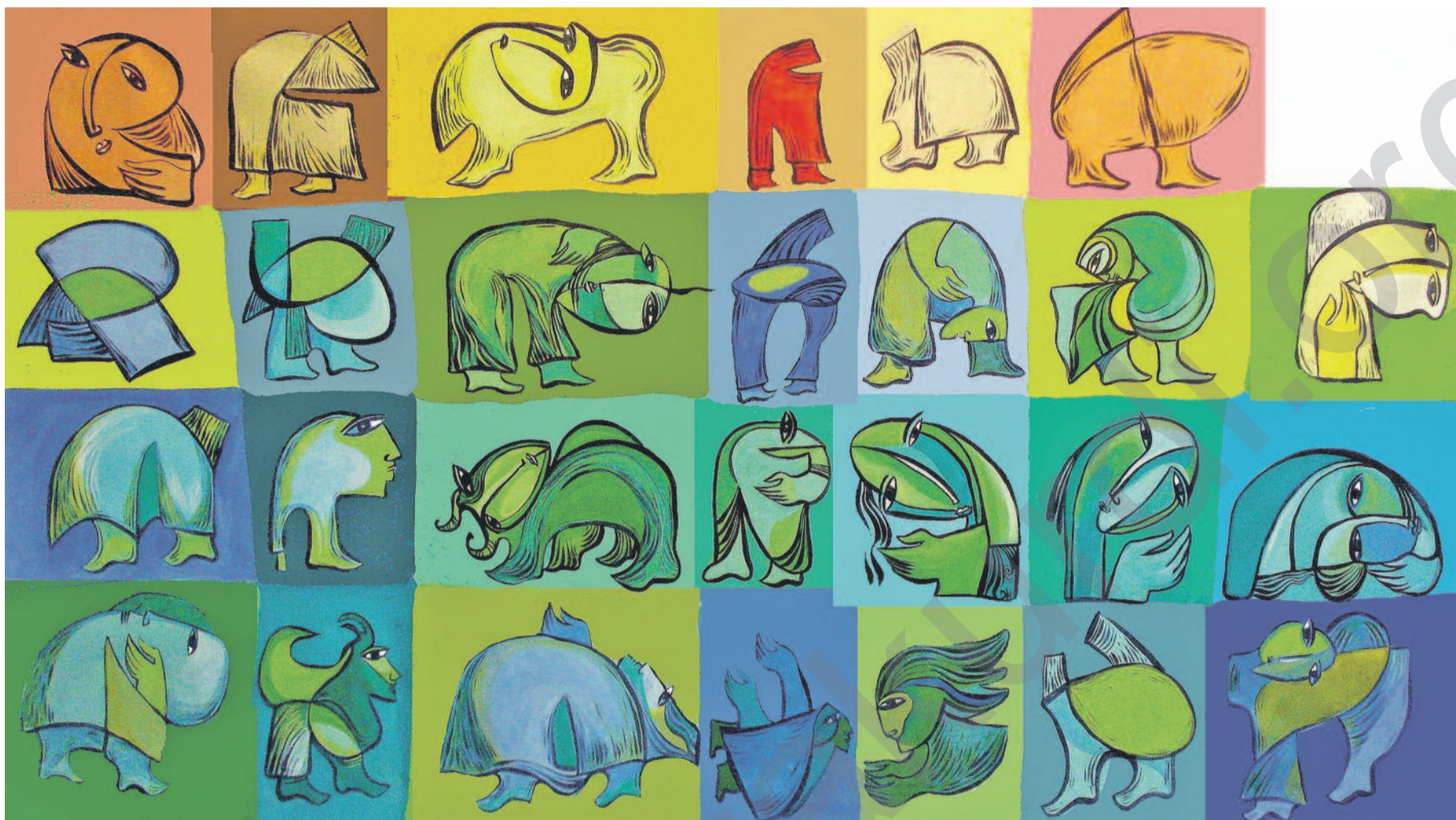
Rebwar Saeed, (Acrylic)

PESC were derxistin, tevî ku di prensîbê de Nûnerê Bilind divê serokatiya Konseya Wezîrên Karê Derve bike. Çileyê bê Spanya'ya ku wê rêveberiyê bigre destê xwe, xuya ye hem-fikr e. Hingî, eger karên derve yên Yekîti'yê beriya Peymana Lîzbon'ê ji aliyê sê seriyên ve dihatin rêvebirin, piştî peymanê mumkin e ev bibin çar serî.