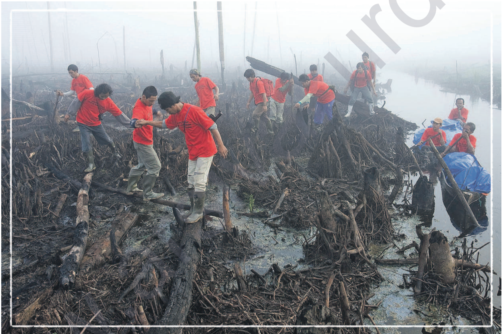
Endonezya xwe dikuje, (Greenpeace) - Efekt LMD kurdî

N êçîrvan û berhevkar bi şiklê nîv-xelekekê kom bûne li meydana bêdar a rêlê ku pêşwazî li zeraqên berbangê dike. Mêrên bişûtik çav li wan biyaniyan kutane. Li pişt wan, jin memik didine bebikan û zarokên ku ji wan mêvanên nepayî tirsîyayî aşt dikin. Menti, pîremerêkî peyt û rebît ê li dor şêst salî, rûspî û serekê vê koma pênc