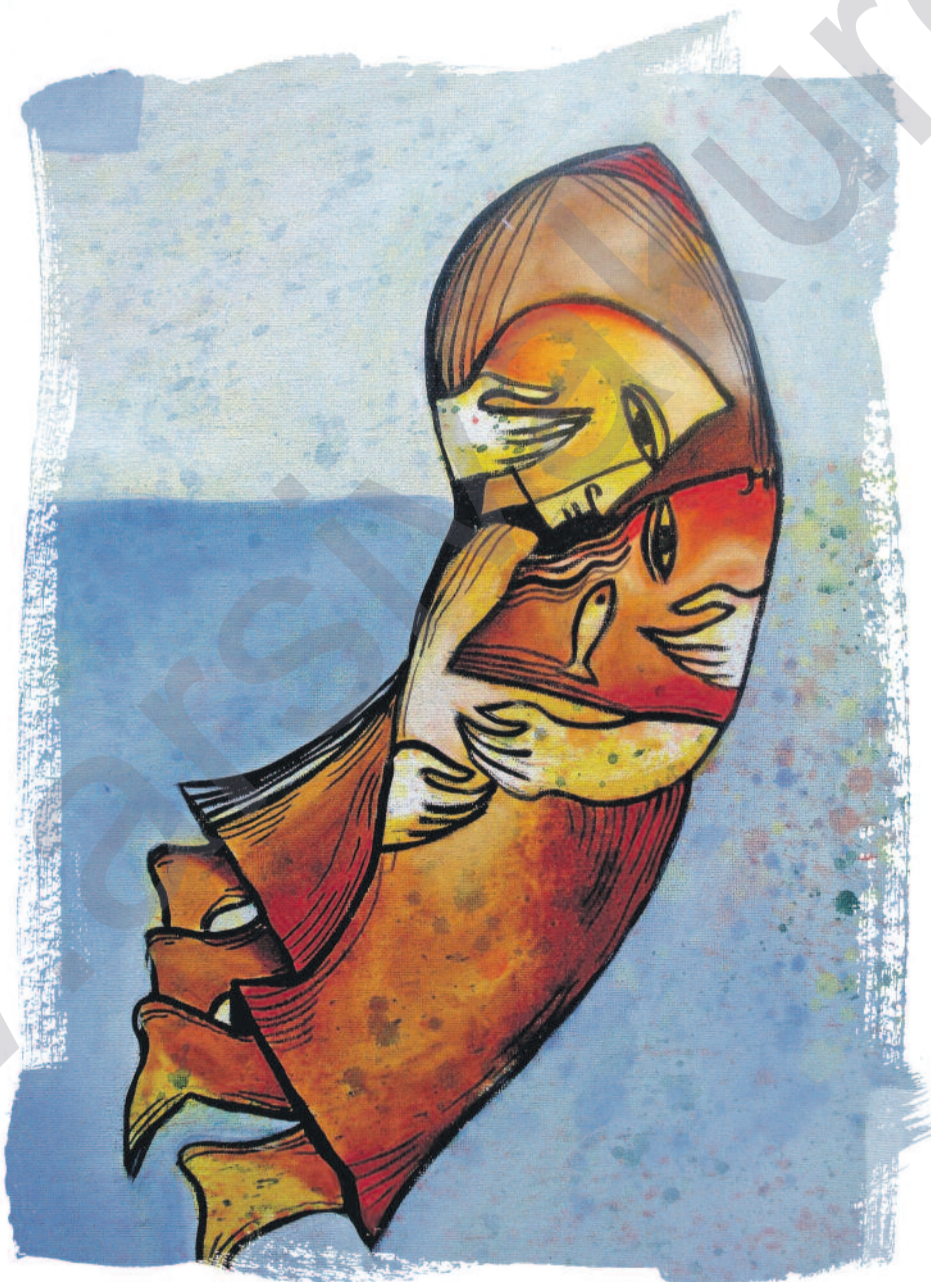
Rebwar Saeed, (Acrylic on canvas) - Efekt LMD kurdî

Girêdan û pêwendîgirtina bi erzanî dibe sebebê jinûve navdîkirina qismî ya enformatîk û bernamêyên kompûterî. Modêla kompûtera şexsî ya bi hemû amrazên xwe ve tekmîl û serbixwe, ku bêyî girêdana bi