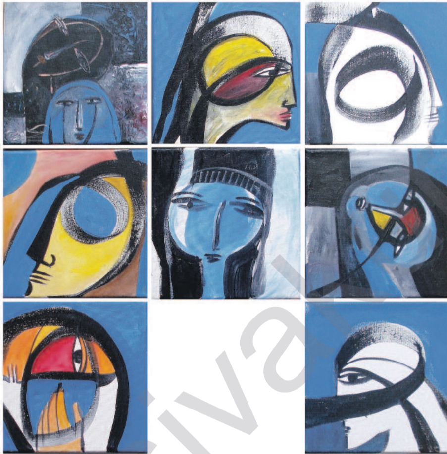
Rebwar Saeed, (Acrylic on wood)