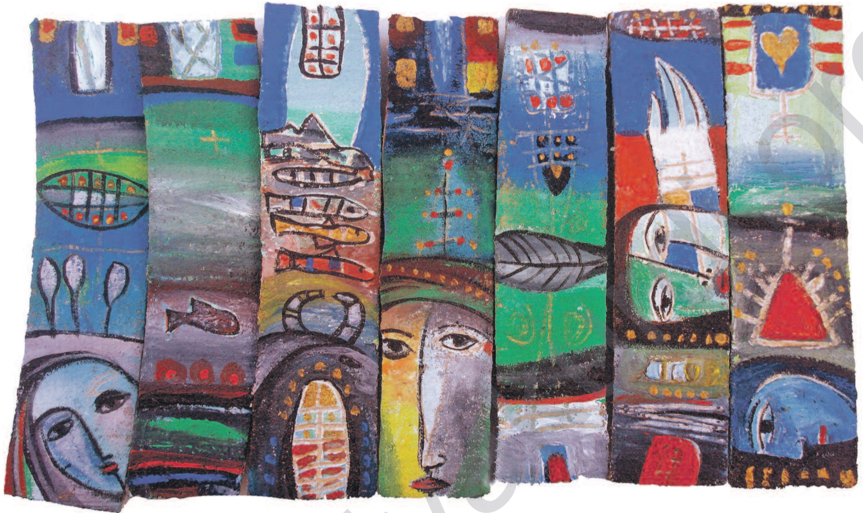
Rebwar Saeed, (Acrylic on wood)

belê ev nayê wateya ku Ewrûpa wê bikeve bin bandora Amerîka'yê û ji daxwazên wê re serî deyne. Ji ber ku Ewrûpa xwe mîna dayîka Amerîka'yê dibîne ew naxweze ti car bikeve bin bandora yekser a serdestiya vê hêzê. Digel ku hêzên rastgir li Ewrûpa'yê xurt bûne û di pir welatan de bûnin desthilatdar, wisa dixûyê ku di wênayê herî dawî yê siyaseta Ewrûpa'yê de xala ku herî zêde derdikeve pêş ev e: Ewrûpa wê bi rêbazên xwe ên nû nêzîkê Amerîka'yê bibe. Heman nêzîkatî zêdetir di siyaseta wê ya derve de jî tê dîtin. Bêguman bi vê rastiyê ve girêdayî bandora çanda Amerîka'yê jî li heman herêmê belavtir dibe. Herçend rayedarên ewrûpî di zanistiya vê fenomenê de bin, ez bawernakim ku civaka ewrûpî xwediyê heman zanistiyê be.