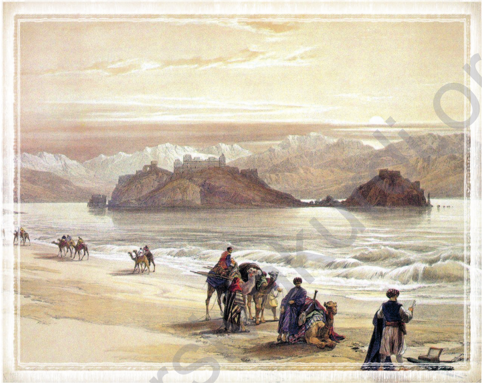
The Island Of Graia, (David Roberts) - Efekt LMD kurdi

şirkatiyên xwe û firotina ber bi derve ve ya navneteweyî dewam bikin û gelek pirsgirêkên hevpar wê çaresernekirî bimînin. Kelevajîtiya vê rewşê bi qasî çanda hevpar midbexa Mexreb'ê û welatên Derya Spî mezin e û ev xwarinên vê midbexê li dinyayê bêhtir tê ecibandin. Reh û kokên vê çanda hevpar digihêjin dirokê, di warê zêdekirina nixên nû de bi tenê bi sazkirina şirketên mekanê wan mexreb û hevkarîya bi şirketên pîrneteweyî yên li herêmê jixwe çalak in mumkin e bîne ziman. Qadên pêkhatina vê yekê jî razandina pereyan, hilberandin û îstîhdam e.