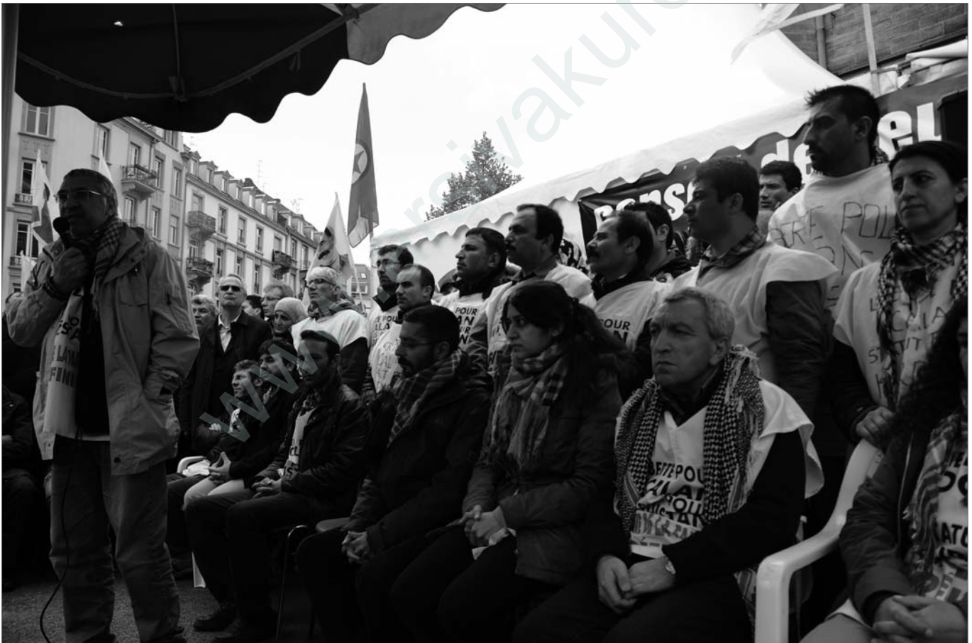
Der Hungerstreik in Straßburg fand große Solidarität in Europa. Jeden Tag gab es verschiedenste Initiativen, um die legitimen Forderungen der KurdInnen in die Öffentlichkeit zu tragen. Erstes Ziel der Initiativen war und bleibt, die nun schon monatelange vollkommene Isolation von Abdullah Öcalan zu durchbrechen.

Es klappt aber nicht. Das Volk hat ihn mit drei Millionen Unterschriften zu seinem Willensträger erklärt, Tausende