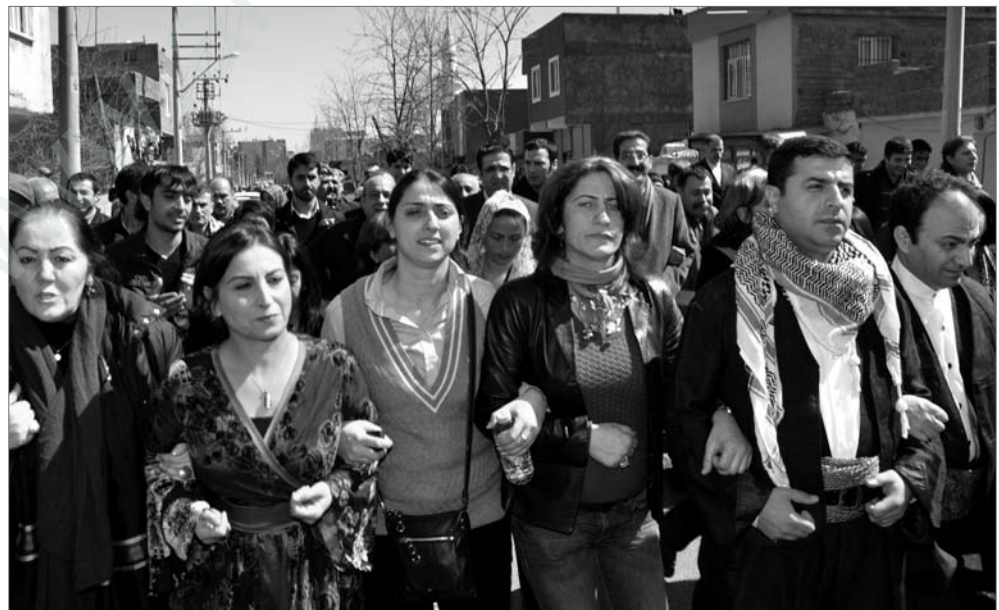
Newroz 2012 in Amed: Trotz Verbot des Newrozfestes machten sich Hunderttausende auf den Weg, unter ihnen auch die gewählten PolitikerInnen und BürgermeisterInnen.

Ein weiterer Grund dafür, warum gerade heute eine nationale Konferenz möglich ist, ist die klare kurdische Politik in der Frage des Zusammenlebens mit den Nachbarvölkern und selbstverständlich ihre Haltung zur territorialen Integrität der Staatsgrenzen der Türkei, Syriens, Iraks und Irans. Einheitliche kurdische Politik auf nationaler Ebene resultiert nicht aus dem Gedankengut eines kurdischen Nationalstaates, das Grenzverschiebungen impliziert. Wie auch am Beispiel Irakisch-Kurdistan oder der Forderungen der KCK nach Demokratischer Autonomie ablesbar, die kurdische Politik sieht mehr weitge-