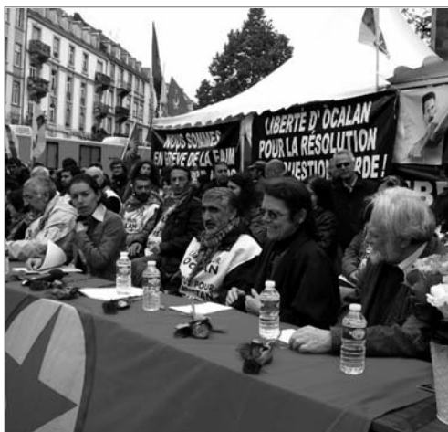
Straßburg: Mit einer Pressekonferenz haben die Hungerstreikenden ihre Aktion am 52. Tag erfolgreich beendet.