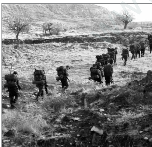
Die Operationen des türkischen Militärs nehmen mit der Schneeschmelze kontinuierlich zu.

Liebe Leserinnen und Leser, gerade erreicht uns die Meldung, dass die 15 HungerstreikaktivistInnen in Straßburg am 52. Tag den Streik beendet haben. Am 1. März haben sie die Initiative in die Hand genommen, und wie sie selbst sagen, mit dem vordersten Ziel, „das Gefängnissystem Imrali und die verschärfte Isolationspolitik [die gegen Abdullah Öcalan angewandt wird] für die Öffentlichkeit aufzudecken und die entsprechenden Institutionen diesbezüglich dazu zu bewegen, ihren Aufgaben nachzukommen“. Sie beenden diese Hungerstreikphase mit erhobenem Kopf, denn sie sehen, „dass gegenüber den legitimen Forderungen des kurdischen Volkes bei den entsprechenden Institutionen ein Bewusstsein geschaffen worden ist. Zudem sehen wir auch, dass ein großer Freundschaftskreis der Solidarität mit dem kurdischen Volk und seiner Freiheitsbewegung entstanden ist“. Dies ist eine positive, richtige Bewertung dieser Aktionszeit.