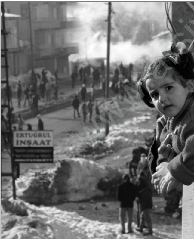
Alltag in Nordkurdisten/Türkei: Tränengasgeschwängerte Luft, Auseinandersetzungen mit den türkischen Spezialeinheiten.

8) „Genel Bilgi Toplama“, personenbezogene „Sammlung allgemeiner Informationen“.