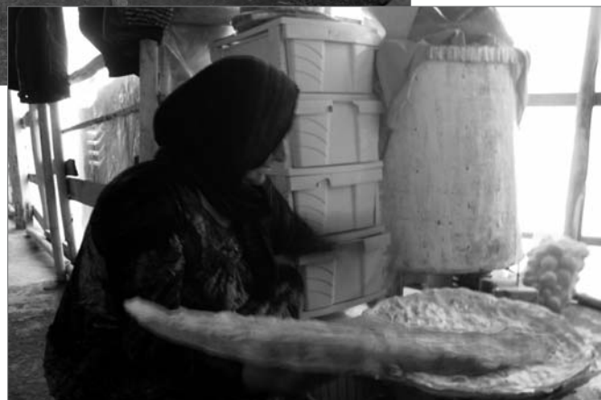
Frauen in Südkurdistan