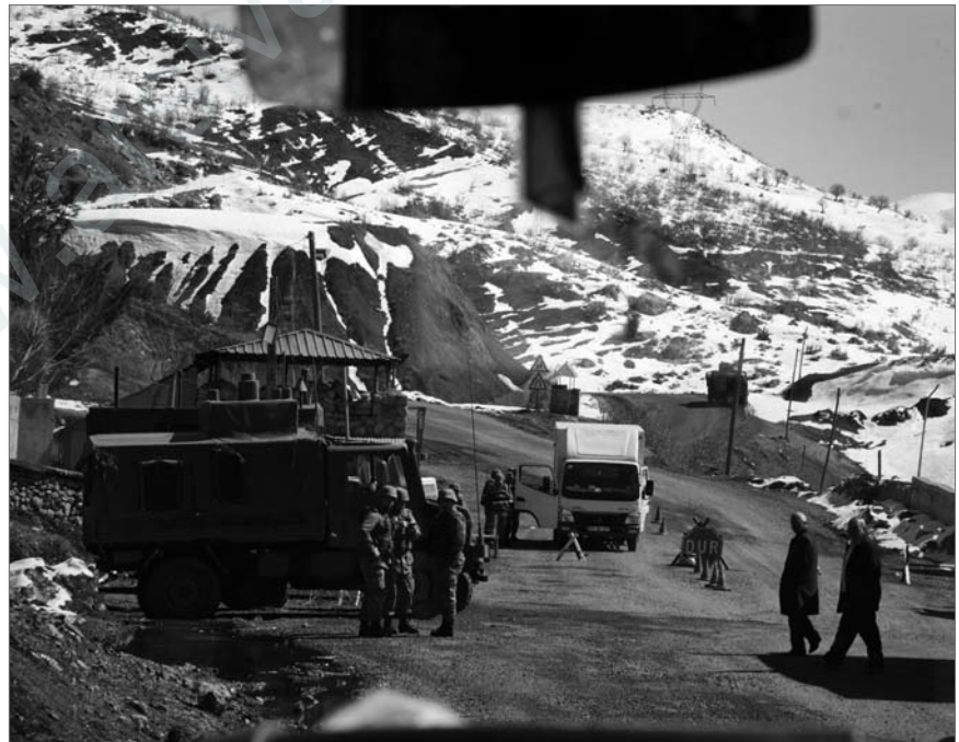
Das türkische Militär ist in Nordkurdistan/Türkei weiterhin überall präsent.

Und so kamen sie von „Verhandlungen mit der PKK“ ab und schlugen eine Linie ein, die sich zeigt in blutigen Angriff-