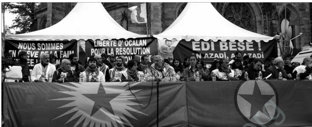
Straßburg: Pressekonferenz am 52. Tag des Hungerstreiks, auf der die 15 AktivistInnen die Beendigung des Streiks erklären.