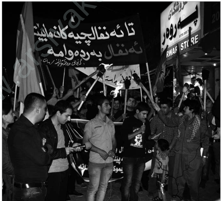
Demonstration in Südkurdistan/Nordirak gegen die Isolation Abdullah Öcalans.

Dieses Treffen wurde kritisiert, weil nicht alle Parteien und Kreise eingeladen worden waren. Das hat man jedoch eingesehen und später mit einem zweiten Treffen und der Unterzeichnung eines Protokolls über das gemeinsame Vorgehen wieder korrigiert. Wir als Partei halten diesen Schritt für sehr wichtig. Entscheidend ist, dass die kurdischen Parteien den Provokationen der Türkei keine Chance gegeben haben. Das syrische Volk sollte ohne Intervention von außen und ohne Gewalt selbst aus eigener Kraft einen Umsturz des Regimes vollziehen. ♦