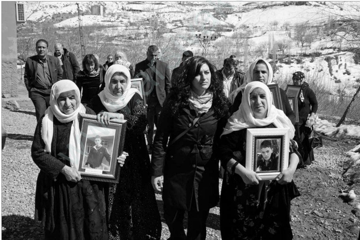
Eine Hamburger Newrozdelegation besuchte die Angehörigen des Massakers von Roboski. Am 28. Dezember 2011 wurde eine Gruppe Grenzhändler im Grenzgebiet zum Irak vom türkischen Militär angegriffen. Sie töteten 34 unbewaffnete Zivilisten.

Das zweite Ziel der Türkei ist, auf internationaler Ebene den Eindruck entstehen zu lassen, die PKK stehe auf der Seite von Syrien und Iran. Durch diese Behauptung will sie von den USA größere Unterstützung gegen unsere Bewegung erreichen.