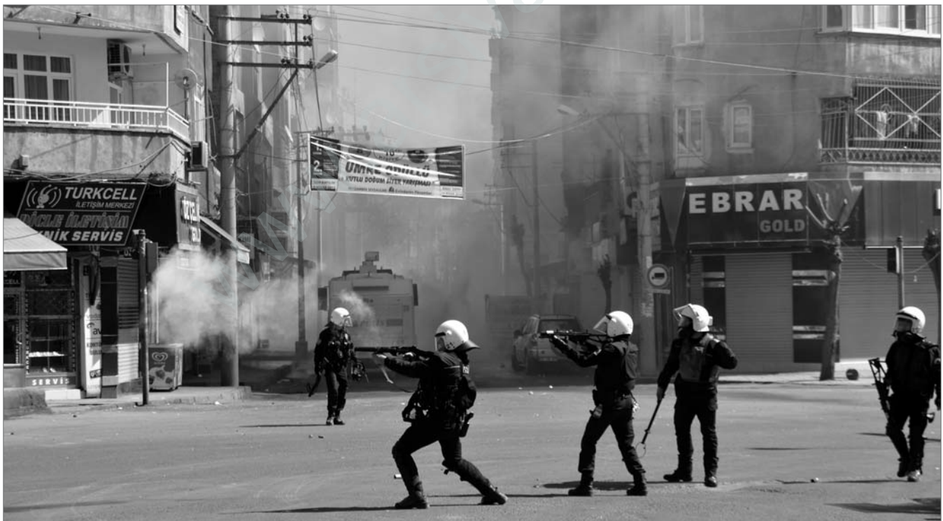
Gegen die Etablierung der Demokratischen Autonomie und dem Bestreben nach nationaler Einheit hält die Besetzung durch das türkische Militär und Spezialeinheiten der Polizei in Nordkurdistan weiter an.

Die KCK betont abschließend, dass diese Vorschläge, die allen politischen Parteien, Organisationen, Persönlichkeiten und der kurdischen Bevölkerung präsentiert wurden, nicht als unveränderbar zu betrachten seien. Es stehe außer Zweifel, dass sie ihre letzte Fassung im Rahmen von Diskussionen erhielten, wenn sie auf der Plattform des „Demokratischen National-Kongresses“ in Beschlüsse einfließen. ♦