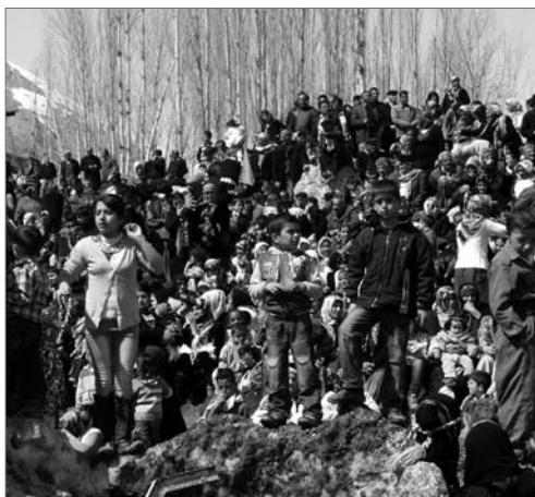
Das Newrozfest musste in diesem Jahr von Jung und Alt gegen die türkischen Sicherheitskräfte durchgesetzt werden.