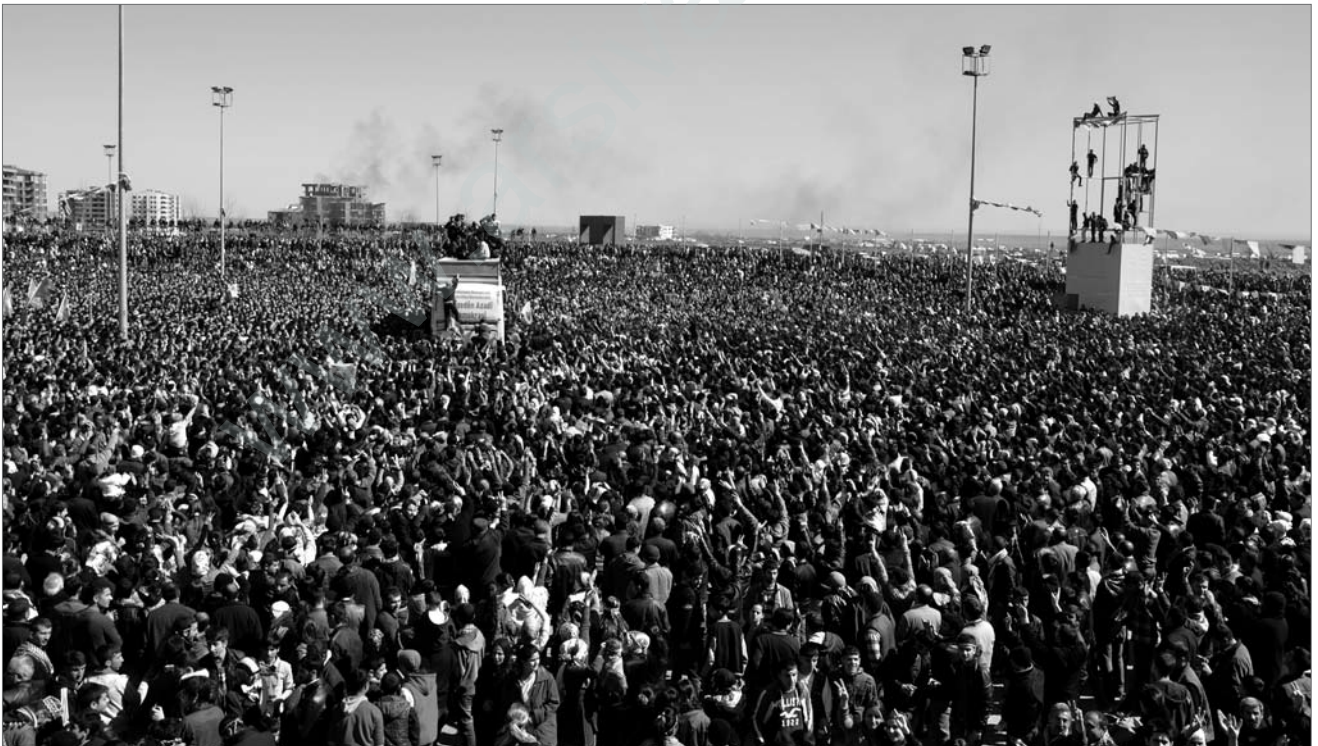
Die Bevölkerung in Kurdistan ist für die Durchsetzung demokratischer Rechte in einem permanenten Aufstand: Hunderttausende auf dem Newrozfest in Amed, das die AKP-Regierung ihnen verbieten wollte.

Die kurdische politische Bewegung in Syrien sieht und bewertet die Entwicklungen in Syrien auf die oben beschriebene Weise. Adil Bayram von der Özgür Gündem macht in