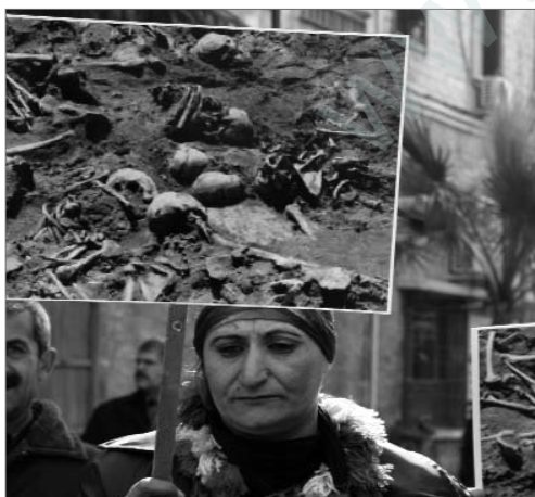
Die Bevölkerung fordert Aufklärung über den Verbleib ihrer Angehörigen und über die im Land verteilten Massengräber.