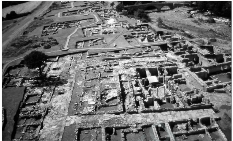
Die Ausgrabungsstätte Allianoi

Am 19. März 2011 wurden zum fünften Mal in Folge aus Protest gegen den Ilisu-Staudamm in einer Massenaktion Bäume in Hêskîf (Hasankeyf) gepflanzt. Die 400 TeilnehmerInnen aus Hêskîf (Hasankeyf) und aus Êlih (Batman) sowie die Newroz-Delegationen betonten mit ihrer Pflanzung von über 100 Bäumen, dass die gesellschaftliche Entwicklung durch abgestimmte Investitionen vor Ort und nicht durch Vertreibung der Menschen langfristig zu erreichen sei. Diese