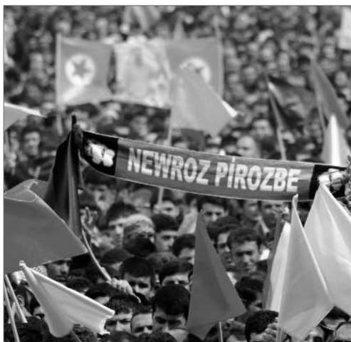
An Newroz beteiligten sich in diesem Jahr weit mehr Menschen als all die Jahre vorher. Dringendste Forderung: Entweder Freiheit oder Freiheit.