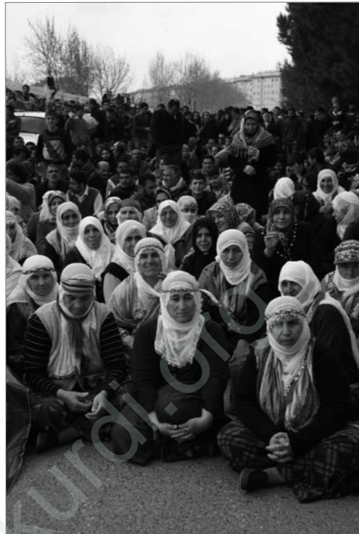
Sitzstreik gegen Polizeiangriffe

Doch es gibt noch weitere Probleme: Durch die Flucht aus den Dörfern ist eine große, stark verarmte Schicht von Kurden entstanden, die Arbeitslosigkeit in dieser überfüllten Stadt ist auf über 32 % gestiegen. Viele der Familien sind zerrissen worden oder Kinder haben gar keine Eltern mehr. Die älteren Geschwister sitzen in den Gefängnissen und die Jüngsten fangen an, sich in Gewalt oder Drogen zu flüchten. Insbesondere der Drogenhandel, welcher von einigen türkischen Militärs