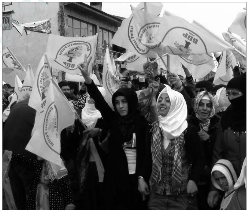
Die BDP ist überall vertreten wie hier auf der 8.-März-Demonstration in Erzirom

Das wichtigste technische Detail bezieht sich vermutlich auf die Sicherheit der Wahlurnen am 12. Juni. Weil wir nicht als Partei an den Wahlen teilnehmen werden, dürfen wir keine UrnenwächterInnen aufstellen. Das ist ein großer Nachteil. Unsere wichtigste Sicherheitsgarantie stellen die WahlbeobachterInnen und unsere WählerInnen dar. Jede/r WählerIn sollte wissen, dass er/sie das Recht hat, auf ihre/seinen Wahlzettel zu achten und ihre/seine Wahlurne zu beobachten. Hierfür haben wir als Partei ein Programm entwickelt, mit dem die Urnensicherheit in ländlichen Gebieten gewährleistet ist, ein demokratisches Umfeld entsteht und die BürgerInnen ihre Stimmen frei abgeben können. Aus dem Ausland werden