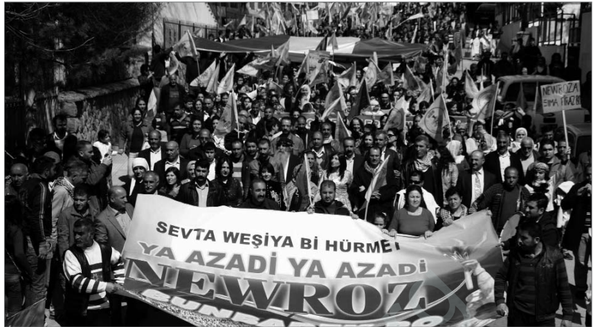
Newrozdemonstration in Amed

Am folgenden Tag versammelten sich erneut Menschenmengen beim (mittlerweile zurückeroberten) Demokratie- und Lösungszelt. In einer Pressekonferenz erhielten die Politiker und Vertreter der NGOs Gelegenheit, das Erlebte auszuwerten und zu kommentieren. Das brutale Vorgehen der Sicherheits- und Polizeikräfte wurde lautstark angeprangert und das türkische Innenministerium unter der AKP-Führung als verantwortlich für die Übergriffe auf die friedliche Menschenmenge zur Rechenschaft gezogen.