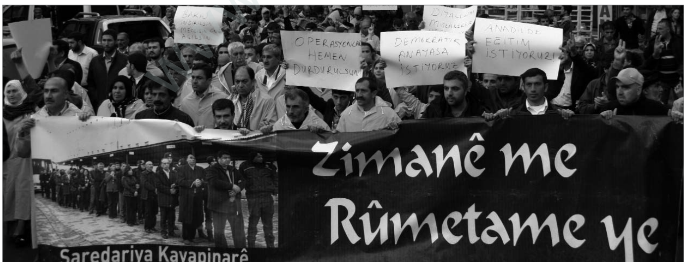
Demonstration in Amed mit einem Transparent festgenommener PolitikerInnen: „Unsere Sprache ist unsere Ehre“

Es werden tausende kurdische Politiker, Bürgermeister, Frauenrechtlerinnen und Menschenrechtler physisch gefangen gehalten, nur weil sie ihre demokratischen Rechte nutzen wollten. Da es ihnen im Verlauf des Prozesses nicht erlaubt ist, sich in ihrer Muttersprache zu verteidigen, reden seit genau zwei Jahren alle über sie, nur sie konnten noch nichts sagen. Wir erfahren das Verbot, die eigene Muttersprache zu benutzen, als eine extreme Einschränkung der Verteidigung vor Gericht, so dass dies einer Ablehnung gleichkommt. Ich möchte hier eine kleine Anekdote aus dem KCK-Verfahren in Amed (Diyarbakır) mit Ihnen teilen: Der Richter fragte alle Angeklagten, ob sie sich verteidigen wollten, und verwies darauf, dass der Antrag auf kurdische Übersetzer abgelehnt worden sei. Daraufhin formulierten alle als Antwort einige Sätze auf Kurdisch. Natürlich wurden die Mikrofone umgehend ausgeschaltet und so die Angeklagten zum Schweigen gebracht. Einer aus der Gruppe der Angeklagten antwortete dem Richter: „Zimanê me rûmeta me ye. Em bi tenê edalet dixwazin! Ne zilm ne merhamet, bi tenê edalet!“ (Unsere Sprache ist unsere Ehre)