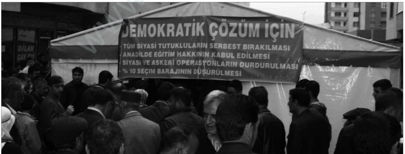
Seit dem 18. März wurden in vielen Städten Zelte für eine demokratische Lösung wie hier in Îdir aufgebaut. Sie sind Treffpunkt für Diskussion und Ausgangspunkt für Demonstrationen und Kundgebungen.

Wir sollten jedoch nicht vergessen, dass zu spät erfahrenes Recht keine Gerechtigkeit darstellt ... ♦