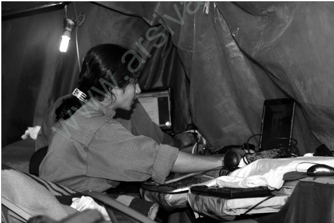
Arbeitsplatz der monatlich erscheinenden Zeitung „Star“

Ich habe vorhin davon gesprochen, dass wir versuchen, eine Alternative zu den herrschenden Medien darzustellen. Bei uns ist es zum Beispiel so, dass nicht immer dieselben Frauen auftreten, sondern die Meinung aller Guerillakämpferinnen gefragt ist. Es geht dabei nicht um die Stellung der jeweiligen Frau innerhalb der Organisation. Jede Guerillakämpferin soll über die Medien die Möglichkeit haben, sich mitzuteilen. Hier in den Bergen beschäftigen sich auch viele mit Literatur, mit Poesie, mit Philosophie. Wir leben hier in und mit der Natur, das bietet wunderbare Möglichkeiten, sich mit den verschiedensten Facetten der Philosophie zu beschäftigen. In den herrschenden Medien kommen oft immer dieselben Leute zu Wort; wir hingegen legen Wert auf jede einzelne Stimme, auf Vielfalt. Die Sichtweise jeder Einzelnen zählt. Es sind auch türkische Frauen hier, deutsche Frauen, iranische Frauen, daraus ergibt sich eine sehr bunte Sichtweise. ♦