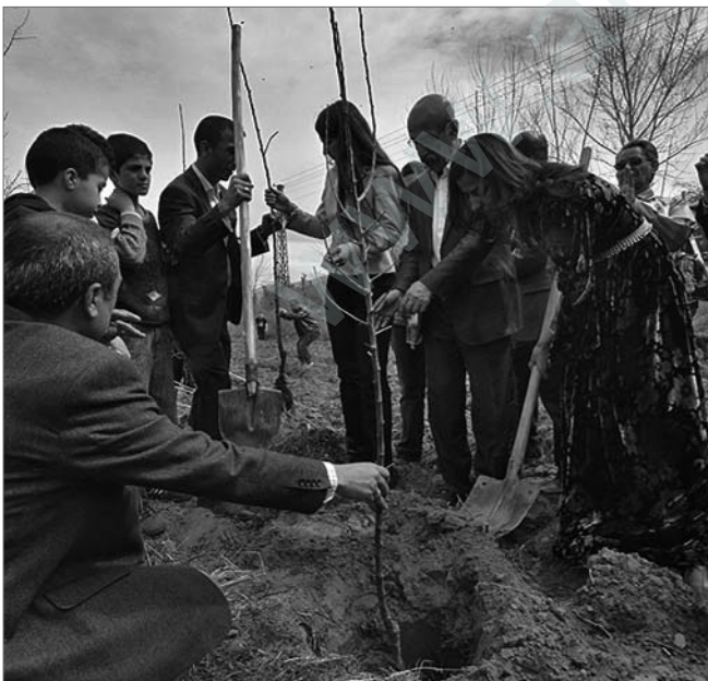
Baumpflanzaktion in Hêskîf