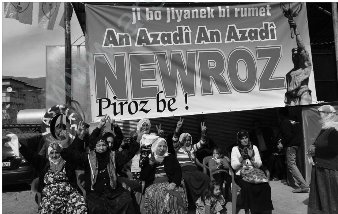
Newroz in Êlih (Batman): „Für ein Leben in Ehre – Entweder Freiheit oder Freiheit“

6 Toplum Ve Kuram, 4. Toplumsal Mücadele ve Politik Şiddet Hatında Kürt Hareketi (İstanbul: Toplum ve Kuram yayınları, 2010).