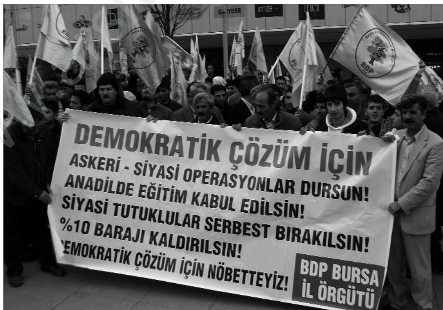
Die vier Hauptforderungen, die momentan für eine demokratische Lösung gestellt werden: „Ende der militärischen und politischen Operationen, Erziehung in Muttersprache, Freiheit für alle politischen Gefangenen, Absenkung der 10%-Hürde für das Parlament“

Im Rahmen der Anpassung der Funktion des Staatspräsidenten an das parlamentarische System sollte der Staatskontrollausschuss abgeschafft werden. ♦