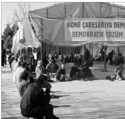
An vielen Orten wurden „Zelte der demokratischen Lösung“ errichtet als Treffpunkt zur Diskussion und Aktion.