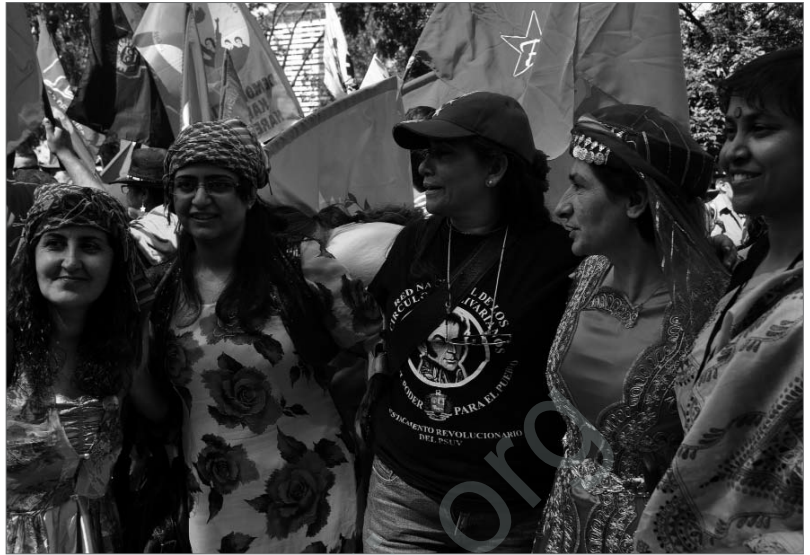
Kurdinnen bei der Weltfrauenkonferenz der Basisfrauen in Venezuela

Internationalismus wird ja gerne auch polemisch mit Bindestrich als Inter-Nationalismus kritisiert. Ich denke aber, dass es eine Tatsache ist, dass viel politisches Denken z. B. in Deutschland einfach sehr national geprägt ist. Es gibt national sehr unterschiedliche Politikstile und wenn man ehrlich ist, findet Politik immer noch ganz überwiegend im nationalen Rahmen statt. Es gibt auch keine wahnsinnig gute Zusammenarbeit beispielsweise mit polnischen oder tschechischen Basisinitiativen, sondern das ganze Denken bleibt sehr stark im nationalen Rahmen verhaftet. Und bei dem Versuch, diesen Rahmen zu sprengen, ihn ein Stück weit zu ignorieren oder unter Beibehaltung der bestehenden Grenzen der Türkei zu agieren, interessiert dieser nationale Rahmen erst einmal nicht. Sondern es werden Netzwerke in alle Richtungen über