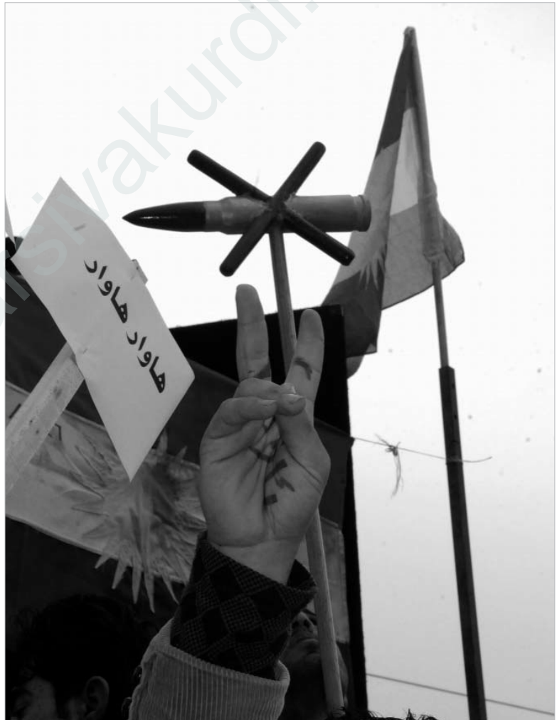
Demonstration in Silêmanî/Südkurdistan