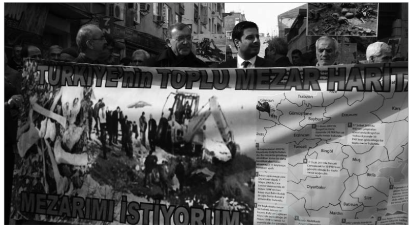
Demonstration zu den Massengräbern in Mêrdîn

Die Massengräber lehren uns noch etwas anderes. Die Lektionen aus der Mordserie namens »Morde unbekannter Täter«, die Lektionen der Verschwundenen werden noch einmal klarer. Sie zeigen uns die Kontinuität zwischen denen, die brutal töten, in ein Massengrab werfen und so glauben, Verbrechen gegen die Menschlichkeit vor Menschheit und Geschichte verbergen zu können, und denen, die heute – also im 21. Jahrhundert –, anstatt sie im Namen von Gerechtigkeit, Aufarbeitung oder welchem ethischen Wert auch immer auszugraben, der Wahrheit nachzugehen und die Schmerzen zumindest ein wenig zu lindern, lieber das Thema schließen, ignorieren und tun, als sei nichts gewesen. So handelt der Staat, so IST der Staat! Regierungen, MinisterInnen, Soldaten oder BürokratInnen kommen und gehen im Laufe der Zeit. Einer tötet und verstreut die sterblichen Überreste in der Weite der Landschaft, eine/r ignoriert, der nächste führt eine halbherzige Grabung durch und bemüht sich zu verhindern, dass herauskommt, wem die Knochen gehören und wer Anteil an diesen Gräueln hatte. So funktioniert die Arbeitsteilung. Vielleicht besitzen sie verschiedene politische Überzeugungen, Stile, Glaubensrichtungen, doch alle sind sie Teile des modernen