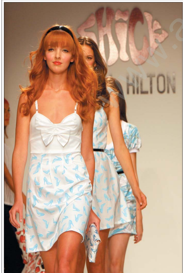
Kaliforniyanın stodyolarında Mercedes Benz fuarını dolayısıyla modeller arz ediyorlar

6 milyon 600 bin YTL muhammen bedelli Muğla'daki turizm tesisi ile 6 milyon 260 bin YTL'lik üzerinde fabrika binası bulunan İstanbul'daki arsa da yüksek bedele sahip gayrimenkuller arasında bulunuyor.