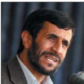
PNA-Iran Cumhurbaşkanı Mahmud Ahmedî-

nejad, Ermenilerin 1915 yılında yaşanan olaylarla ilgili iddialarına ilişkin "Dünyanın her yerinde, kim tarafından yapılsa yapılsın, bütün zulümleri kınıyoruz" dedi.