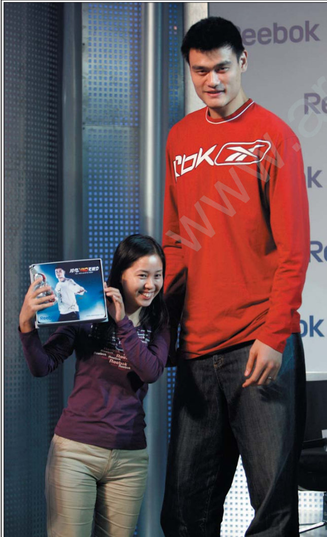
Çin oyuncu yau mink bir kıza Ermağan sonuyor.

Bu kapların firavunun öteki dünyaya yolculuğu için erzakla doldurulmak üzere konulduğu düşünülüyor.