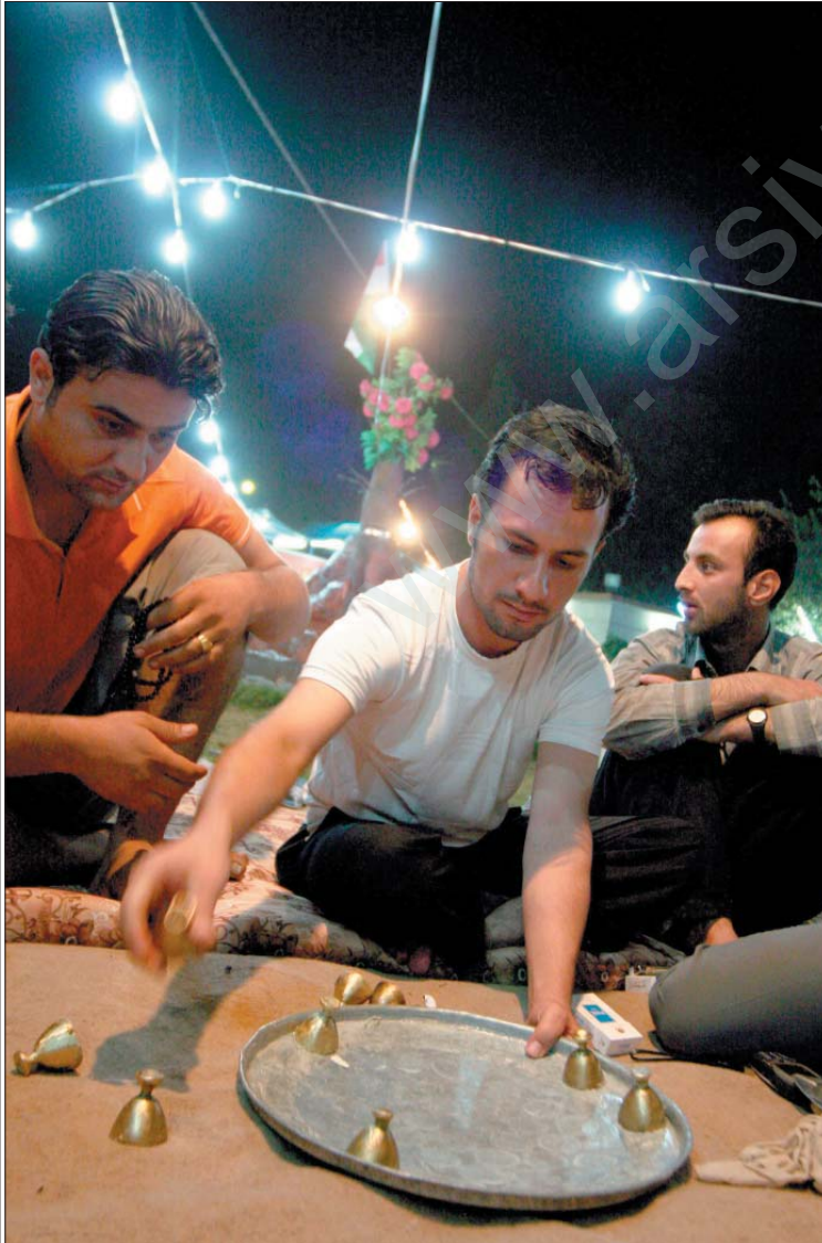
Erbin Ramazan Geceleri.

Kalan güllaç yaprakları teker teker sütlü şerbet ile ıslatılarak tepsiye yerleştirilir. Kalan süt, güllacın üzerine dökülür, yarım saat kadar bekletilir. Üzeri isteğe bağlı olarak, dövülmüş fıstık, nar tanesi, vişne tanesi, dondurma gibi malzemelerle süslenir, servis edilir