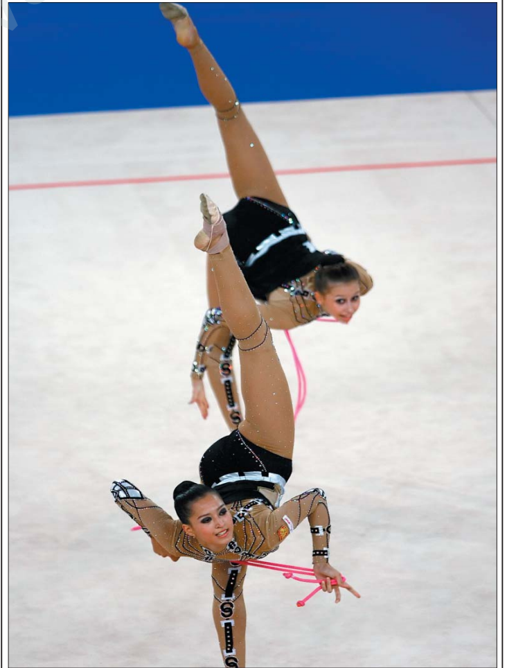
Yunanistan'da 200 kilometre güney batısı patra kentinin son dünya Şampiyonun 23 Eylül 2007'de başladı. Bu Şampiyonda ipoymağı yerli Cam baz oynamak Rus timi taraftan dönüştü.

Avrupa Şampiyonası'nda milli takım, yarın TSi 16.00'da İtalya ile karşı karşıya gelecek.