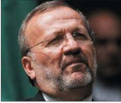
-İran Dışişleri Bakanı Menuçehr Mutteki 62. BM Genel Kurul otur-

mu için gittiği New York'ta Avustralyalı meslektaşıyla görüşmesinde İran'ın Irak'ta güvenlik ve istikrar için bütün çabasını ortaya koyduğunu söyledi. İRNA'nın geçtiği haberde, Mutteki bu görüşmede Irak'ın güvenlik ve istikrarının iyi ilişkilere sahip ülke olarak İran açısından önemine değ-