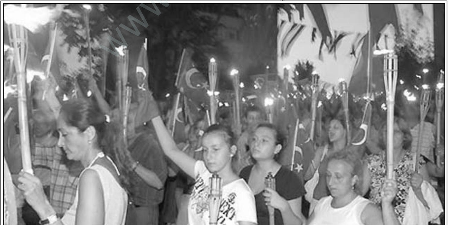
İstanbul Beşiktaş'ta, 30 Ağustos Zafêr Bayramı kutlamaları çerçevesinde dün akşam fener alayı düzenlendi. Yürüyüşe çok sayıda kişi katıldı.

Seri numaraları çakışan silahlar arasında, ABD»nin Irak güvenlik güçlerine dağıtmak üzere satın aldığı Avusturya yapımı «Glock» marka tabancaların da yer aldığı belirtildi.