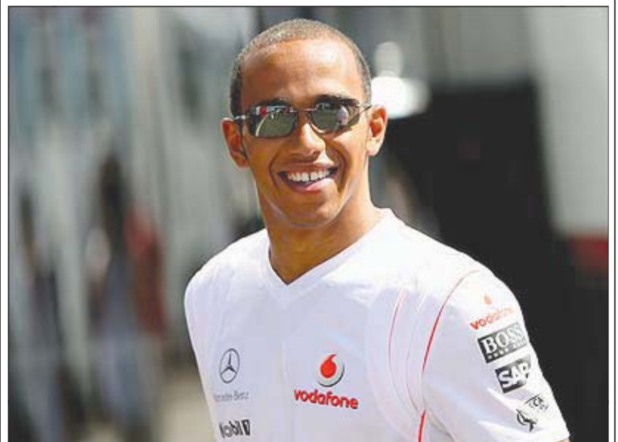
Championship leader Lewis Hamilton is in a jovial mood as he arrives at the Istanbul Park track ahead of the race

sana sadece bir soru soracağım: Kral olmak varken, neden bir prens olarak kalırsın?