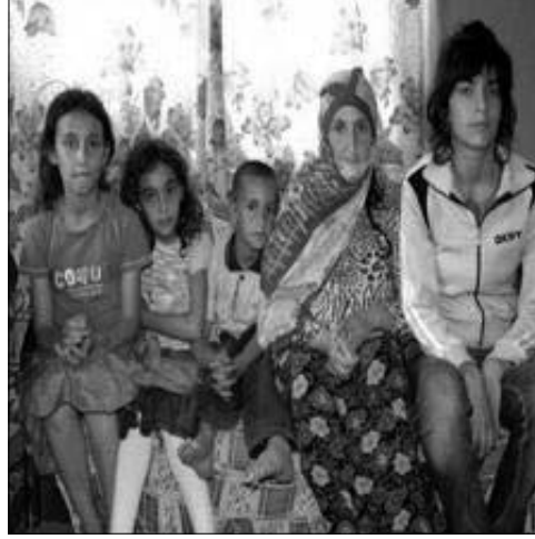
karşılacak kadar para kazandığını ifade eden Yılmaz, şunları söyledi: "Şimdi evimize hiç para girmiyor.

Belediye 2 öğün yemek getiriyor. Yetim ve Öksüz Çocukları Koruma Derneği (YÖÇEYDER) zaman zaman yardım ediyor. Kanser tedavisi gördüğüm için günlerimin çoğunu hastanede geçiriyorum. Çalışmayacak durumdayım. Çocuklarımın çoğu küçük olduğundan sadece bir kısım çalışabilecek yaşta ama o da iş bulamıyor. Ne yapacağımızı şaşırık. Evli olan oğlumun sigortasından yararlanıyorum. O da olmasa tedavimi de yaptıramazdım."