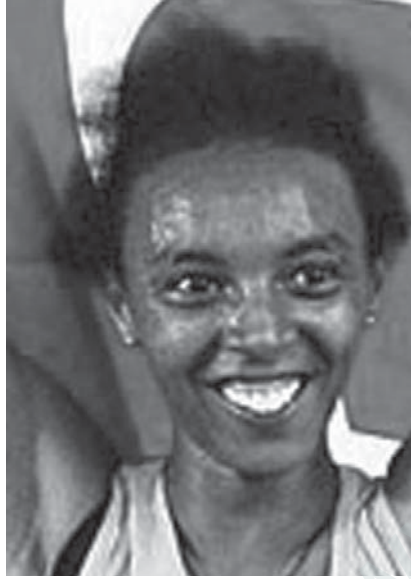
Milli atlet Abeylegesse, İtalya'daki 10 Bin Metre

Kupasında geçen yılki derecesinden 64 saniye kötü koşup altını kaptı.