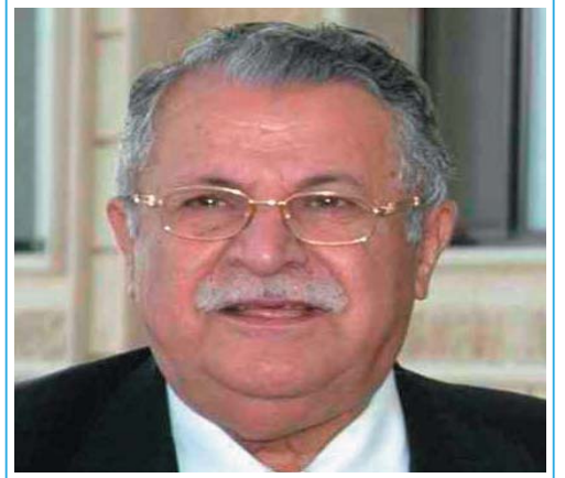
Cumhurbaşkanına Geçmiş olsun..

atmış olan ünlü savcı Patrick Fitzgerald, görevine çağrılmayı" ifadelerini kullandı. Demokrat Pelosi, çarşamba günü yaptığı Şam gezisinde, Devlet Başkanı Başar Esad ile görüşmüştü. Pelosi'nin, "teröre destek veren ülkeler" arasında sayılan bir ülkenin lideriyle görüşmesi, Başkan Yardımcısı Dick Cheney dahil Bush yönetimini üst düzey yetkililerinin tepkisini çekmişti.