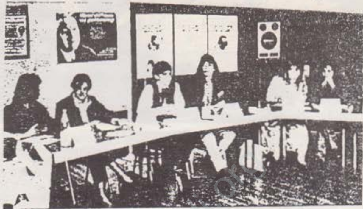
10 Mart 1991, Erkrath paneli

Panel, birçok eksikliğe rağmen olumlu geçti. Panelde de birkez daha Kürt halkına ilginin eskiye nazaran yükseldiğini görmek mümkündü. Bunu KOMJIN tem-