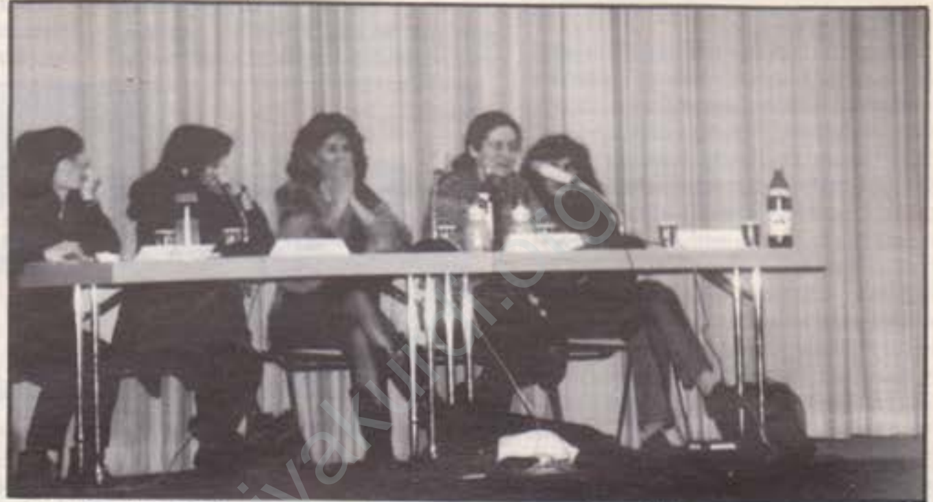
Panelden bir görüntü

lundular. Panel ve gece gününde yoğun şekilde görev alan KOMJIN'liler, kolektif çalışmanın örneğini gösterdiler.