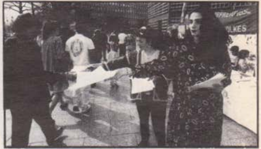
Berlin eyleminden bir görüntü

Daha sonra KOMJIN-Wuppertal adına bir arkadaş