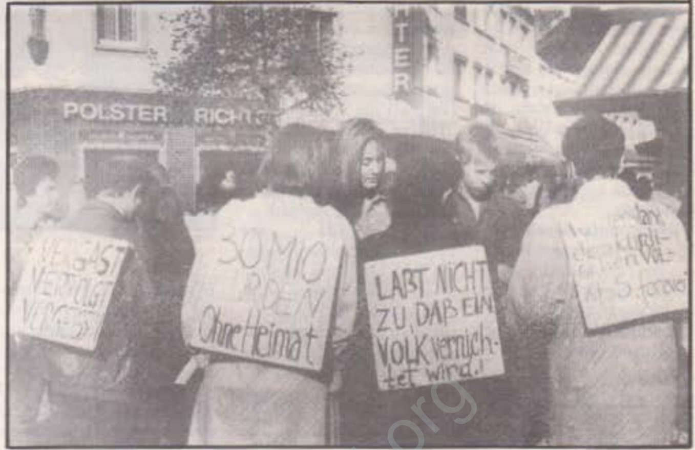
Mainz Eyleminden bir görüntü

Eylem süresince birçok insanla, kuruluşla ilişki kurdum. Bizim standımız Mainz Barış Girişimi ve Irak Kürt Öğrencileri tarafından devr alınıp bir hafta daha