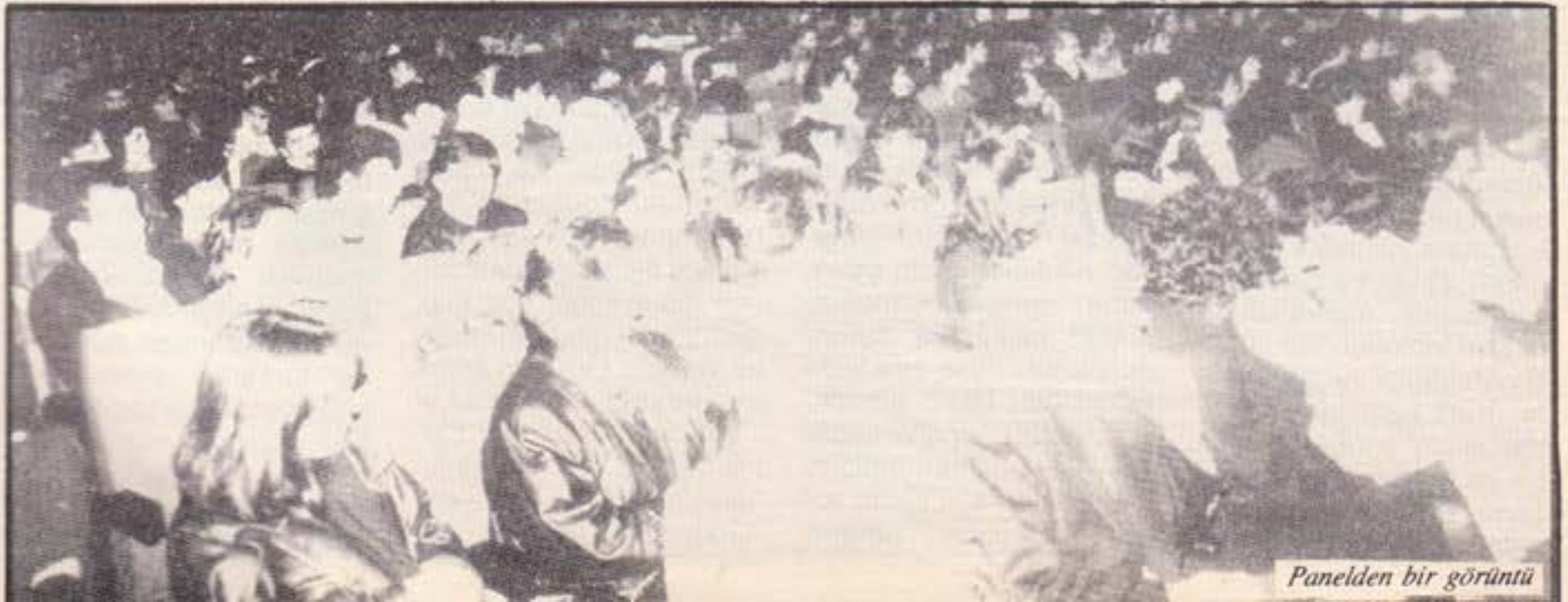
Panelden bir görüntü