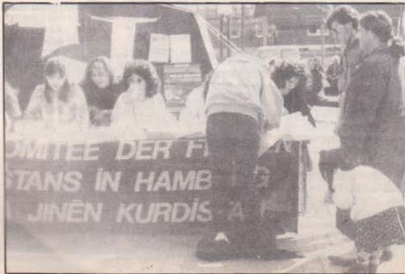
Hannover eyleminden bir görüntü