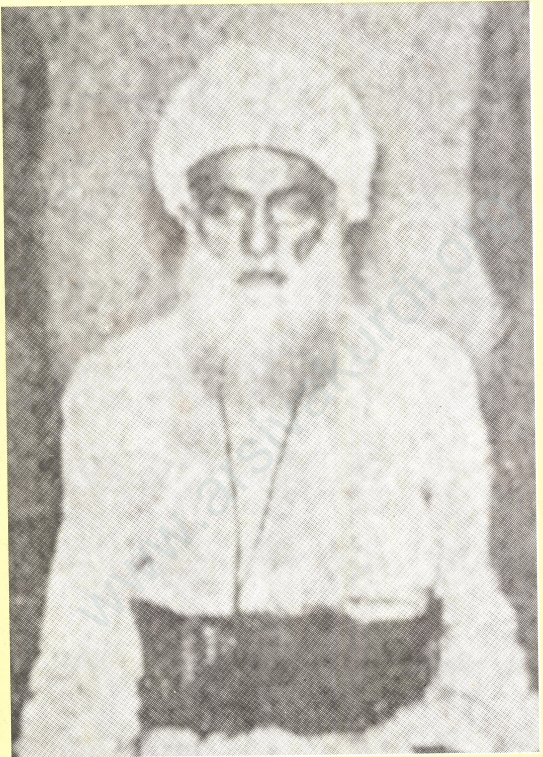
Serokê Serhildan a 1925'an Sêx Said