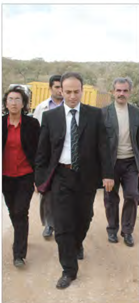
DTP'ê ji bi tevlibûna endamên Desteya Navendî û şaredaran heyetek şand gundê ku qetliam lê çêbûye.