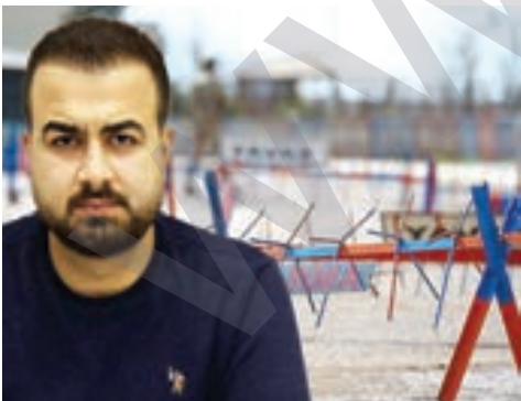
Rewşa hepsîyo nêşew xidar bena

8. Mehkemeya Cezaya Girane ya Amedî 4ê Çileyê de Balukenî rê sûcê 'endamê organizasyonî bi-yayîşî' ra 7 serrî û 6 mengî, sûcê 'propagandaya organizasyonî' ra 4 serrî û 7 mengî û sûcê 'muxalefetê qanûnê kombiyayîş, numayîş û rayraşîyayîşî' ra zî 4 serrî û 7 mengî ceza dabî. AMED