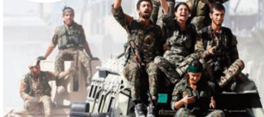
Li ser rewşa Sûriyeyê hem agahî da endaman û hem jî pirsên wan bersivandin. Li