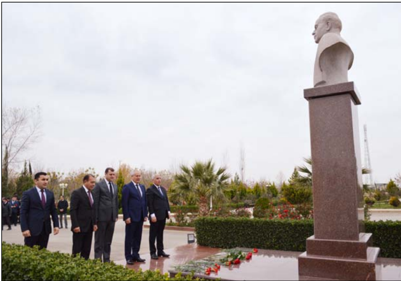
söz açaraq, müasir Azərbaycan dövlətinin Heydər Əliyevin dünyada layiqli yerini tutmasını xüsusilə vurğulamışdır.

Tədbirdə rayon sakinləri ümummilli lider Heydər Əliyevin əziz xatirəsinin xalqımızın qəlbində əbədi yaşadığını, onun əvəzolunmaz ideyalarının dövlətimizin inkişafı və tərəqqisi yolunda əbədi mayaka çevrildiyini bildirmişlər.