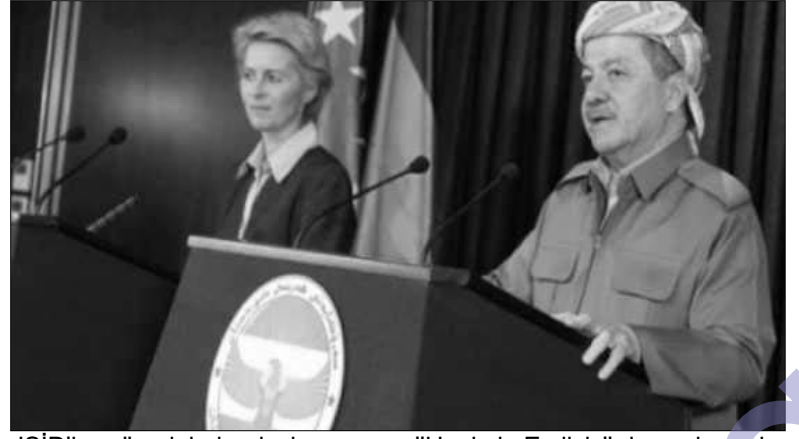
IŞİD'le mücadelede uluslar arası "Hepimiz Ezdiyiz" demesi gerek toplumun "Hepizmi Kürdüz", tiğini düşünüyorum" (r.z)

toplumun Kürdleri daha fazla destelemesi gerektiğini de vurgulayarak Almanya hükümetinden Kürdistan Bölgesi'ne IŞİD'le mücadelede daha fazla yardım göndermesini talep etti. Almanya Savunma Bakanı sözlerini şöyle sürdürdü: " Birkaç gün önce Erbil'deydim ve durumu yakından görme fırsatım oldu. Tüm Avrupa ve dünya hep bir ağızdan Charlie Hebdo'ya desteğini sunmak için " Hepimiz Charlie'yiz" diyor ve bu son derece önemli.