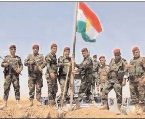
Til Şeir'e hava bombardımanı

kantonunun yaptığı seferberlik çağırısına verilmiş bir yanıt olarak görüyoruz" diye konuştu. Hesên kendilerine ulaşan yardımdan başka bir silah yardımı sözünü almadıklarını söyledi.