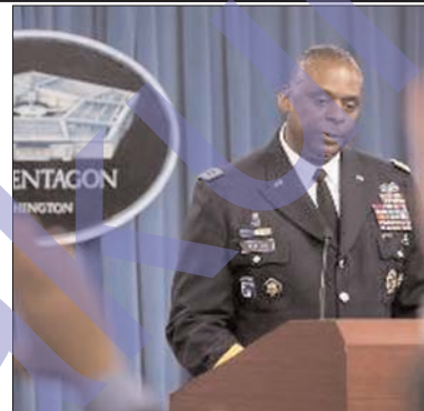
победу пока торопиться не стоит. Столкновения в Кобани

Тем не менее, генерал, в ходе своего доклада в Пентагоне, предупредил, что затишье в Кобани ещё может быть нарушено, и объявлять