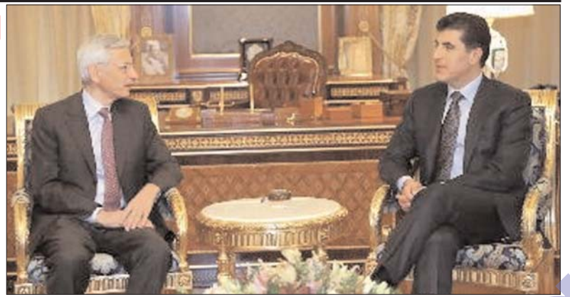
Премьер-министр Барзани большую политическую поддержку Курдистану.

Стороны обсудили вопросы безопасности и военную ситуацию в Ираке и сирийском курдском городе Кобани. Премьер-министр Барзани отметил, что Курдистан ценит отношения с Францией и заявил, что правительство и народ Курдистана благодарны за визит президента Франсуа Олланда в Эрбиль.