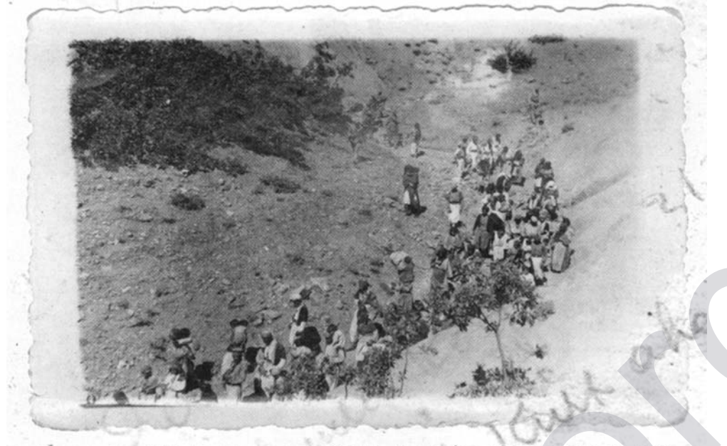
Fotoğrafın öyküsü: 14 Ağustos 1938'de Dersim'in Halvori köyünde 217 kişi ölümüne götürülürken...