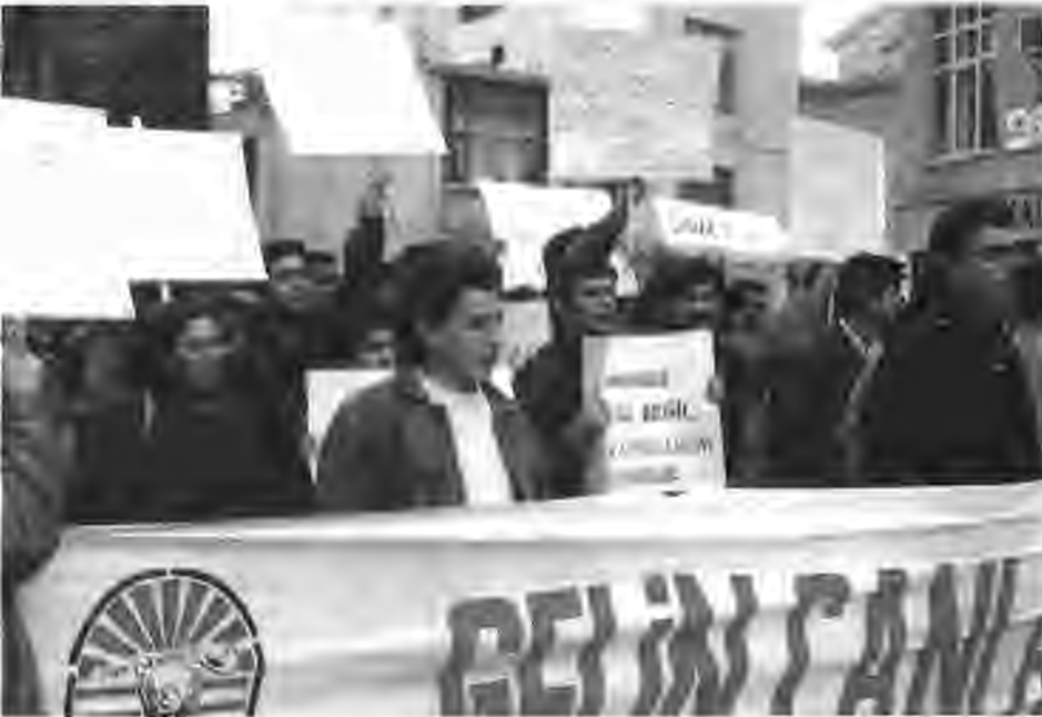
Dersim'deki vahşetin protestosu edildiği Kartal'daki Dersimliler Mitingi.

Bugüne kadar beslediği ve desteklediği sunni islam anlayışı bir şeriat tehlikesine doğru giderken, mevcut sistemde rahatsız eder duruma gelmiştir.