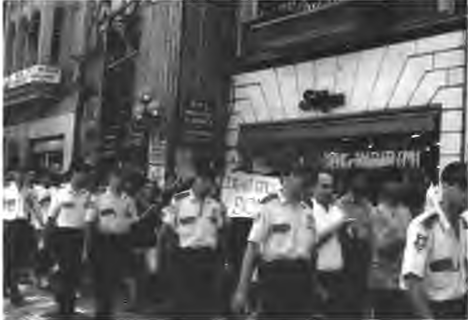
Beyazlın - İstiklal Caddesi'ndeki protesto yürüyüşümüz

Dersim'de köylerimizin yakılmasıyla birlikte gösterdiğimiz tepkiler sonucu derneğimiz hakkında gösteri ve yürüyüş yasasına muhalefel etmekten dolayı toplam 7 ayrı dava açıldı. Bunlardan ikisi sonuçlandı. Halen beş ayrı açılmış davadan yöneticilerimiz yargılanmaktadır. Söz konusu davalar, yaptığımız Basın Açıklamaları, Taksim- İstiklal Caddesindeki Yürüyüşümüz ve son olarak da 24 Eylül 1995 te Açık Hava Tiyatrosunda yaptığımız Halk Şöleni Gecemiz . Onlara göre bu yaptıklarımız amaç dışı faaliyetmiş. Yönetim olarak gösterdiğimiz lavir meşru hakkımızı kullanmaktır. Dersim'de yaşanan vahşete seyirci kalamazdık. Aksi güç vermek, onaylamak olurdu. Kamuoyunu bilgilendirmede görevimizi yerine getirdik. Çünkü yerimiz, ezilenlerin, insan hakları savunucularının ve demokrasi mücadelesi verenlerin yanındır. İşte meşruluk hakkımız buradan geliyor, diyerek kendimizi savunduk; bundan sonra da böyle olacaktır. Dersim'de halen baskılar bitmiş, göç durmuş değil. Bu demektir ki, yeni davalar bizi bekliyor. Bu noktada üyelerimizden, Dersimlilerden ve dostlarımızdan destek bekliyoruz, derneğimizle sürekli ilişkide olun, sizin olan derneğimize sahip çıkın ki daha da güçlensin. Hepimizin buna ihtiyacı vardır.