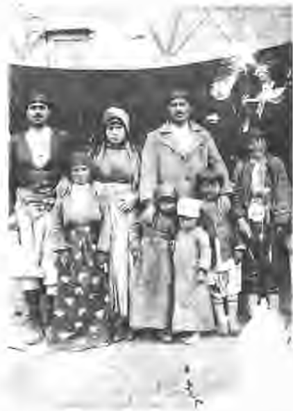
Mulxê jü çei, "Kalık, Pırıkê, Laç, weyvı, torn.

Endi na çe ê dı dergus i esta. Dergusê dı laik bî vane: "pıt" cênek i biyê vane: "pıt". Dergus ê zerê cei dı zaf wairê qedır qımet a. Çıkê warê cei a / o keno kewi. Laik hatê sinsıl ê derg kerdê ne re caê xo xelê berco. Hirê roc kî bi tamam awıki kenê maê ro sıt ê xo eno, maê domanı lawnê na.