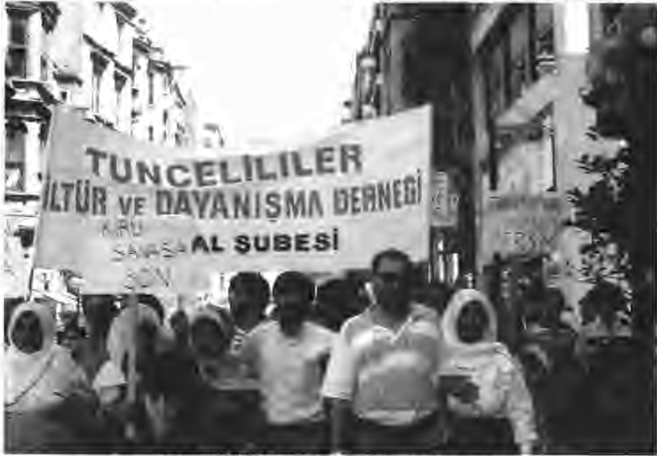
Taksim'deki Özel Tim terhoritli protesto yürüyüşümüz.

ması ve kitleselleşmesi gerekiyor; bu tamamen size bağlıdır. Derneğimizle sürekli ilişkide olmanız, toplantılara katılmanız, eksiklerimizi söylemeniz yapacaklarımız konusunda bize ışık tutacaktır. Bugüne kadar sayısız uluslararası kurum ve kuruluş bizi ziyaret etti, insan hakları kuruluşları ve araştırmacılar, basın mensupları çalışmalarımızı ve Dersim'de yaşananları Türkiye ve Dünya kamuoyuna taşımada yardımcı oldular. Bu süreçte amatörce çalıştığımızın farkına