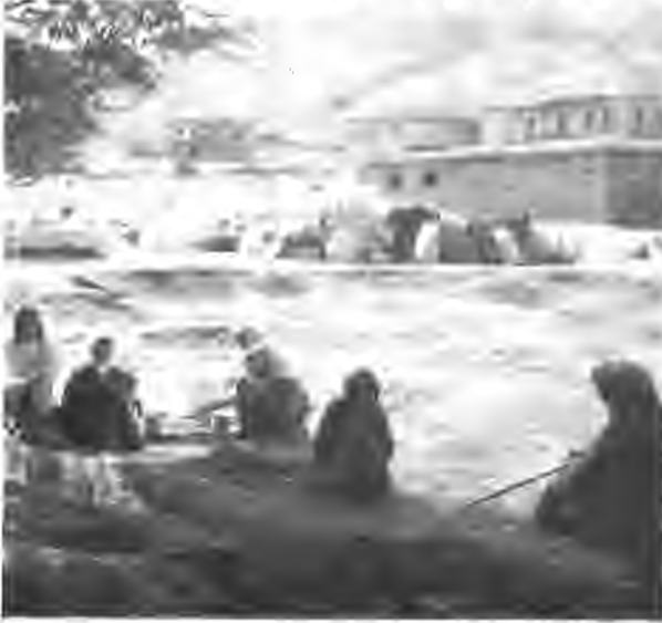
Zorla boşaltılan köylerimizden biri.

Dersim'de köyleri yakılarak mağdur edilen, hiç bir geliri olmayan ve halen prefabrik evlerde, düğün salonlarında bir bir zorlukla yaşamını sürdürmeye çalışan bu insanlarımızla dayanışmada bulunmak için, derneğimizin 1-30 Kasım 1995 tarihleri arasında açtığı Bir Günlük Gelirini Tunceli Halkına Bağışla kampanyasına 30.000.000 milyon lira gelmiştir. Kam-