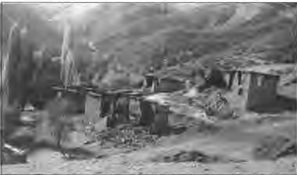
Yakılan köylerimizden Karataş Köyü.

Dersim'de süregiden askeri hareketler/operasyonlar tüm vahşetiye devam etmektedir Zoraki göç, köylerin ve ormanların yakılması giderek bölgenin insansızlaştırılması gırla gidiyor.