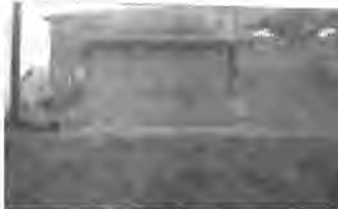
Hozat - Hadişer Köyü.