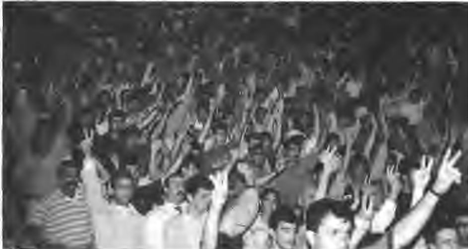
Harbiye'de düzenlediğimiz Halk Şöleni. Biterce yürek bir olmaştı.

Sonuç olarak bazı tatsız olayların yaşanması yalnızca dernek yönetiminin üstesinden geleceği olaylar olarak düşünülmemeli. Yanlışlara tavır alıp ikaz ederek bu tür eksikliklerinde üstesinden gelebiliriz. Yalnızca yakınmak olayı çözümüyor. Öğretici olmak zorundayız. Güçlü olan halktır. İstersek olumsuzlukları doğru yöne çevirebiliriz. Bu herkesin sorunu olmalı diye düşünüyoruz. Gecemize katılarak bize destek sunan başta Dersimliler olmak üzere Türkiye'nin çeşitli yörelerinden gecemize katılan Dersim halkının dostlarına, demokratik kurum ve kuruluşlara, sanatçılarımıza şükranlarımızı sunuyoruz.