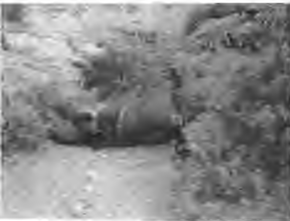
Hadîşer Köyü'nde vurulan atlardan biri.

Uzun süreden beri yapılan askeri operasyonlarla birlikte Dersim'de köylerin yakılması, zoraki göç, yiyecek ve giyecek amborgosu yetmiyormuş gibi, şimdi de köylülerin hayvanları öldürülüyor. Gerekçe ise sözkonusu hayvanlarla gerilla yiyecek taşıyormuş. Hozat ve Çemişgezek'te köylülerin ellerindeki at ve katırlar numaralandırılmış. Katır ve atların arazide ya da köylerin dışında herhangi bir yerde bulunması durumunda, devlete göre, gerilla, yiyecek taşıyormuş. Sahibini ve atını "ölüm yolculuğuna" çıkarmanın gerekçesi hazırlanmış oluyor. Yazdan beri devam eden bu uygulama kasım ayı içinde Hozat ve Çemişgezek'te, gerilla yiyecek taşıyor diye, ne kadar at ve katır varsa öldürülmüş. Bölgede yaşam çekilmez hal almış durumda. Köylüler bu hayvanları çift sürmeden tutun da her türlü yük taşıma işlerinde kullanmaktadırlar. Yeniden satın almaya kalksa 50-60 milyon verip alması gerekiyor. Zaten istesede bulamaz. Çünkü onlarda suçlu görülmüş. Bu demektir ki size yaşam hakkı tanımıyoruz. Çıkin gidin, nereye giderseniz gidin. Yeter ki burada durmayın denilerek insanları zoraki büyük şehirlere gönderip bölgeyi tamamen boşaltmak istiyorlar.