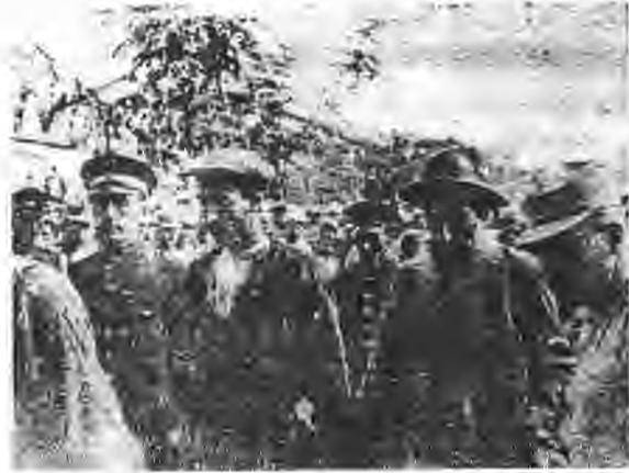
Seyit Rıza ve Arkadaşları idam edilmeden önce.

Savcıya gittim. Durumu kendisine anlattım. Bu konuda Adalet Bakanlığında da bir şifre aldığını, ama mahkemelerin cu-