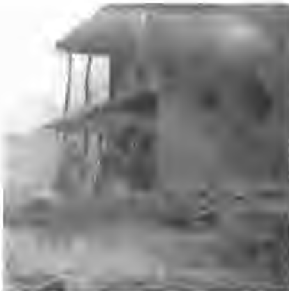
Ovacık - Haethirim Köyü (Ekim 1994)

Balveren (Kulikan), Bilgeç, Çat, Çayüstü (Malmikrek), Dumantepe (Ağdat), Eğimli (Maraş), Eğrikavak (Kalikuşağı), Eskigedik (Birman), Güney Konak (Çarkperi), Işıkvruran(Harsin), Kozluca, Köselor, Kuşluca (Derik), Mollaaliler, Otlubahçe (Gazikuşağı), Yazıören(Velolar), Karaoğlan, Buzlu tepe (Kakbil), Elgazi, Halitpınar, Cevizlidere (Merhop), Çalbaş (Birdo), Karataş, Bilekli.