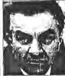
İçişleri Bakanı Menşe

"Her gördüğünüz helikopter, bizim helikopter sanmayın. PKK'nın helikopteri de olabilir. Rus, Alman, Ermeni helikopteri de olabilir. Çünkü, bazen sınırları edip girebiliyorlar." Sinan Yerlikaya'nın gözü, o anda İçişleri