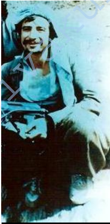
شه هيد خه ليل خوشكه لام

شه هيدان به ريزن، هه ميشه له دلان دان و قهت له به ر چاوان ون نابن. ئه وان پيشه نكي خه بات و نيشانده ري ريگه ي رزگاري و نه جاتن. ئه وان ووره و ووزه ي شو رشن و ماموستاي قوتابخانه ي في داكار يي و خو به خت كردن. ئه وان سه نكه ري قاييم و له گرتن نه هاتوو ي بزوتنه وه كه مان و ده زمايه ي قهت له بران نه هاتوو ي خه با ته خوينا وييه كه مان، بو يه ئيمه هه ميشه به چاويكي پر له ريزه وه له كو ر ي شه هيدان ده روانين و به دل يكي پر له خوشه ويستييه وه ياديان ده كه ين و باسيان ده كه ين. يادي ئه مجاره مان يادي شه هيد ي قاره مان كا ك خه ليلي مهمه ديي (خه ليل خوشكه لام) ه.