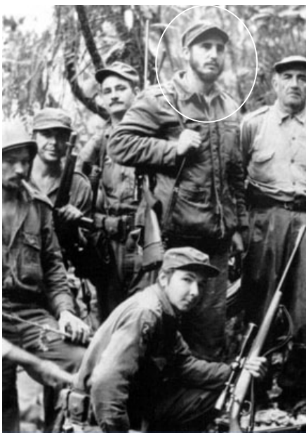
چی گوڤارا و هیندی که له هاوریانی له

(کیلی نوریین)، به ریوه بهری به شی فروشی مه زادخانهی شاری دالاس که مووه کهکانی گوڤارای فروشتوه، ده لی: ته نیا به لگه له سه ره ئه وهی ئه و ئیسکوپروسک و شتوممه کهکانه براونه کوبا هی گوڤاران، دی ئین ئه (DNA) مووه کهکانی چی گوڤاران.