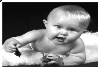
ئەو زمانەیی تەنیا لە شەش وشە پیکھاتووە ...