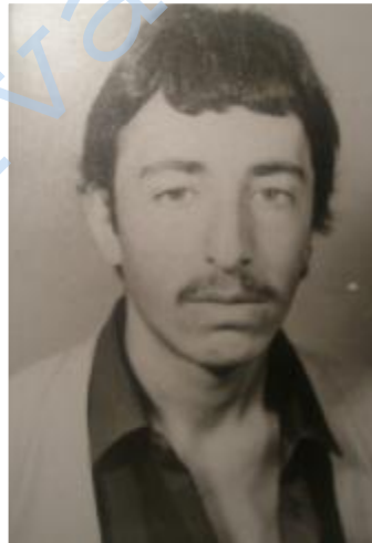
شههید عهزیز عه بباسی

شههید عهزیز پيشمه رگه بیهکی به راستی نازا و به ووره و باوه بوو، له لای خه لکی به پیز و له لای هاوریکانی خۆشه ویست بوو. پاش نه وهی ماوه بیهک له هیزی شههید سهید خه لیدا ئه رکی پیروزی پيشمه رگایه تی به و په پری دلسوزی و لیهاتوویی ئه انجامدا. له سه رماوه زی سالی ۱۳۶۳ ی ک ه دا چۆ ناوچه ی سه رده شت و له ریزی پيشمه رگه کانی هیزی سه رده شتدا دژی دوژمنانی نازادی قاره مانانه جهنگی و له چه ند چالاکیه کدا نازایانه به شداری کرد، هه تا له رۆژی ۱۳۶۳/۱/۱۱ له شه ریکدا، که له نزیک گوندی نستانی ناوچه ی گهورکی سه رده شت له نیوان هیزی هیرشکهری رژیم و هیزی پيشمه رگه دا رویدا، به گولله ی به کریگیروانی خومه یینی پیگرا و به شانازییه وه مالاوایی له گه ل و نیشتمان و هاواله قاره مانه کانی کرد.