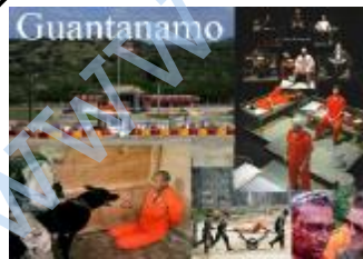
چەھەندەمیک لەسەر زەوی ...