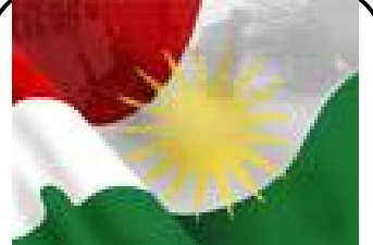
بەگرتن ھەوینی سەرکەوتنە