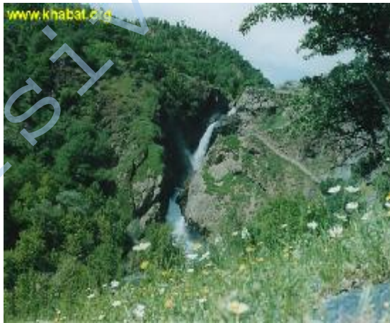
تافگه شه لاشما (ناوچه ي سهرده شت)... له مالپه رې "خه بات" وهر گيراوه

له و ساته وه ي له ته ني اييدا جيم هيشتي و برپارمان دا تو پوم ببی به دايكيك و منيش بيمه كورپه بو تو. له و ده مه وه ي كو تا كوچمان سه فه ريك بوو دوور و دريژ، هه ر له و ساوه، له و كاته وه چوار وهرزي من هه ر پاييزه، هه ر ده گه رپم بوو نيگايه ي له دیداری گهلم زيزه.