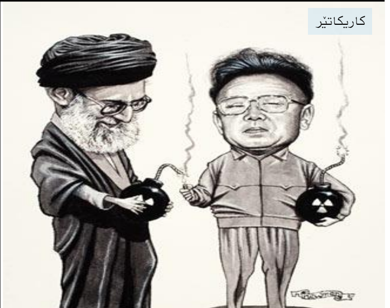
ئيران و کوره و کيشه ي ئه توم