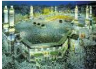
جێژنی پیرۆزی رەمەزان لە ھەموو لایەکی پیرۆز بێت ...

ھەر نوسراو و بابەتیک کە لە گۆڤاری "بەستان" دا بلۆدەبیتە نووسەری بابەتەکە لێی بەرپرسیارە و مەرج نییە دەربەری بۆچوون و سیاسەتەکانی رێکخراوی خەبات، شۆرشگێڕی کوردستان بێ.