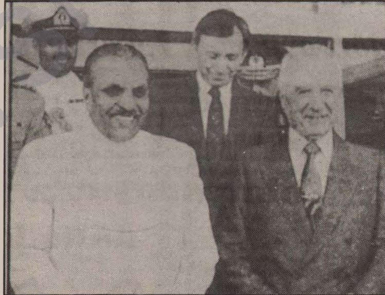
Diktatörlerin dostluğu ve sonları aynı...

Pakistan halkı, bir uçağın infilak etmesi sonucu ölen diktatör Ziya Ül Hak'tan kurtuldu.