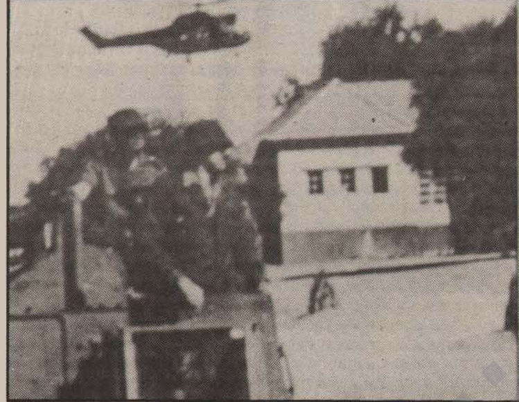
Angola'daki Güney Afrika Birlikleri

bağımsızlığa ulaşmış, savaştan yeni çıkmış ve savaşın sonuçlarının en yoğun bir biçimde yaşayan bir ülke olarak, böylesi saldırılara maruz kalması, Angola devrimini tehdit eden bir durumdu. Zaten ulusal kurtuluş hareketlerinin en fazla zorlandığı ve en fazla başarısızlık tehdidi ile karşı karşıya oldukları dönem de ulusal kurtuluş savaşının zaferle taçlandırıldığı ve devrimi inşaya geçtiği ve her alanda yeni inşanın yaşandığı sü-