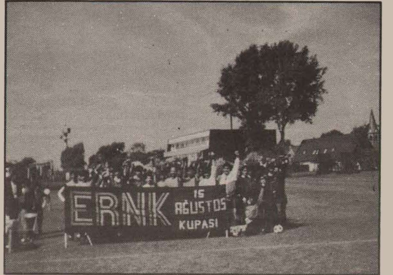
15 Ağustos kupası futbol turnuvasına katılan takımların toplu resmi

Toplam altı maç sonrası tüm takımların puanı aynı olunca, penaltı atışlarına geçildi. Penaltı atışlarının tamamlanmasıyla 15 Ağustos Zafer Kupasını Dersimspor kazandı. İkinci Welat-