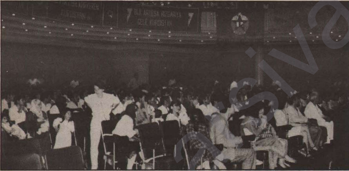
Paris'te yapılan geceye 2000'in üzerinde yurtsever emekçi katıldı

Paris'te gerçekleşen 15 Ağustos Atılımıyla dayanışma gecesine; Tamil Kaplanları, Av. Dev-Genç, MLSPB ve THKP-C (A-cilciler) dayanışma mesajlarını göndererek geceye güç kattılar. Gece organizasyonunda görülen bazı teknik yetersizliklere rağmen, HUNERKOM Paris kültür ekibi ve HUNERKOM merkezi kültür ekibinin ortaklaşa hazırlayarak sunduğu program kitleler tarafından beğeni ile izlendi.