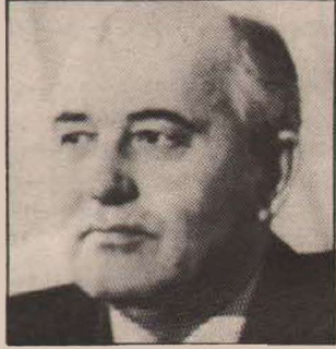
G O R B A Ç O V

Böyle bir görüşmenin de, ancak START antlaşmasının kesinleşmesi ile mümkün olabileceğini vurgulayan Gorbaçov, "Görüşmelerde daha fazlasına da ulaşılabilirdi" diye bir açıklama yaptı.