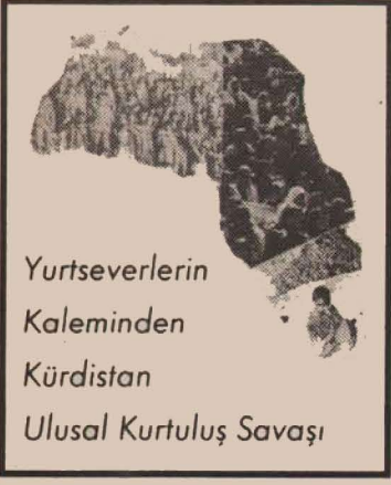
Yurtseverlerin Kaleminden Kürdistan Ulusal Kurtuluş Savaşı