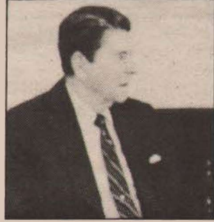
R E A G A N

Görüşmelerden sonra gerek Reagan ve gerekse Gorbaçov ayrı ayrı yaptıkları basın toplantılarında, görüşmelerin başarılı ve büyük bir olay olduğunu belirttiler. Gorbaçov, INF antlaşmasına atfen, "akıl ve gerçekliğin zaferi" derken, Reagan da bunun, "tarihi bir an" olduğunu belirtti.