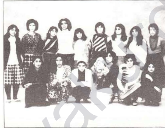
Diyarbakır cezaevinde tutuklu bayanlardan bir grup / 1984

Evet, bu tür yöntemlere ilişkin örnekleri çoğaltmak mümkün. Kaldı ki benim sözünü ettiğim en kaba yöntemler. Bu yollu çok daha ince yöntemlerin varlığı sözkonudur.