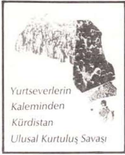
Yurtseverlerin Kaleminden Kürdistan Ulusal Kurtuluş Savaşı