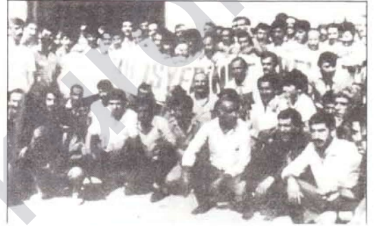
Migros grevindeki işçiler

Faşist rejimin ortaya çıkardığı derin çöküş, yoksullaşma kitleleri birçok yönden etkilemekte, bunalım ortaya çıkarmaktadır. Yoksullaşma kitleleri rejime karşı büyük bir kin beslemesine rağmen, bunu doğru bir kanala aktarama-