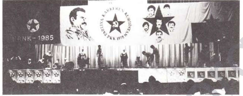
Hannover Folklor Ekibi, Kürt sosyal yaşamını canlandıran bir oyunu da sahneledi

"Değerli yurtseverler, misafirler PKK'nin 10. kuruluş yılını kutlama gecesine hoşgeldiniz"le konuşma başlıyor. Sık sık