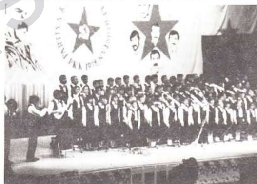
Yaklaşık 100 kişiden oluşan koro, devrimci marşlar sundu

Folklorlardan sonra gecenin anlamına ilişkin Kürtçe siyasi ko-