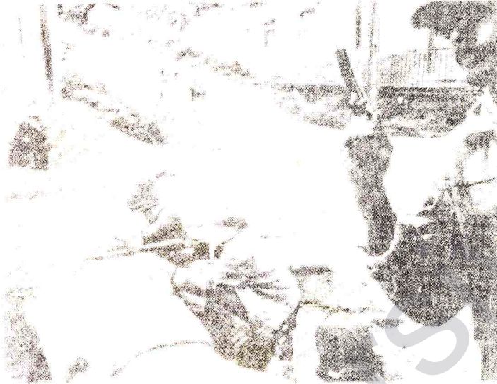
Nikaragua'da ayaklanma, Eylül 1978

Birçok yönüyle dersler alabileceğimiz Nikaragua Devrimi sahte birçok güce gereken cevabı daha 6 yıl önce vermişti. Zaferinden bugüne kadar azgın ABD emperyalizminin saldırılarına maruz kalan Nikaragua, ne emperyalizme ne de onun beslemesi Contra'lara boyun eğecektir. Nikaragua Devrimini 6. yılında da sarsılmaz kılan ve 7. yıla güvenle girmesini sağlayan önder gücünün radikal devrimci çizgisi, emperyalizme karşı NO PASARAN (Geçit Yok) sloganında somutlaşmıştır.