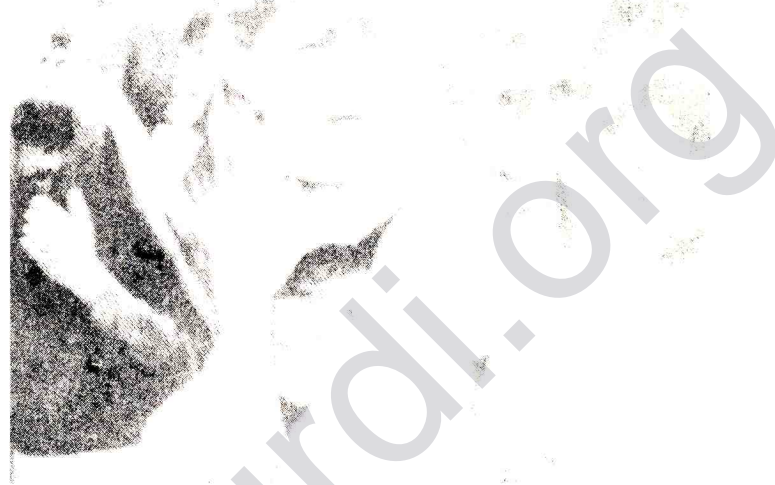
Katliamdan sonra cezaevi önüne toplanıp cinayetleri protesto eden tutuklu aileleri...

Peru'daki bu vahşi katliam tüm dünya ilerici-demokratik çevrelerinde nefretle karşılanırken, Peru'daki devlet yönetiminin durumunu da oldukça