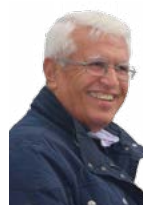
MURAD CÎWAN R04

Talana Koşka Ahmed Xanê Helo Xanê Erdelanî