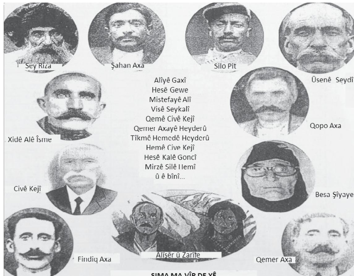
ŞİMA MA VÎR DE YÊ

ma na dîyar ra nîyada. Pê xapitîvî, vatîvî "Bêrê, aylîxe dame şîma". Muxtar dîyo. Muxtarê înan kî -hasa şîma ra- her bîyo. [Eskeran] vato, "Dewîzû top ke, aylîxe dame ci". Hata ve şuyanê malî, mal ko ra ca verdaybî, pêro dariyabî we, ameybî, vatîne "şîme aylîxe bîjêrîme". İ nîya gête merdêne. Yanî, kîncê henênî dene cenî û çênekanê xo ra ke ti halatme mendêne! Ma ke ma şîme bover, çemî fek ra ti vana sîrselak a çik a sipî kena? Hîrê qorî nîya dîzmîs kerdê, nat ra ve dot ra axîr makînayî qurmus kerdî. Wexto ke axîr makînayî qurmus kerdê, ê hur dî sîreyî dayî warro. İyê ke sîreyê peyênî de bî kî ginayî ra înan ser. Kot ra ci [kewtî meyîtan ser], pêro a jîl ra eştî bin, hama letê jêdeyê înan wes bî. Wes bî ha! Pêro a jîl ra eştî bin. Goze ver de biye, gozade gîrse. To rê sa vajî, peyê a [dara] goze de ê ju cay de eştî pêser. Hama-hama ê meyîtî resaybî gilê a goze ser. Honde meyîtî bî! ... İnan [kîrmancan] kî î qir kerdêne. İnan [kîrmancan] na