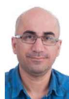
HOŞENG OSÊ R07

Talana Koşka Ahmed Xanê Helo Xanê Erdelanî