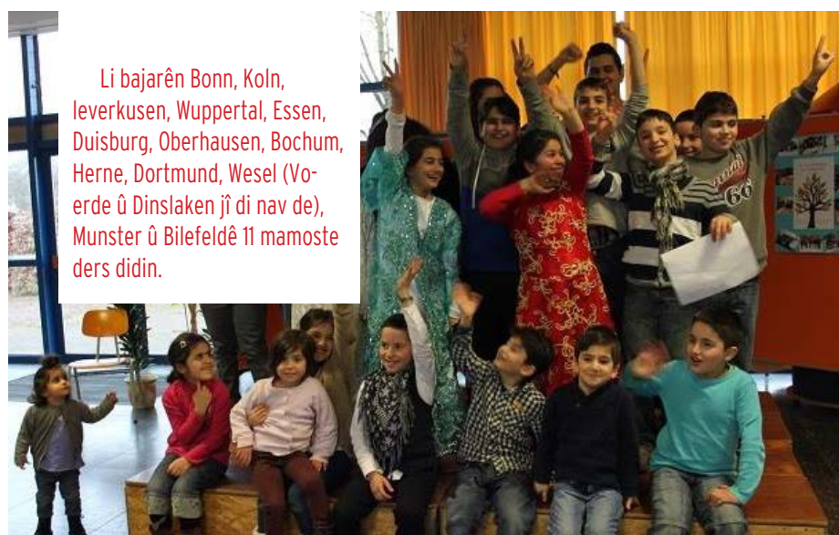
Li bajarên Bonn, Koln, Leverkusen, Wuppertal, Essen, Duisburg, Oberhausen, Bochum, Herne, Dortmund, Wesel (Voerde û Dinslaken jî di nav de), Munster û Bielefeldê 11 mamoste ders didin.

Ku em behsa perwerdeya Kurdî dikin, divê bê destnîşankirin ku di rastiyê de ders bi zaravayê Kurmancî tînin dayîn. Tenê li Kolnê mamosteyek bi Soranî ders dide. Heta niha li Almanyanayê li xwendîgehên fermî darsa Dimilî/Zazakî nehatiye dayîn.