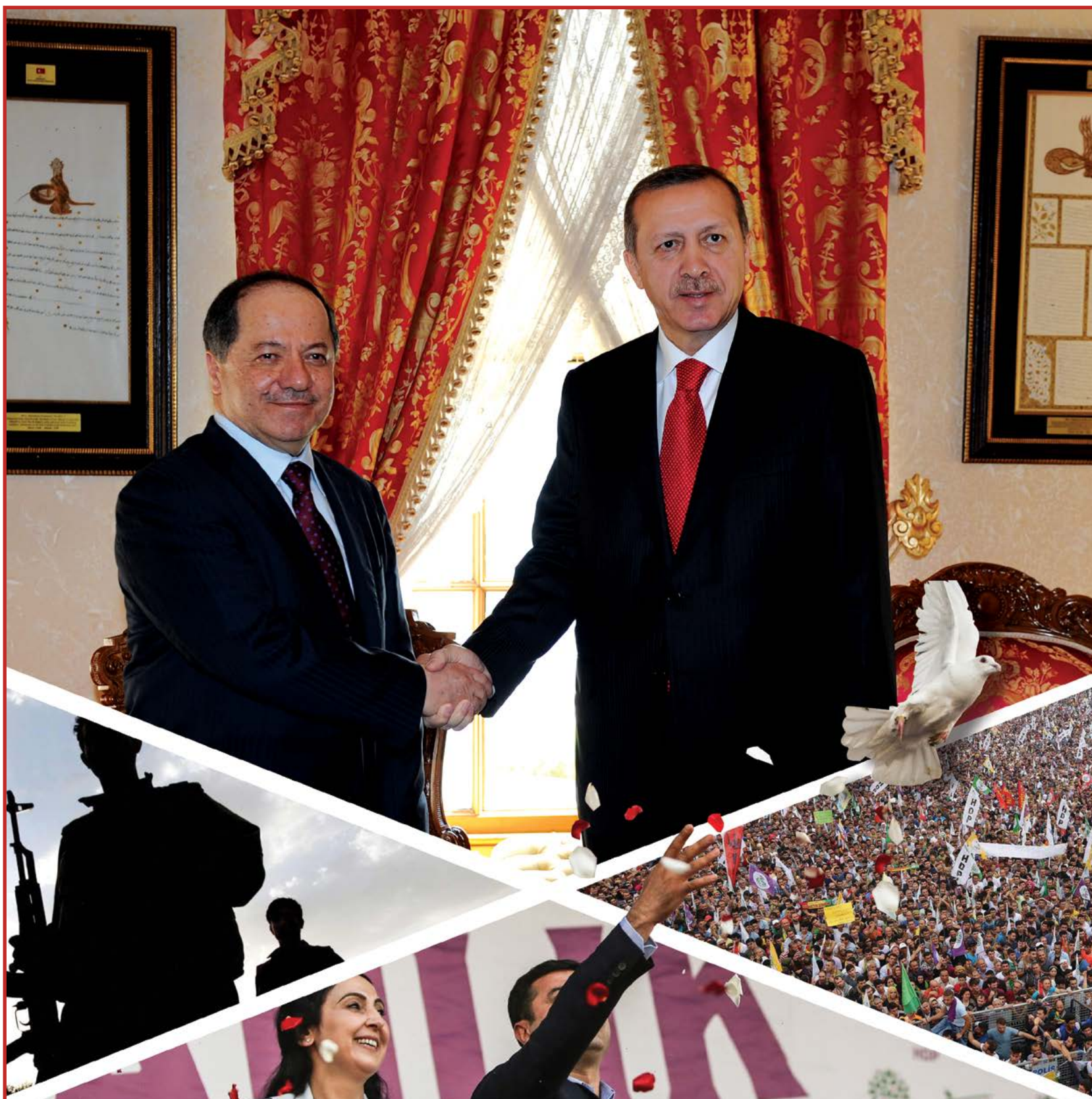
PROSEYA PÊNGAVÊN AŞTIYÊ

Jî bo xwendekar beşdarî dersa Kurdî dibin, ji dersên xwe yê dinê namînin. Dersên zîmanê dayîkê dema ku dersên din qedîyan dest pê dikin. Dema ku ders qedîyan divê xwendekarên Kurd beşdarî dersa Kurdî bibin. RÛPEL-14