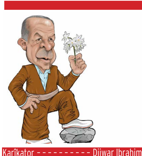
Karîkator ----- Dijwar Ibrahim