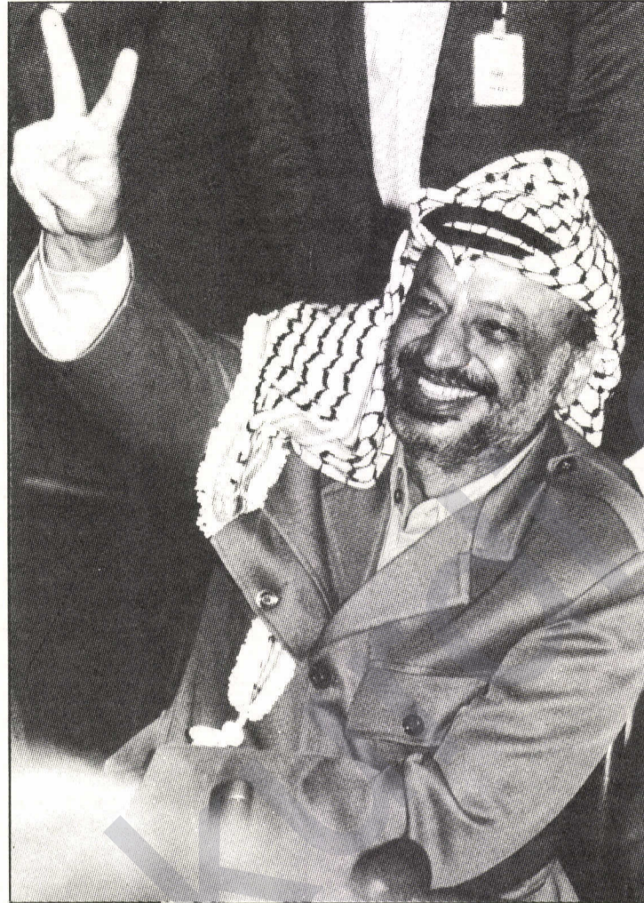
Yaser Arafat 'Di destekî me de guliyê zeytûnê û di destekî me de jî kevir heye'. Guliyê zeytûnê biryara îlankirina Dewleta Filistînê ye û kevir jî di berxwedana gelê Filistînê de domandina bi biryarbûn û tekûzbûnê ye.

DAY berê beyan kiribû ku RRF biryarên 242 û 338'an qebûl bike ew jî wê RRF nas bike. Îro ev bûye rastîyek. Lê xuyaye Gerge Bush û hevalbendên wî ji bo ne naskirina RRF'ê wê hin bahaneyên din derxin holê.