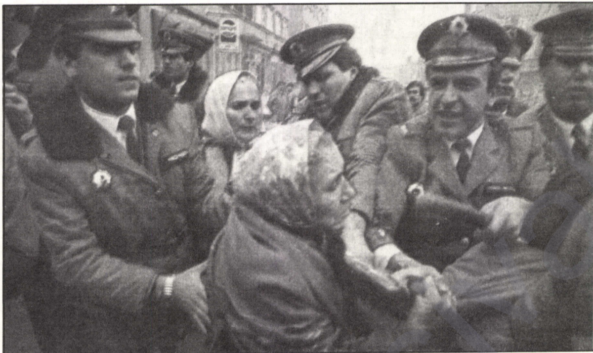
Li Stenbolê polisê êriş bir ser kesên ku ji bo piştgiriya berxwedana hefsiyên, ketibûn grewa birçîbûnê.

Ji bona protestokirina Beyannama 1'ê Tebaxê ku ew beyanname di hefsan de cilên bi yekbabet mecbûr dîke û ji bona parastina mafên xwe û başkirina rewşa hefsan; girtiyên hefsên Diyarbekrê, Eskîşehrê, Stenbolê, Aydinê, Nazîlyê, Ceyhanê, Amasyayê, Erzincanê, Edenê, Bûrsayê, Meletyê