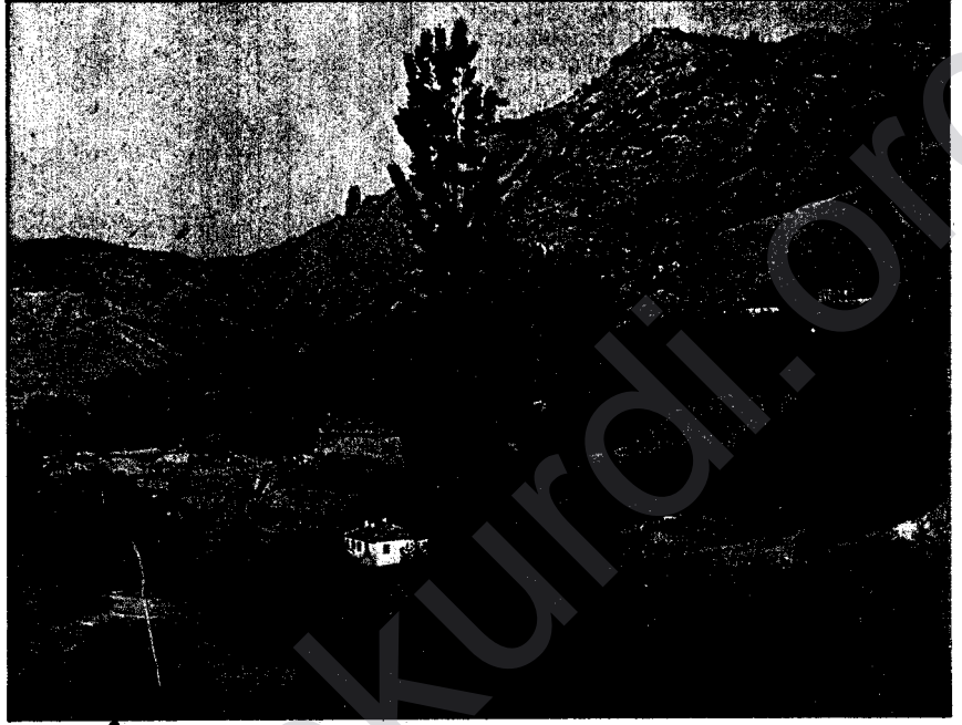
FAŞİST TÜRK ORDUSU KÜRDİSTAN DAĞLARINDA TUTUNAMAZ !

"Türk ordusu kürtleri yok etmek istiyor", "giden askeri güçler, peşmergeleri yok ederse sıra bize gelir", "kürt olan askerleri savaşa göndermiyorlar, çünkü onların savaşmayacağını biliyorlar" v.s. Bütün bunlar köyde, kasabada, tarlada, şehirlerde, işyerlerinde konuşulan şeylerdi ve bütün bunlar bir propaganda biçimini almıştı. Şunu belirtmeden ge-