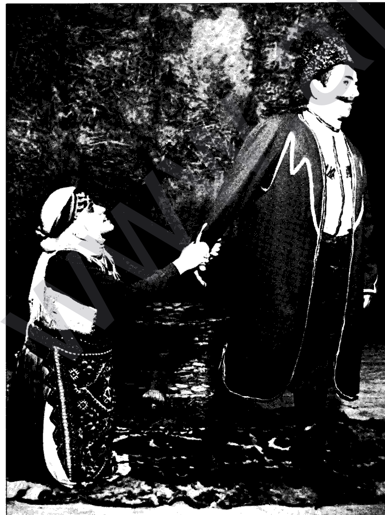
Bîstîtek ji piyesa Siyabend û Xecê

M. U. Cewherî: Ev pîrs pîrsek di çî de ye. Niha îro rewş li Sovyetê hatiye guhertin. Ew tîrsa ku berê di nav me de hebû û hevdiîna me bi dizîbû, îro