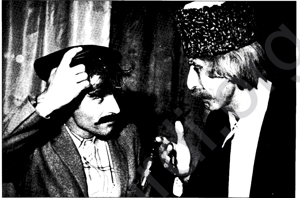
Bîstîtek ji piyesa "Sinco Qîza Xwe Dide Mêr"

Min ji sala 1968'an heya 1974'an li beşa tiyatroya Wezareta Çandî (Kulturî) ya Ermenistanê kar kir. Di sala 1974'an de min bar kir û ez hatim Tiflîsê û pêşî li Tiyatroya Ermenî ya li Tiflîsê kar kir, piştê jî ez derbasî Rojnama Gurcîstanê ya bi zimanê Ermenî bûm û niha jî di redaksiyona vê rojnamê de berpirsyarê beşa çandî û medeniyetê me.