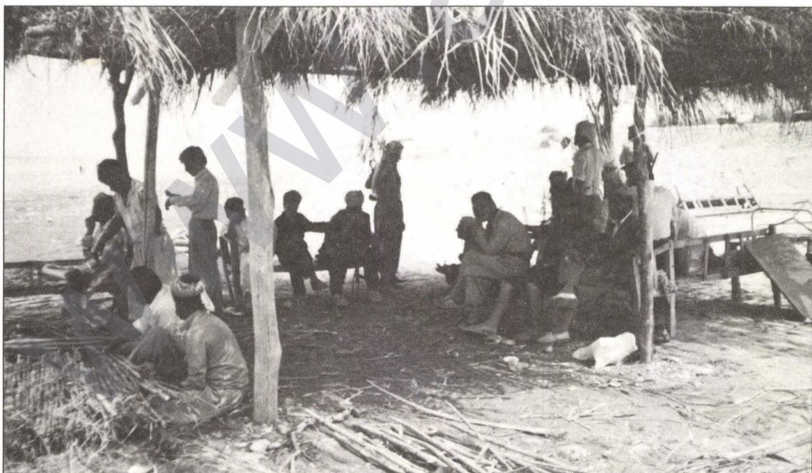
"Di 1'ê Tirmehê de em, di kelekela germa nivro ya havînê de bi kelekê ji çemê Dîclê derbas dibin û piyên xwe davêjin ser axa Kurdistanê Iraqê. Li vî alî meqerên pêşmergan li ser hidûd, li ber devê çem in. Em hinekî li wir bîhna xwe vedidin. Firavîna pêşmergan masî ne ku nuh ji çem hatine girtin. Em jî dibin şirikên firavîna wan."

Bi hêvî û endîşên mezin me gavên xwe avêtin axa rizgarkirî