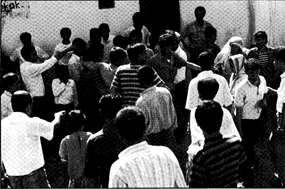
Birîndaranê Diyarbekir ra yew birîndarî benî keye