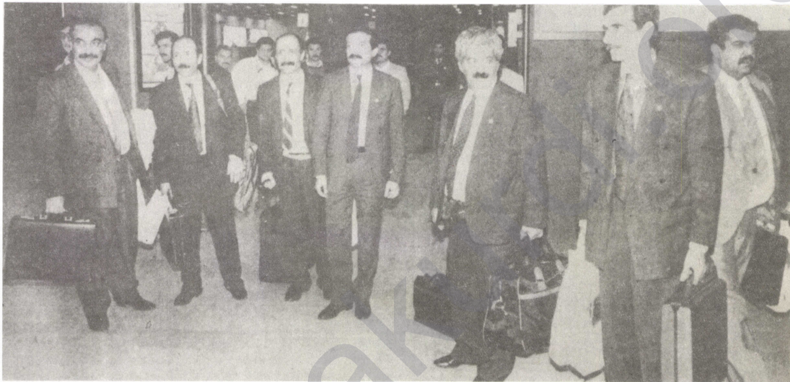
Gelo çûn zeyîtiyê û wê nema vegezin? Parlamenterên Kurd du sal berê ji bo ku beşdarî Konferansa Kurd a Parîsê bûbûn ji SHP'ê hatibû qewirandin. Wan ji HEP avakiribûn. Nuha ji bo ku cardin bên hilbijartin çûn ketin SHP'ê. Encam: Gelo çûn zeyîtiyê û wê nema venegerin?

Ev e du sal û niv e ku muxalefeta hukûmeta ANAP'ê daxwaza hilbijartinên giştî yê awarte dike. Partiya ANAP, ji bo ku hîn pirtir deng wenda neke piştî kongra xwe bi serokê xwe yê nuh Mesut Yilmaz biryara hilbijartinê girt. Li gor biryarê, hilbijartin