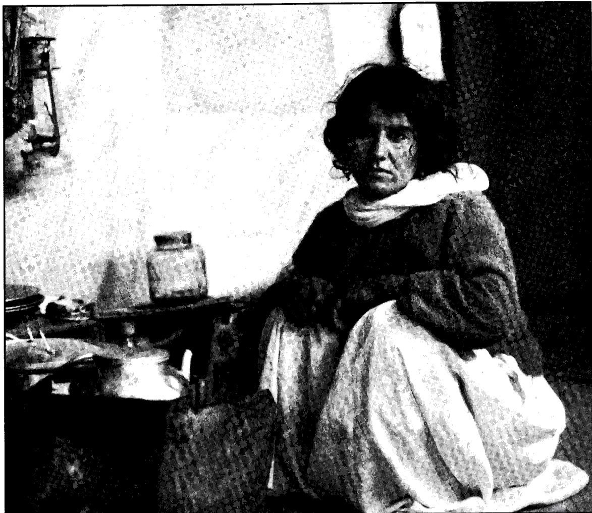
Em xwedî mal bûn, xwedî ax bûn, xwedî keriyê pez bûn. Lê nuha...

Gelo çîma mirov çîqûliya dara di bin xwe de dibire? Ma ne ye ku dara di bin xwe de birfû hov û dehbe bû.