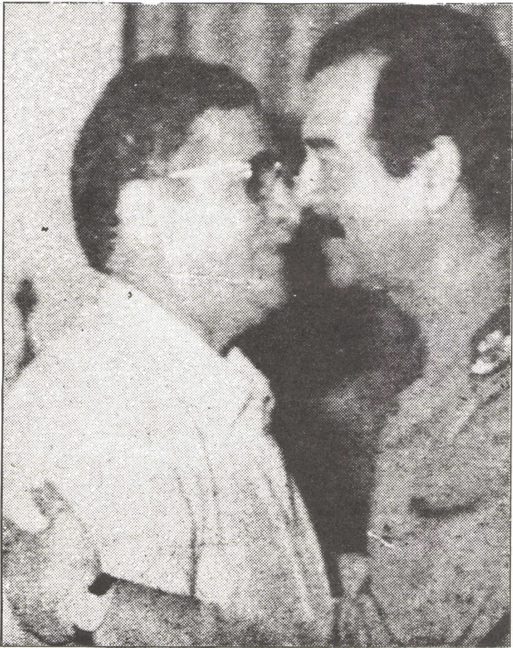
Talabanî û Seddam.. Maçîkirina mîrinê ye...ya.....?

Îro firsetek tarîxî ketiye destê Cepha Kurdistanê. Dewleta Iraqê gelek zeif e û ya herî muhîmtir, ew ji cîhanê îzole bûye. Û wer xwiyaye heta ku Seddam li ser hukum be wê Ewrûpî û Amerîkî ambargoya aborî ji ser Iraqê ranekin. Ji aliyê din ve jî li cîhanê ji gelê Kurd re sempatiyek çêbûye û mesela wî ya adil baş hatiye nasîn. Gelo Kurd û berpirsiyarên wan, wê karibin çiqasî ji vê îmkanê fêde bibînin?