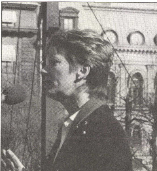
Yek ji beşdarê konsêra Stockholmê Lill Lindfors (li kêlekê)