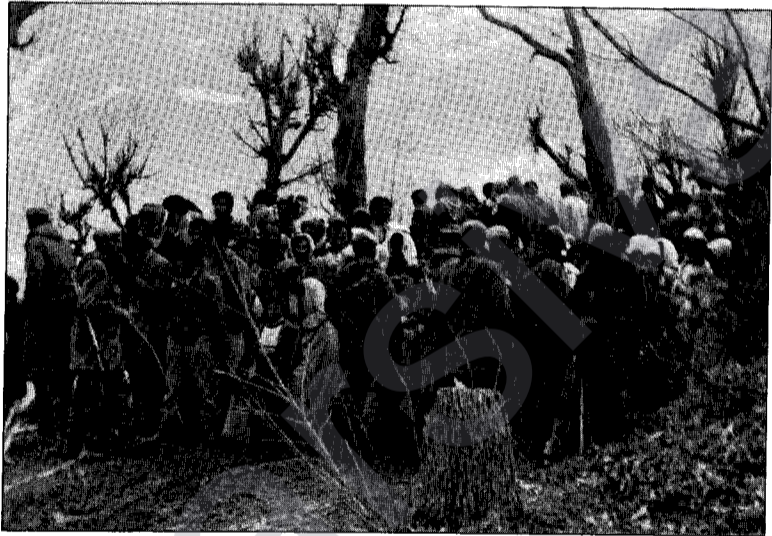
Eskerên Tirk tasek av bi 5-10 Dînarê difrotin