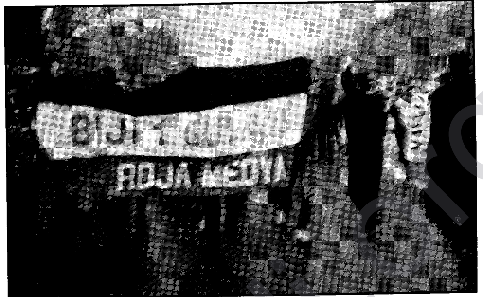
Îsal jî l'ê Gulanê di bin êrîş û zordariya dewleta Tirk de hat pîroz kirin

Turcel Dîlan/ Stenbol Îsal jî l'ê Gulanê di bin êrîş û zordariya dewleta Tirk de hat pîroz kirin. Berî l'ê Gulanê li gelek bajarên Tirkîyê û Kurdistanê tedbîrên emnî hatibûn standin. Li Stenbolê polis meydana Taksîmê, kiribû bin kontrola xwe û nehiştin kes tê-keve meydana.