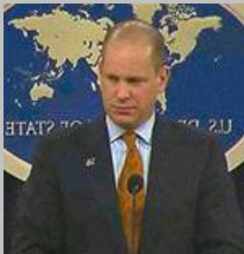
Hikûmeta Sûriyê jî bi ne yasayî û dûr ji hemû pîvanên navneteweyî yê taybet bi mafên mirovan hesiband.

Herweha ragihand ku helwesta Sûriyê li ser girtina cudabîran cihê dax û keserê ye û ev liv û riftarên